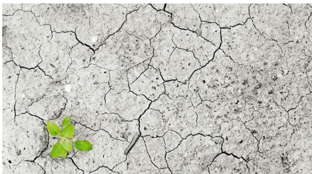
Slika broj 3. Suha zemlja uslijed nedostatka vode kao posljedica klimatskih promjena

(Izvor: http://www.naturala.hr/utjecaj-klime-na-ljudsko-zdravlje-proglasen-globalnim-zdravstvenim-problemom-21-stoljeca/5276/ )