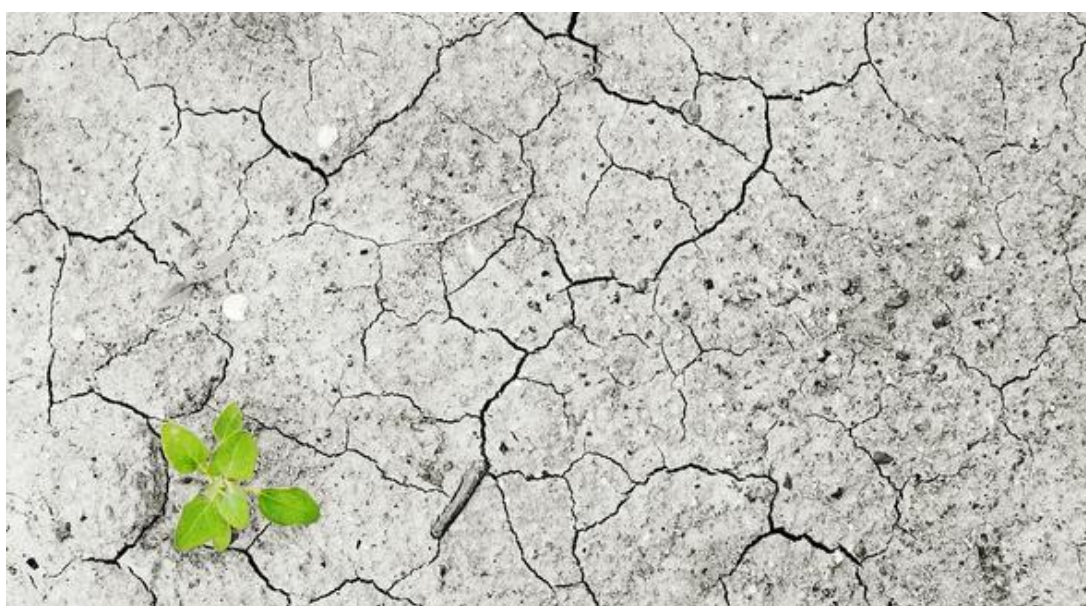
Slika broj 3. Suha zemlja uslijed nedostatka vode kao posljedica klimatskih promjena

(Izvor: http://www.naturala.hr/utjecaj-klime-na-ljudsko-zdravlje-proglasen-globalnim-zdravstvenim-problemom-21-stoljeca/5276/ )