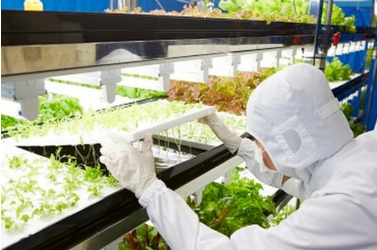
Slika broj 14. Radnik pažljivo pristupa biljakama u zaštitnoj odjeći