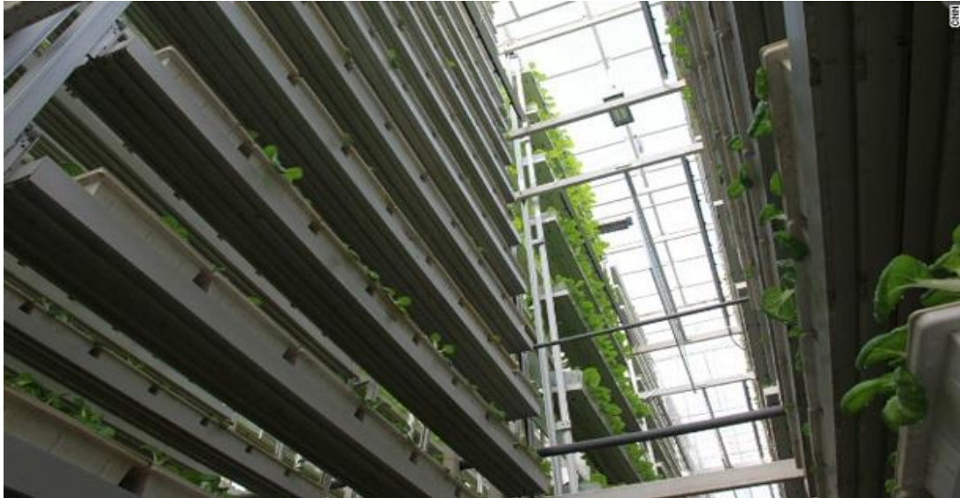
Slika broj 8. Visoki tornjevi vertikalnih farmi na kojima je uspješno uzgojena hrana

Osim Singapurske postoje još dvije vrlo značajne vertikalne farme: Valcent (Južna Amerika) i Mirai (Japan)