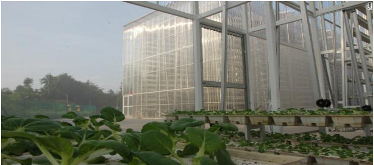
Slika broj 7. Iz prototipa u stvarnost! Prva vertikalna farma u svijetu.

2009. godine Singapur je napravio prvi prototip vertikalne farme. Kao grad koji ima preko 5 milijuna stanovnika i vrlo malo poljoprivrednog obradivog zemljišta ta ideja im je predstavljala višestruku korist. Zasad se još uvijek hrana proizvodi na malim površinama ali proizvode i do 5 puta više hrane nego na tradicionalan način. Izgrađeni tornjevi visine 9 metara već neko vrijeme uspješno proizvode povrće za stanovnike grada kao prva komercijalno usmjerena vertikalna farma u zemlji. U gradu gdje je gotovo nemoguće pronaći prazan komad zemlje, ova farma definitivno predstavlja utjehu da će se uskoro do hrane s vertikalnih farmi doći lakše i jeftinije.