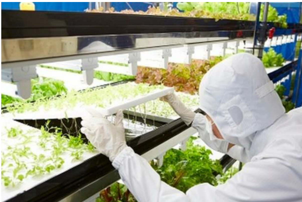
Slika broj 14. Radnik pažljivo pristupa biljakama u zaštitnoj odjeći