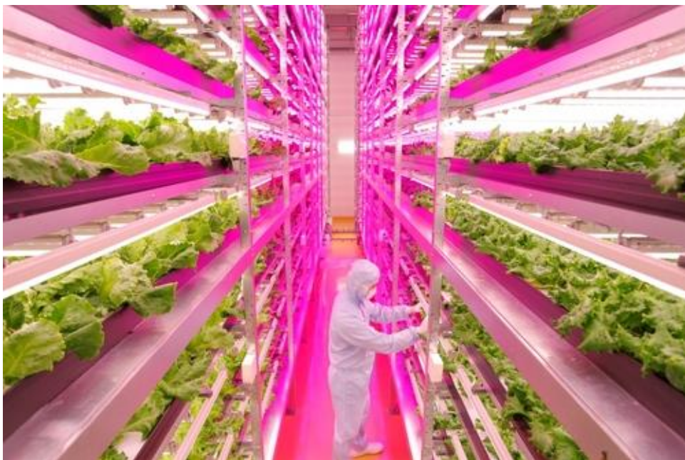
Slika broj 13. Obavezna zaštitna odjeća na zatvorenim vertikalnim farmama

Zaštita biljaka na vertikalnim farmama je potpuna suprotnost od zaštite na tradicionalnim poljoprivrednim površinama. Prije svega smanjena je potreba za upotrebom pesticida, herbicida i fungicida, posebice ako je izolacija farme uredno napravljena. Nema štetnika jer se biljke nalaze u zaštićenom i kontroliranom prostoru. Isto tako zaštićene su i od manjka i viška vode te manjka i viška sunca. Ipak kako područje gdje se biljke nalaze sterilno, svaka osoba isto tako mora biti sterilna prije ulaska u nju. Napravljena su posebna odjela kako bi se što više smanjila mogućnost zaraze ili bilo čega što bih moglo naškoditi biljkama.