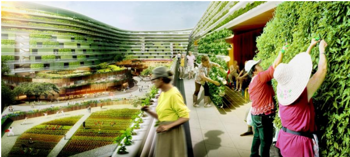
Slika broj 15. Zamisao brige za biljke i zaštite bilja na otvorenim vertikalnim farmama