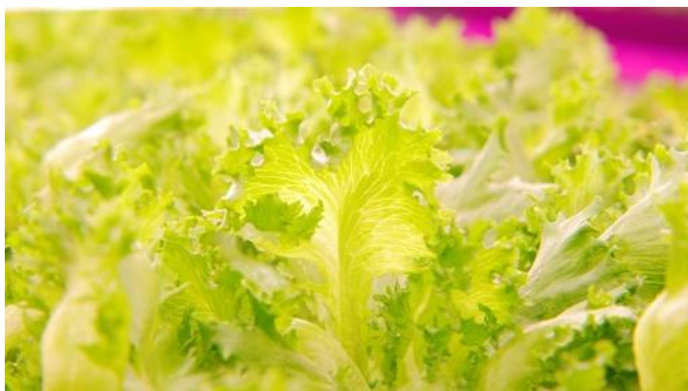
Slika broj 12. Uspješno uzgojena salata u Pink house