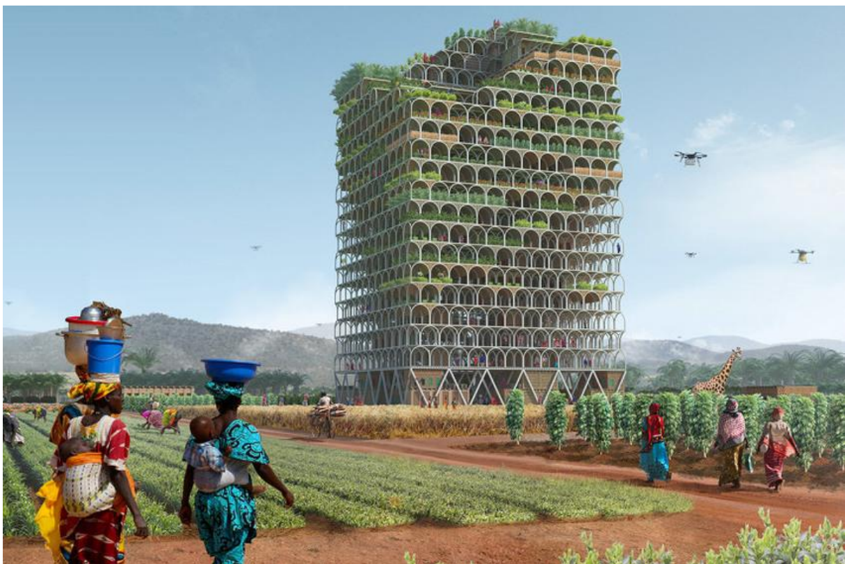
Slika broj 16. Futuristički toranj u Africi i zamisao brige oko njega