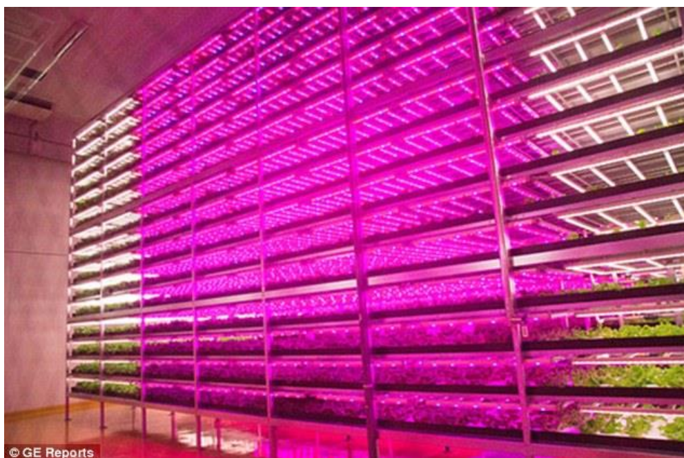
Slika broj 11. Pink house u kojem se uspješno uzgaja povrće