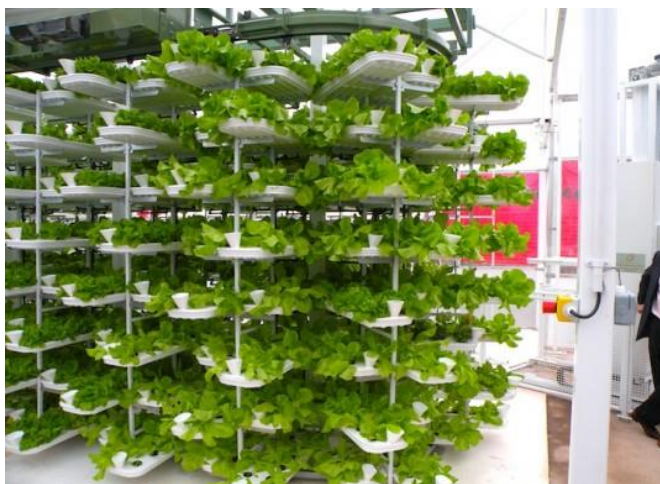
Slika broj 10. Primjer zatvorene vertikalne farme

U zatvorenim vertikalnim farmama sunčeva svjetlost koja je biljci potrebna za fotosintezu ne može do nje doći. Ako se u zatvorenim vertikalnim farmama koristi hidroponia, zemlja za uzgoj nije ni potrebna. Umjesto zemlje se koristi kamena vuna a korijen biljke je unaprijed dobro opran u hranjivoj tekućini te sve ostalo što joj je potrebno dobije iz kamene vune. Znanstvenici morali smisliti kako će omogućiti jednaku ako ne i bolju svjetlost kako bi dobili što veći prinos, i kako bi na koncu cijeli koncept zaživio. Tu je nastao Pink house.