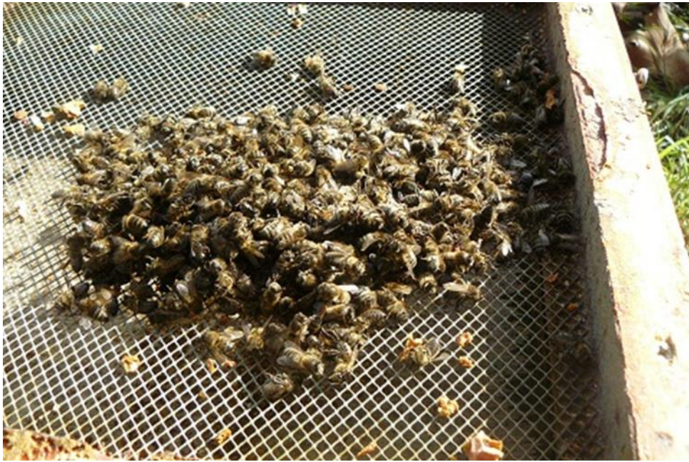
Slika broj 5. Odumiranje pčela uslijed klimatskih promjena