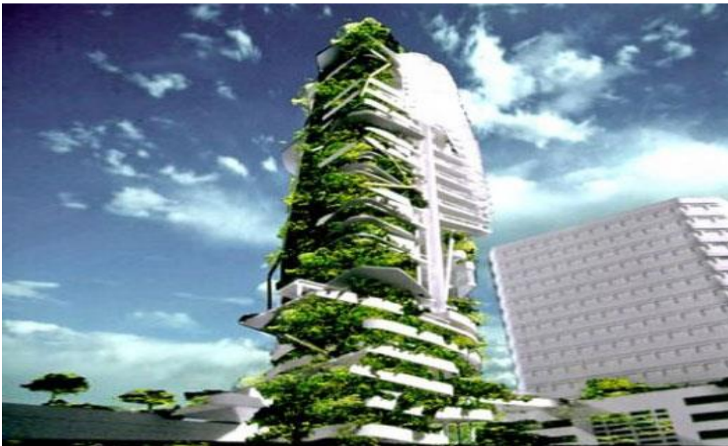
Slika broj 6. Koncept vertikalnih farmi u srcu metropole