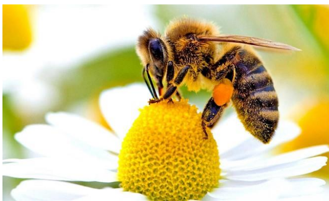
Slika broj 4 . Pčela na cvijetu skuplja nektar za med

Ako nam sva ta hrana nestane, s čime ćemo prehranjivati stoku a i sami sebe?