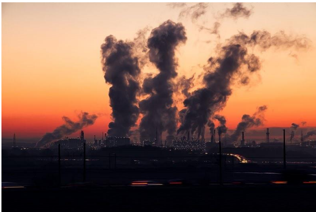
Slika broj 2. Otrovni dim samo od jedne tvornice u svijetu