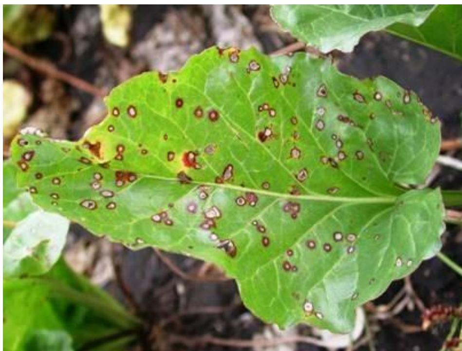
Slika 7. Pjegavost lista šećerene repe