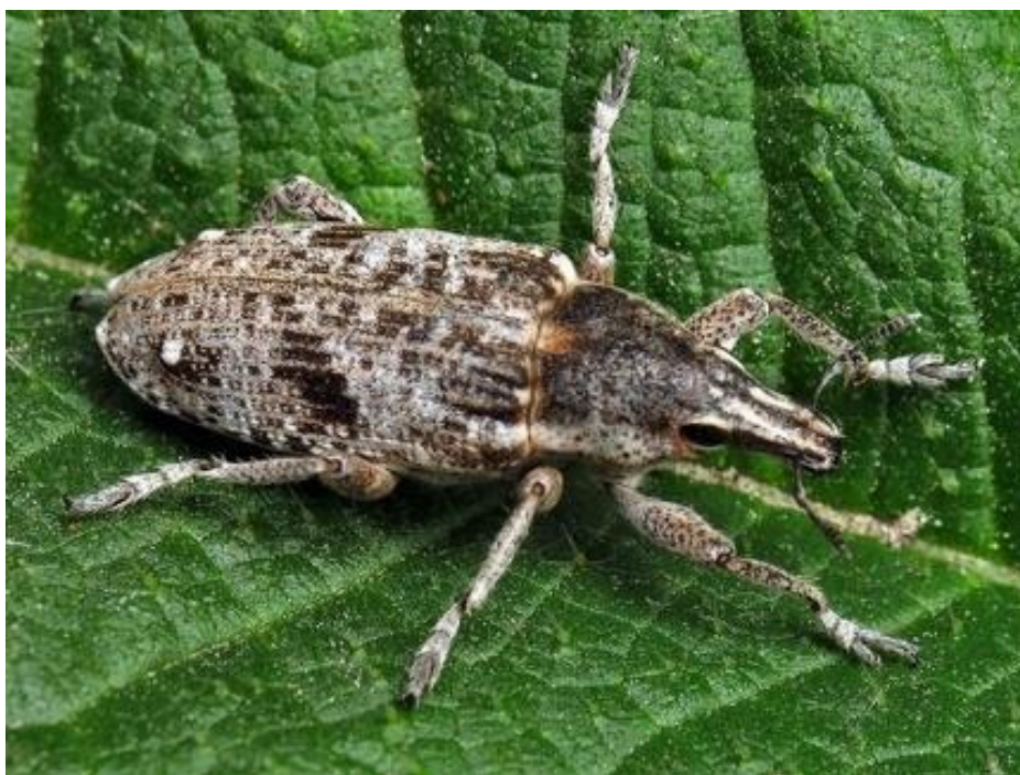
Slika 6. Repina pipa