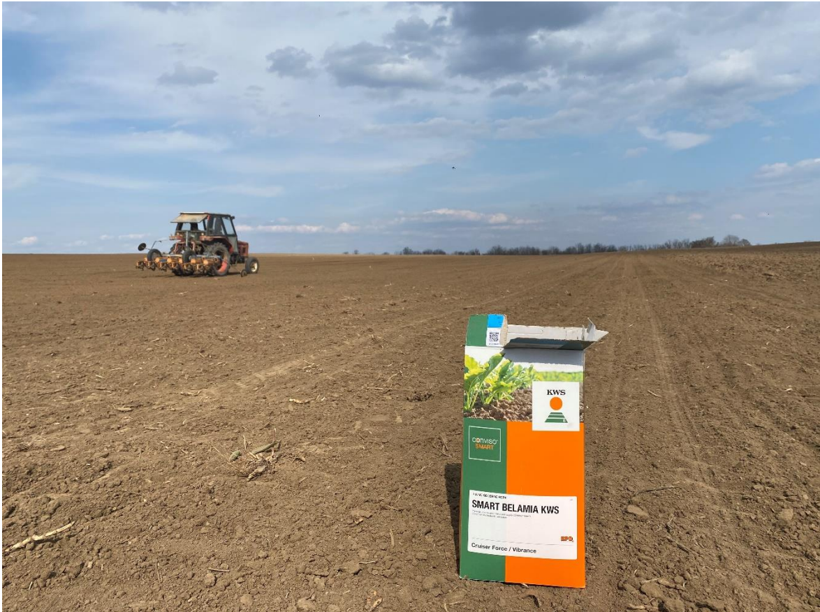
Slika 5. Sjetva šećerne repe na OPG Kolarević

Na OPG Kolarević sjetva je obavljena 15. travnja 2020. Posijana je sorta SMART BELMIA KWS na dubini od 3 cm, uz međuredni razmak od 50 cm, a količina sjemena je iznosila 120 000 sjemenki/ha.