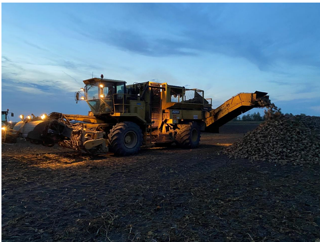
Slika 8. Vađenje šećerne repe na OPG Kolarević

Na OPG Kolarević vađenje repe je započelo 3. listopada 2020. prinos je iznosio u prosjeku 65 t/ha sa prosječnom digestijom od 16,3%. Vađenje repe se odvijalo odlicno jer nije bilo nikakvih padaline koje inače otežavaju i usporavaju posao. Repa se istovrala na rubni dio njive u obliku prizme. Zbog već spomenutog lijepog vremena odvoz repe se odvijao brzo i bez problema.