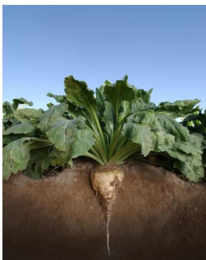
Slika 1. Šećerna repa ( Beta vulgaris L. var. saccharifera Alef.)

Šećerna repa ( Beta vulgaris var. Saccharifera Alef.) je dvogodišnja biljka iz porodice štirovki ( Chaenopodiaceae ), roda Loboda , koja u prvoj godini stvara zadebljali korijen (repu) i rozetu lišća, a u drugoj godini stabljiku, cvijet, plod i sjeme. (Pospišil, 2013.) Naziv Beta je zajednički za rod repu i dolazi od grčkog slova „beta“ zbog sličnosti klice s tim grčkim slovom, dok riječ vulgaris, koja u botaničkom nazivu označava vrstu, znači obična, a riječ saccharifera, kojom se obično označava promjena, odstupanje odnosno varijetet, znači šećeronosna ( https://www.tehnologijahrane.com/knjiga/secerna-repa-2 ).