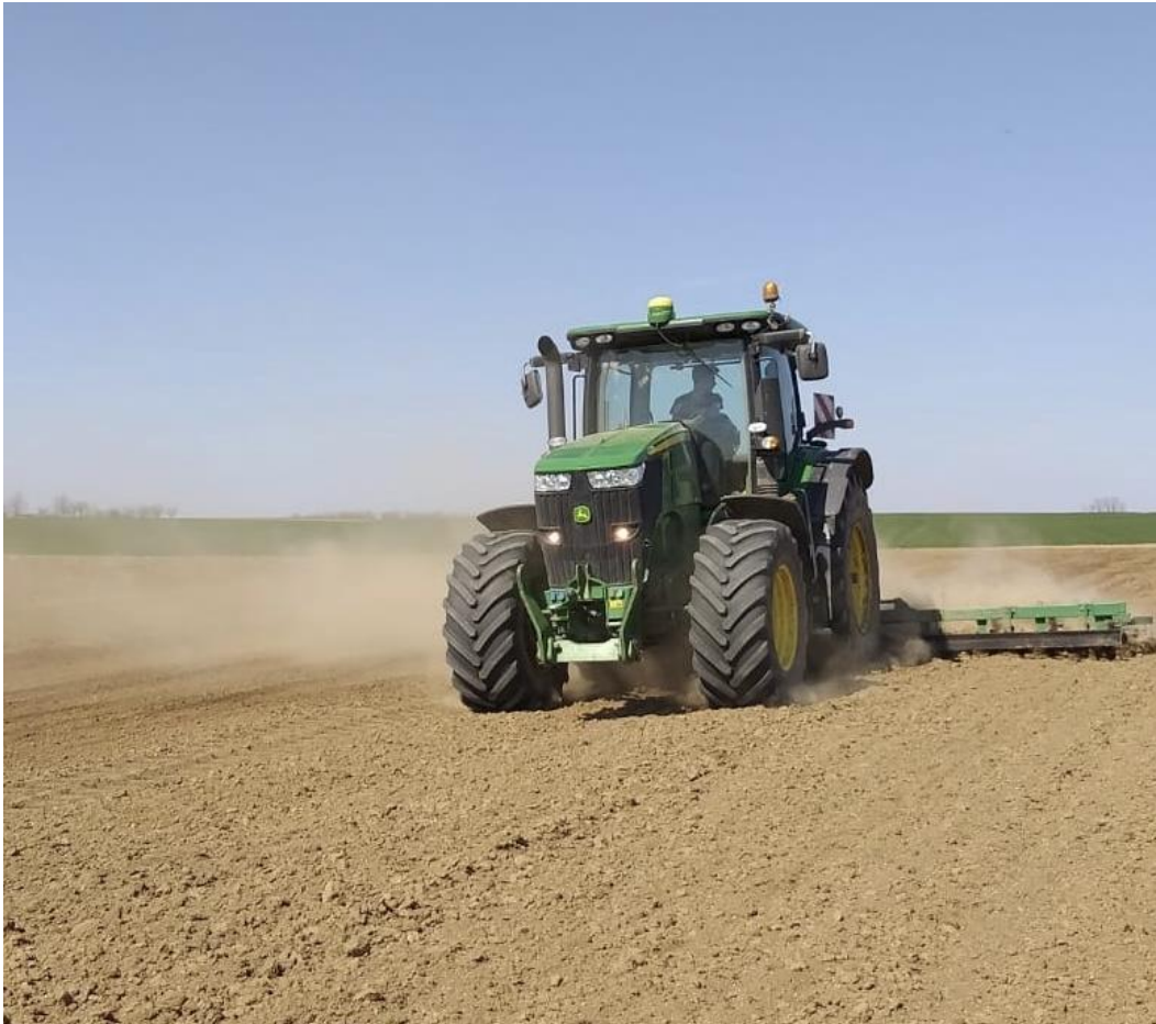
Slika 4. Predsjetvena priprema tla na OPG Kolarević

11. travnja 2020. na OPG Kolarević obavljena predsjetvena priprema tla na dubini od 10 cm u tri prohoda teškom drljačom. Nakon drugog prohoda drljače također je obavljena i predsjetvena gnojidba mineralnim gnojivom NPK 15:15:15 u količini od 150 kg/ha.