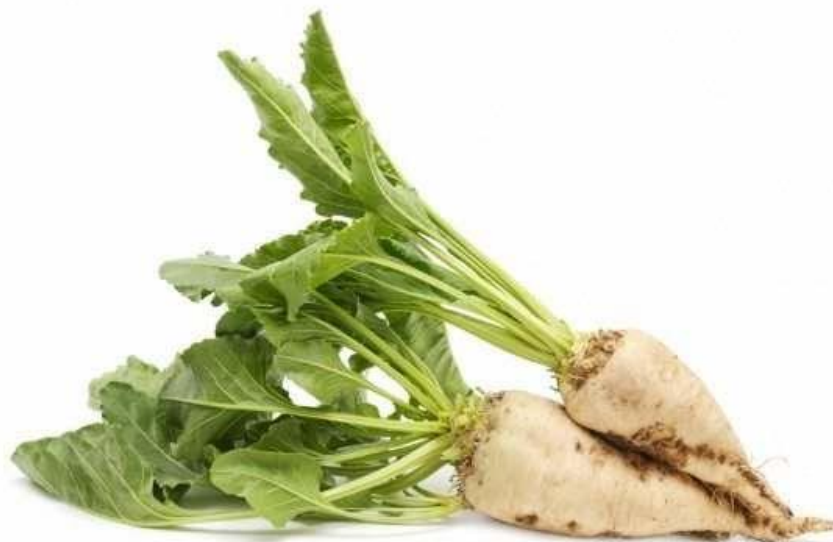
Slika 2. Korijen šećerne repe

Rep je najdonji i najtanji dio korijena, debljine oko 1 cm. Rep prelazi u razgranati sustav korjenovih žila koje prodiru u dubinu do 2,5m i širinu do 1,2m. pomoću tog korijenja biljka ima dobru opskrbu vodom i hranivima, posebice ukoliko ih nema dovoljno u oraničnom sloju tla.