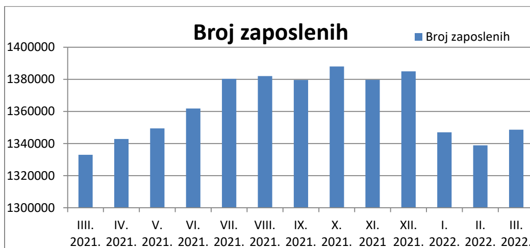
Grafikon 1. Zaposleni u pravnim osobama ožujak 2021.- ožujak 2022.

Grafikon 1. nam prikazuje fluktuaciju broja zaposlenih u pravnim osobama u zadnjih godinu dana gdje možemo vidjeti minimalni porast u odnosu na prošlu godinu, dok veljača 2022. prikazuje najmanji broj zaposlenih, a listopad pokazuje najviše zaposlenih. Svi ovi podatci se konstantno mijenjaju pa se broj može u svakom trenutku izmijeniti.