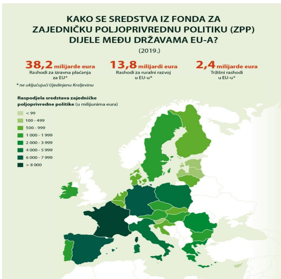
Slika 1. Raspodjela sredstava ZPP-a prema državama

Prema podacima Cedefop-a (2015.) financiranje dualnog sustava obrazovanja u Slovačkoj je iznosilo 1,7 milijuna eura bez EU potpore, a EU potporom financiranje dualnog sustava obrazovanja iznosi je tri milijuna u 2015. i dva milijuna eura u 2016. godini. EU je voljna financirati projekte koji doprinose obrazovanju, pogotovo motiviranim učenicima, no njihovo financiranje previše fluktuiraju, što znači da se financiranje može prekinuti ili smanjiti u bilo kojem trenutku pa to vodi do manjka sredstava za provođenje obrazovnih projekata.