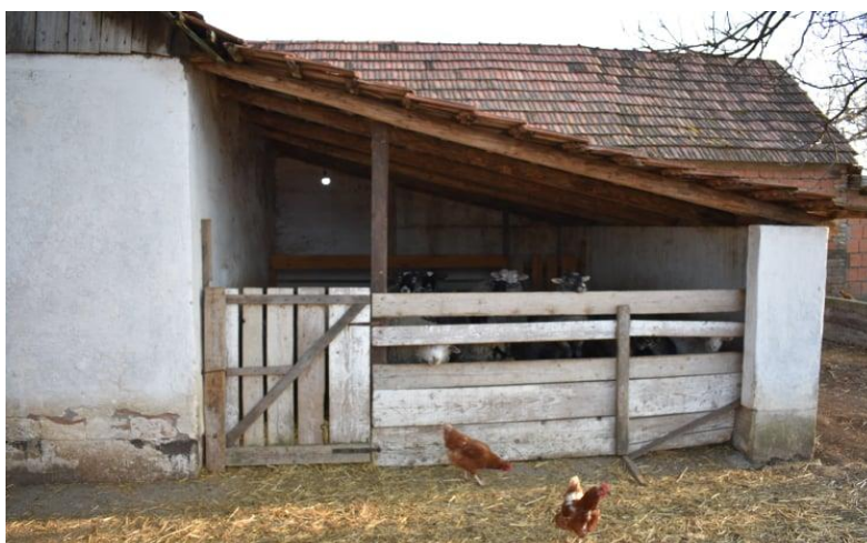
Slika 9. Prikaz poluotvorene staje u kojem su ovce smještene tijekom godine

Kada bi se gledale same ovce i njihove potrebe za smještajem, one bi se cijelu godinu mogle držati na otvorenom uz improviziranu nadstrešnicu koja bi im služila za zaklon od kiše i jakog sunca. Smještaj ovaca može biti vrlo jednostavan i ne mora biti skup kao što to bude kod gradnje objekta za druge vrste domaćih životinja. Važno je da u tom prostoru bude suho