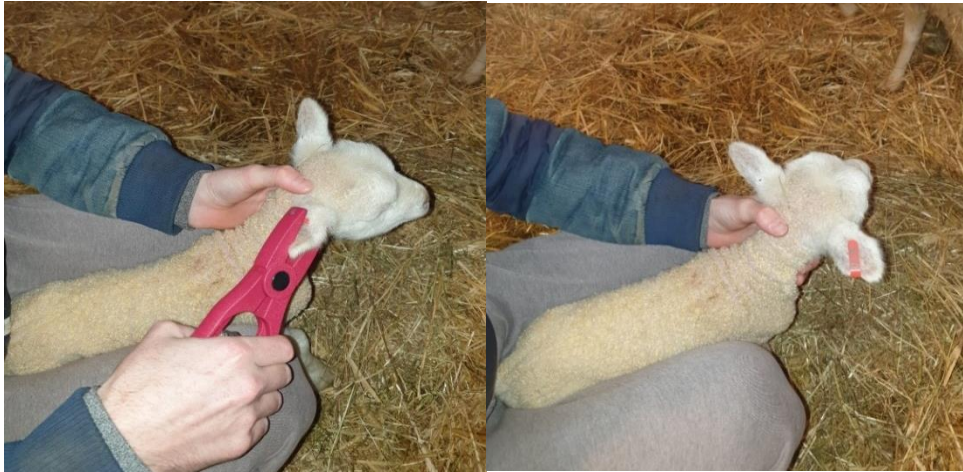
Slika 12. Prikaz označavanja janjadi privremenim markicama

Označavanje janjadi provodilo se zbog lakšeg raspoznavanja i praćenja janjadi u istraživanju. Janjad se označavala privremenim markicama nekoliko sati nakon janjenja. Vaganje je provedeno pomoću digitalne vage koja mjeri masu do 50 kg. Prvo vaganje janjadi obavljeno je odmah nakon janjenja (porodna masa). Vaganja su se obavljala kontinuirano svakih mjesec dana od dana kada se janjad vagala prvi put, odnosno od dana janjenja. Utvrđena je porodna tjelesna masa janjadi, kao i tjelesne mase u dobi od 30, 60, 90 i 120 dana. Utvrđena je i klaonička masa janjadi, odnosno masa prije klanja te masa zaklanog trupa. Izračunati su i prosječni dnevni prirasti janjadi od 1. dana do dobi janjadi od 120 dana, prema formuli: (završna tjelesna masa - početna tjelesna masa) / trajanje istraživanja. Od ukupno 15 životinja, samo 2 janjadi je bilo zaklano u dobi od 90 dana kad je postigla završne tjelesne mase. Omjer spolova u istraživanju tijekom 2021. i 2022. iznosio je ukupno 60% muške janjadi, te 40% ženske janjadi, odnosno 6 ženskih janjadi te 9 muških (Tablica 2).