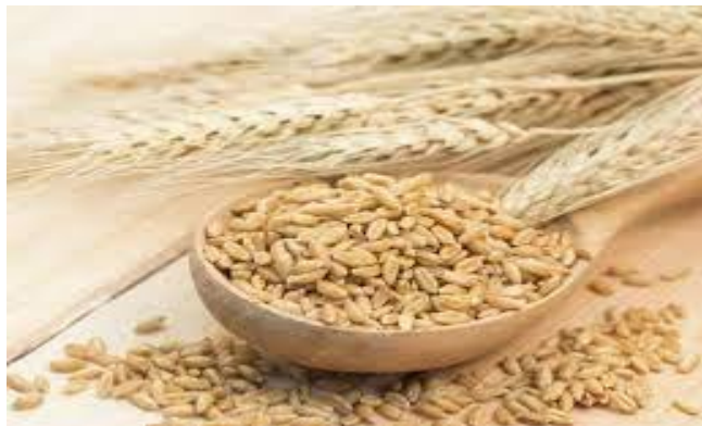
Slika 4. Ječam

Ječam ( Hordeum vulgare ) predstavlja četvrtu najveću uzgojnu žitaricu u svijetu, poslije kukuruza, pšenice i riže. Jednogodišnja trava iz obitelji Poaceae , koja ima uspravnu stabljiku s naizmjeničnim listovima. Ječam (Slika 4.) ima visoku hranidbenu vrijednost i koristi se kao stočna hrana, a u industriji za proizvodnju alkohola i piva zbog izuzetno kvalitetnog slada. Njegov slag upotrebljava se u tekstilnoj, pekarskoj i konditorskoj industriji, u proizvodnji škroba i kvasca. (Britannica.com, 2022.)