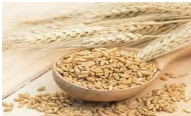
Slika 4. Ječam

Ječam ( Hordeum vulgare ) predstavlja četvrtu najveću uzgojnu žitaricu u svijetu, poslije kukuruza, pšenice i riže. Jednogodišnja trava iz obitelji Poaceae , koja ima uspravnu stabljiku s naizmjeničnim listovima. Ječam (Slika 4.) ima visoku hranidbenu vrijednost i koristi se kao stočna hrana, a u industriji za proizvodnju alkohola i piva zbog izuzetno kvalitetnog slada. Njegov slag upotrebljava se u tekstilnoj, pekarskoj i konditorskoj industriji, u proizvodnji škroba i kvasca. (Britannica.com, 2022.)