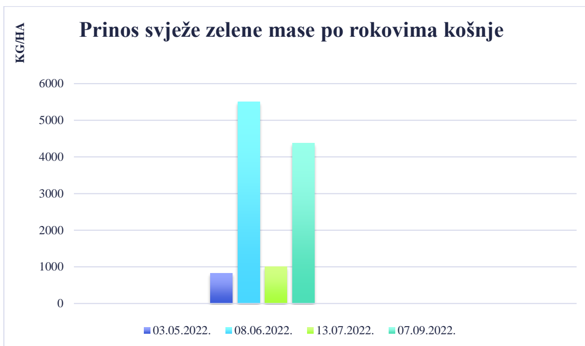
Grafikon 1. Prinos svježe zelene mase

Najveći prinos svježe zelene mase i suhe tvari dobili smo u drugom otkosu 08.06.2022. kada je vlasulja trstikasta bili u vegetativnoj fazi. Prinos vlasulje trstikaste u drugom otkosu iznosio je 5.500 kg/ha odnosno 1.320 kg ST /ha.