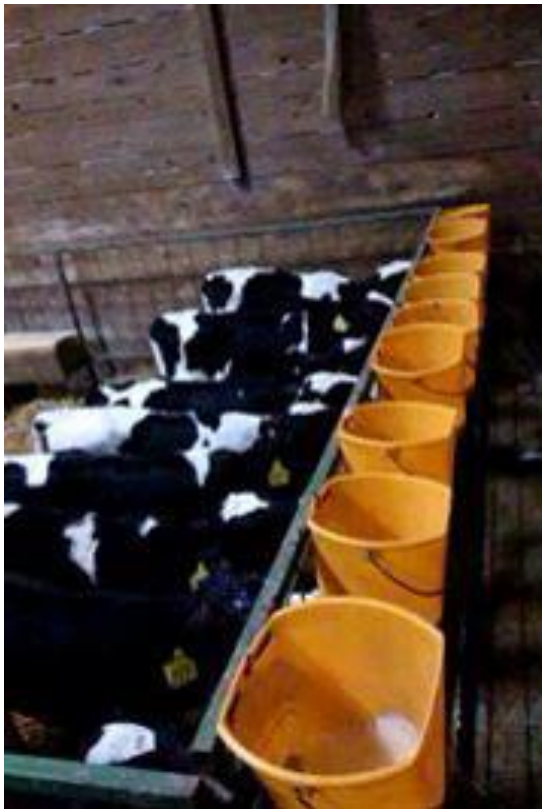
Slika 1. Grupno hranjenje teladi u skupini ( Farma Tokić, Široko Polje)

Upala pluća kod teladi najčešće uzrokovana temperaturnim oscilacijama, kombinacijom niske temperature te visoke relativne vlage zraka, kao i u lošim higijenskim uvjetima.