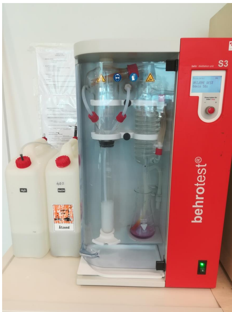
Slika 8. Destilacija dušika po Kjeldahlu