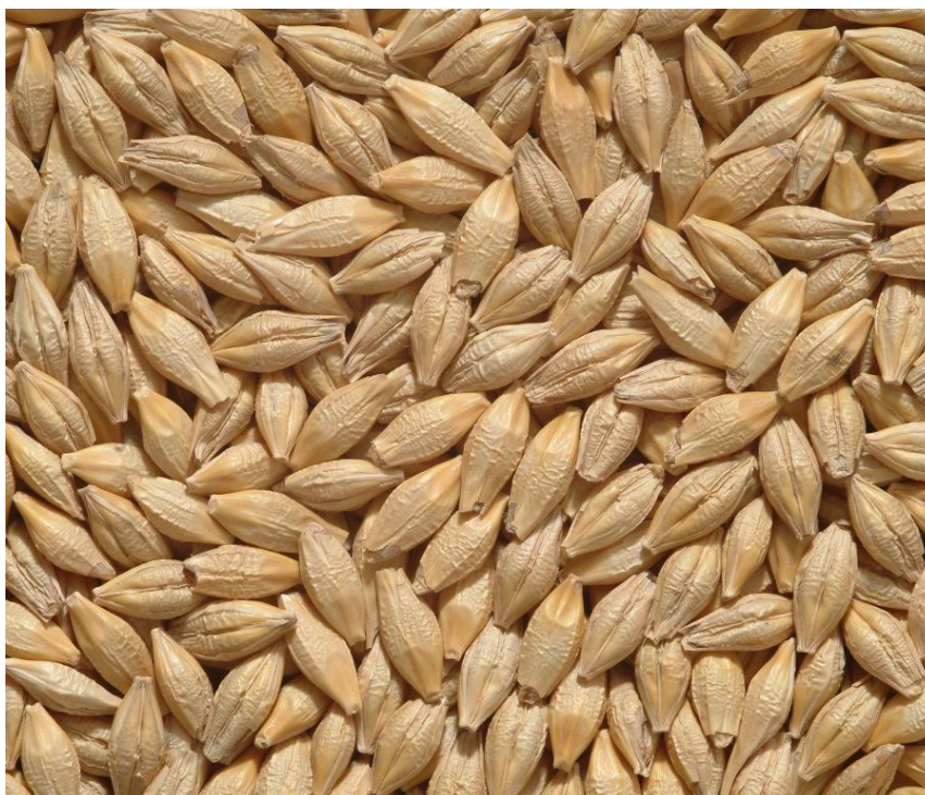
Slika 4. Zrno ječma (izvor: www.poljinos.hr )