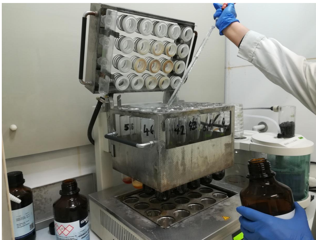
Slika 7. Razaranje biljne tvari na bloku za razaranje

Biljna tvar je razorena na bloku za razaranje (Buchi K – 437) smjesom kiselina koja se sastoji od koncentrirane sulfatne kiseline (96 % H_2SO_4 ) i 4 % perklorne kiseline na sljedeći način: na analitičkoj vagi odvagano je 1 g uzorka biljnog materijala i premješteno u kivetu za razaranje te dodano 5 ml smjese kiselina i 2-4 ml peroksida. Tako pripremljen uzorak stajao je 24 sata te je zatim razoren na bloku za razaranje na temperaturi 350-400 °C. Nakon 15-30 minuta bistri uzorci su profiltrirani u tikvice od 50 ml i nadopunjeni do oznake sa destiliranom vodom. Iz tako pripremljenih uzoraka na ICP-OES-u su određeni elementi P, K, Cu, Fe, Mn i Zn dok je N određen destilacijskom Kjeldahl metodom.