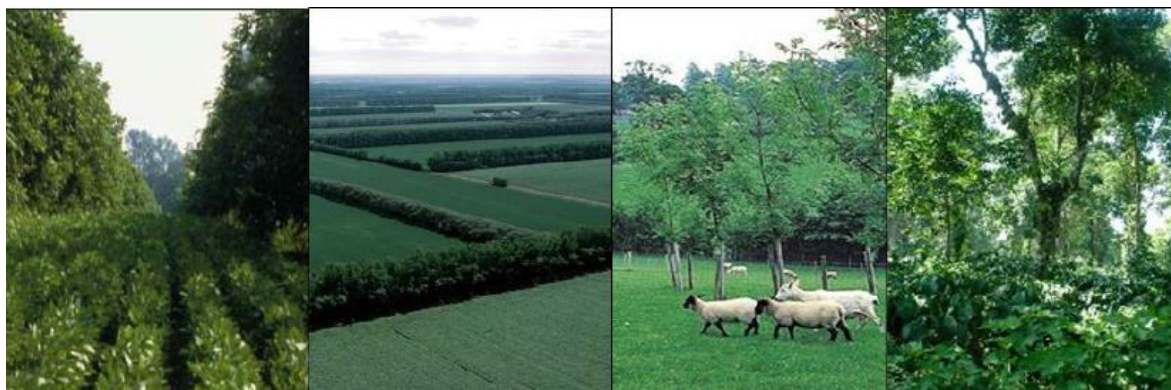
Slika 3. Konsocijacija, vjetrobrani, silvopastoralni sustav i tradicionalna šumska zajednica

poljoprivredna proizvodnja i u isto vrijeme smanjila daljnja degradacija tla. Stoga kao tri glavna poticaja za odabir ovakvih sustava poljoprivredne proizvodnje navodimo: poboljšanje svojstva tla, diversifikacija proizvodnje hrane i proizvodnje energije iz biomase drveća (Ivezić et al. 2022.).