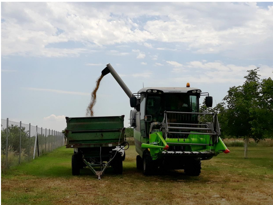
Slika 10. Žetva ječma na pokusu u Đakovu

Obrada podataka za promatrane parametre: osnovna svojstva tla, prinos, komponente prinosa, elementarna svojstva ječma, temperaturu i vlagu unutar vegetacije pokazala je da postoje određene statistički značajne razlike konsocijacijskog sustava, voćnjaka i kontrole na kojoj je bio usijan ječam. Kemijska analiza tla pokazala je da postoje statistički značajne razlike u raspoloživosti osnovnih elemenata za ishranu bilja (N, P i K). Svaki od ova tri elementa imao je veću koncentraciju u konsocijacijskom sustavu nego li na kontrolnom polju. Također, koncentracija bakra i mangana je bila statistički značajna tj. veća u konsocijaciji nego na kontrolnom polju ječma (Tablica 1).