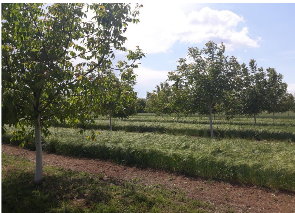
Slika 2. Konsocijacija oraha i ječma na pokusu u Đarkovu

Kod formiranja samog konsocijacijskog sustava tj. kultura koje će se združeno uzgajati potrebno je poznavati čimbenike koji će imati utjecaja na proizvodnju istih, a to su: vrsta tla, nagib i orijentaciju terena, pristup vodi. Iako agrošumarstvo pruža više mogućnosti odabira različitih sustava (silvoarabilno agrošumarstvo, silvopastoralno agrošumarstvo, alley cropping i dr.), međuredna obrada (alley cropping) najbolje integrira stabla s usjevima. Za razliku od zaštitnih pojasa i vjetrobrana sustav uzgoja u međuredovima nije ograničen na rubove polja nego integrira stabla i usjeve u cijelom polju. Najzastupljenije porodice u znanstvenih radova koji su obrađivali ovu ili sličnu tematiku na području umjerene klime bile se Fabaceae , Juglandaceae i Salicaceae . Drveće iz porodice Juglandaceae je najčešće zastupljeno stablima oraha ( Juglans spp. ) Drveće oraha u konsocijacijskom sustavu je širih međuredova u odnosu na druge voćnjake te je između njih moguće zasijati međusjev. Drvo oraha je visoke kvalitete kako u industriji tako i sam orašasti plod. Drvoredi iz porodice Salicaceae su brzorastuća stabla koja se koriste za uzgoj biomase od koje se preradom proizvede bioenergije, dok je svrha drvoreda iz porodice Fabaceae poboljšanje i regeneracija tla. Stabla porodice Juglandaceae se uzgajaju kako bi se diversificirala