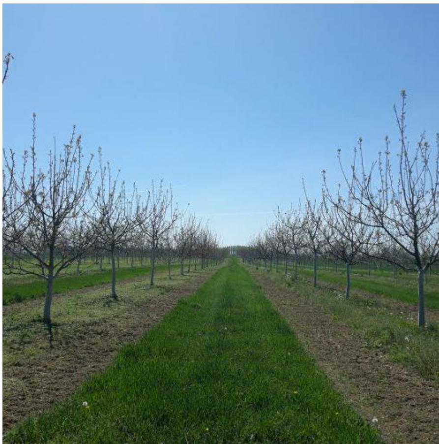
Slika 1. Ječam u busanju

Cilj istraživanja je odrediti utjecaj konsocijacijskog sustava oraha i ječma na komponente prinosa i svojstva ječma u voćnjaku starosti 12 godina, te na osnovu rezultata istraživanja ispitati produktivnost takvog sustava