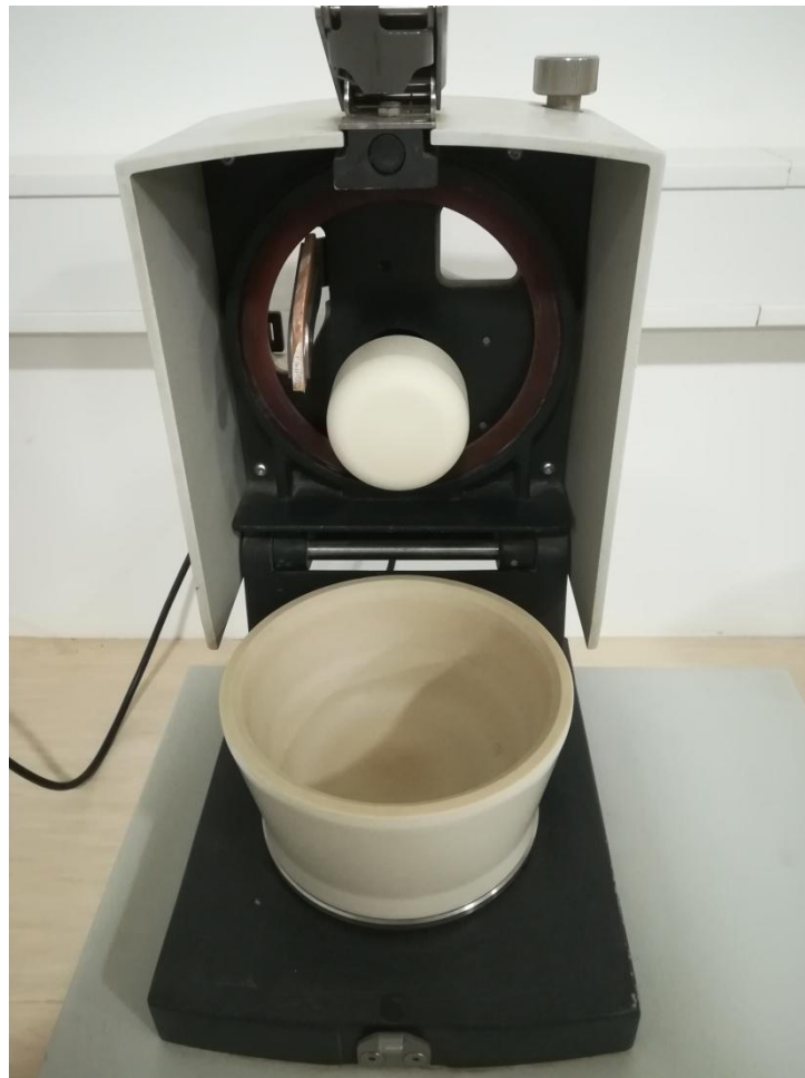
Slika 6. Mlin za mljevenje uzorka ječma

Uzroci ječma prikupljeni su žetvom s pokusnog polja u Đakovu. Sušeni su u laboratoriju na 105 °C oko sat vremena da bi se prekinula enzimatska aktivnost, a potom su se nastavili sušiti na temperaturi 60 °C dok se nisu potpuno osušili. Potpuno suhi uzorci uvedeni su u knjigu biljnog materijala s pripadajućim laboratorijskim brojem. Uzorci su samljeveni i pripremljeni za daljnje analize na mlinu (IKA Werke, MF 10 basic).