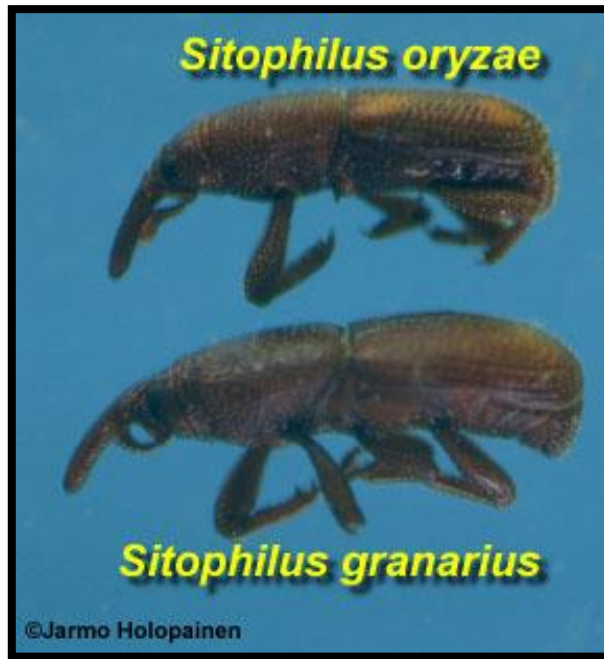
Slika 3. Razlika u izgledu imaga između S. oryzae i S. granarius