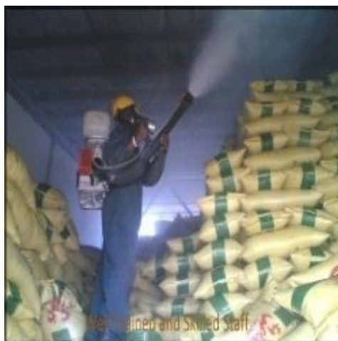
Slika 10. Primjena fumigacije

mnogo rada na hermetizaciji prostora, neposredno nakon provjetravanja roba može biti napadnuta od štetnika koji dolaze sa strane, o fumigaciji treba obavijestiti najbližu zdravstvenu ustanovu i protupožarnu službu. Veliku pozornost treba obratiti i na rezistentnost štetnika. Do rezistentnosti može doći ukoliko je fumigacija obavljena nepravilno odnosno ukoliko neki od uvjeta fumigacije (npr. hermetizacija prostora) nije ispunjen. Jedinke preživjele tretmane fumigacije kroz nekoliko generacija stvaraju otporne, te zatim i rezistentne populacija štetnika na fosfin.