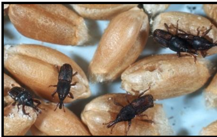
Slika 2. Imago S. oryzae na zrnu pšenice

U jednom zrnu može se naći više od jedne ličinke. Ličinke su sposobne hraniti se i u oštećenom zrnu. U našim uvjetima ovaj štetnik ima najviše 3-4 generacije godišnje, ali u zagrijanoj masi zrnja i znatno više. Kod temperature od -1 °C do -4 °C ugiba za osam dana, kod -6,5 °C do -9 °C za tri dana. Povećanje vlage zrna povećava otpornost žiška na hladnoću. Kod 4,5 °C u žitu koje sadrži 12% vlage ugiba nakon 16 dana, u žitu sa 14% vlage nakon 24 dana, a u žitu sa 17% vlage nakon 30 dana.