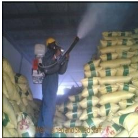
Slika 10. Primjena fumigacije

mnogo rada na hermetizaciji prostora, neposredno nakon provjetravanja roba može biti napadnuta od štetnika koji dolaze sa strane, o fumigaciji treba obavijestiti najbližu zdravstvenu ustanovu i protupožarnu službu. Veliku pozornost treba obratiti i na rezistentnost štetnika. Do rezistentnosti može doći ukoliko je fumigacija obavljena nepravilno odnosno ukoliko neki od uvjeta fumigacije (npr. hermetizacija prostora) nije ispunjen. Jedinke preživjele tretmane fumigacije kroz nekoliko generacija stvaraju otporne, te zatim i rezistentne populacija štetnika na fosfin.