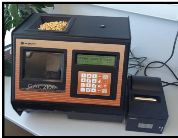
Slika 13. Vlagomjer DICKEY-john GAC 2100