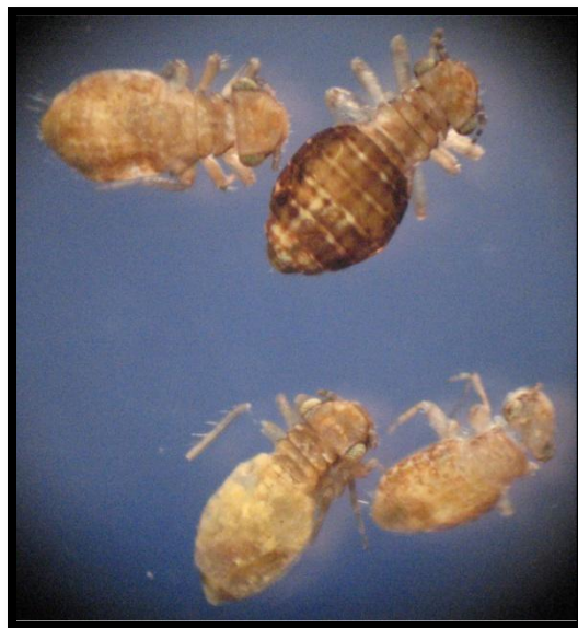
Slika 8. Prašne uši

Dužine tijela 1-2 mm, svijetlo sive do smeđe boje (Slika 8.). Odrasli oblici su beskrilni, s rudimentiranim krilima ali ima i krilnih oblika (mogu imati 2 para jednostavnih krila). Imaju tanka duga ticala i dosta duge noge. Ličinke su slične odraslim kukcima. U našim skladištima je otkriveno 18 vrsta iz nekoliko rodova: Liposcelis , Trogium , Lepinotus , Lachesilla .