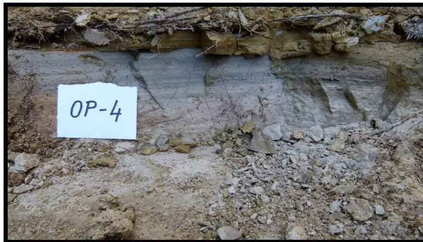
Slika 11. Uzorak DZ OP-4 s lokaliteta Opatovac

Uzorak D-01 uzet je iz bušotine na lokalitetu Podsusedsko Dolje koji se nalazi se na južnim obroncima Zagrebačke gore, dok je uzorak OP-4 (Slika 11.) uzet s područja Slavonije na lokalitetu Opatovac. Dijatomejska zemlja Celatom® Mn 51, proizvedena je u SAD-u i registrirana je kao insekticid za zaštitu uskladištenih poljoprivrednih proizvoda. Pripada grupi DZ sa srednjom do povišenom djelotvornosti na skladišne kukce i u široj je uporabi u pojedinim zemljama u svijetu.