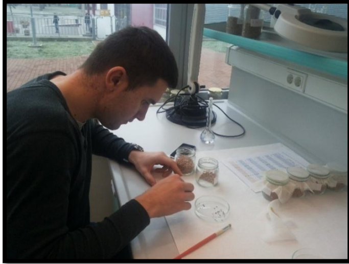
Slika 14. Pregled i uklanjanje uginulih jedinki nakon 7 dana

ponovno prosijan kako bi se odvojilo zrno od kukaca. Bilježene i su žive i uginule jedinke potomstva tretiranih vrsta kukaca.