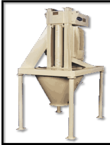
Slika 9. Aparat Entoleter