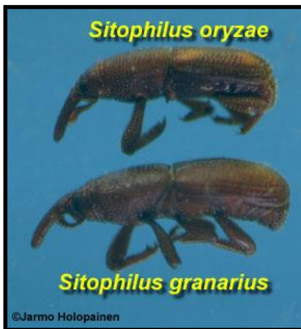
Slika 3. Razlika u izgledu imaga između S. oryzae i S. granarius