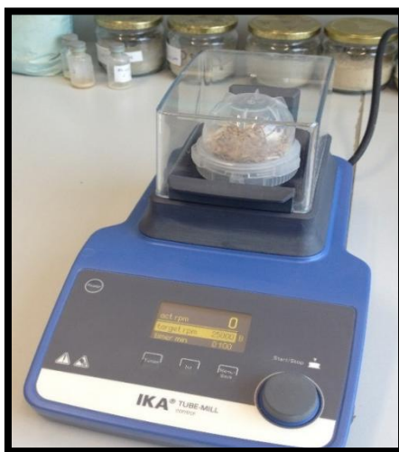
Slika 12. Mlin Tube Mill control IKA

Korištene su dvije vrste test kukaca: rižin žižak Sitophilus oryzae (Linnaeus) i žitni kukuljičar Rhizopertha dominica (Fabricius). Kukci su uzgajani u kontroliranim uvjetima na 28 do 30°C i RVZ 60-70% u Laboratoriju za posliježetvene tehnologije na Poljoprivrednom fakultetu u Osijeku. U testovima su korišteni odrasli kukci starosti 7-21 dan pomiješanoga spola.