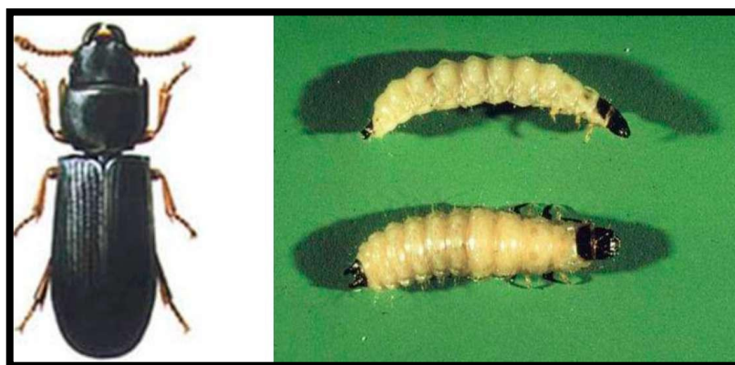
Slika 5. Imago i ličinka Tenebrioides mauritanicus

Ličinka: Bijele je boje, s tamnim prednjim i stražnjim segmentom te s dvjema tamnim izraslinama poput kliješta na kraju zatka. Odrasla ličinka naraste do 19 mm.