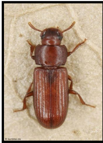
Slika 6. Imago Tribolium confusum

Pripada najčešćim sekundarnim štetnicima žitarica u nas. Ima spljošteno tijelo, dužine 2,6 do 5,2 mm (Slika 6.). Ličinke su žućkaste boje, okrugla tijela, dužine oko 6mm. Termofilan je štetnik (već pri 7 °C ugiba nakon 25 dana); bez hrane izdrži od 20-40 dana; obično ima dvije generacije godišnje. Oštećuje i zdrava zrna, ali s 12,2% vlage i više, kada oštećuje i pojede klicu, a nakon toga i čitavo zrno.