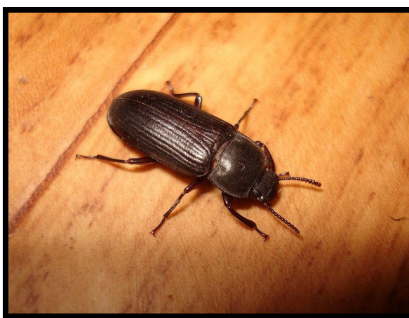
Slika 7. Imago Tenebrio molitor

Najveći štetni kornjaš u našim skladištima, javlja se često i u mlinovima. Tijelo je dugo 12-17 mm, gotovo crne boje (Slika 7.). Ličinka ima valjkasto žuto tijelo, dugo do 28 mm sa snažnim usnim ustrojem; ima jednu generaciju godišnje, iako se razvoj može protegnuti i na dvije. Optimalna temperatura je oko 25 °C. Ličinke su vrlo otporne na niske temperature (žive 48 sati na -18 °C). Ženka odlaže oko 1000 jaja; razvoj ličinke traje 4-12 mjeseci. Godišnje ima jednu generaciju. Osobitu štetu može učiniti na uskladištenoj sjemenskoj robi (prvo pojede klicu). Kod 20 °C izdrži bez hrane oko 50 dana, a kod niskih temperatura i cijelu godinu. Ličinke oštećuju drvene dijelove mlinskih postrojenja, buše ambalažu od papira, jute, drveta i slično.