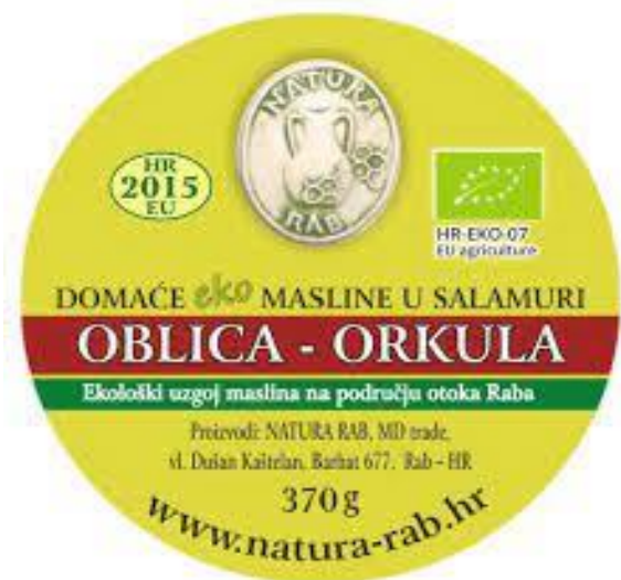
Slika 4. Deklaracija eko proizvoda iz Hrvatske

Poslovni subjekt, odnosno proizvođač je u obvezi svake godine obnoviti zahtjev za dodjelu eko znaka za svaki pojedini proizvod. Na slici 4. prikazan je eko znak eko proizvoda iz Hrvatske (domaće eko masline u salamuri), dok slika 5. prikazuje eko znak eko proizvoda iz Italije (tjestenina proizvedena iz ekološke pšenice).