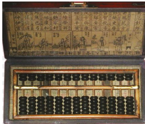
Slika 6. Abacus

Bowman (1998.) navodi kako se s abakusom, osim osnovnih operacija, mogu napraviti složeniji izračuni, kao što je podizanje broja na snagu ili uzimanje kvadratnih i kubičnih korijena. Mnoge velike svjetske civilizacije poput egipatske, rimske i kineske, koristile su abakus kao središnji instrument za izračune. Vjeruje se da su prve kamatne stope u svijetu izračunate zahvaljujući abakusima. Najpoznatiji dizajn abakusa sastoji se od drvenog okvira s malim kuglicama koje se pomiču gore i dolje kroz 10 vertikalnih traka koje se nalaze jedna do druge. Svaka traka s lijeva na desno broji više od 10 odnosno 1, 10, 100, 1000.