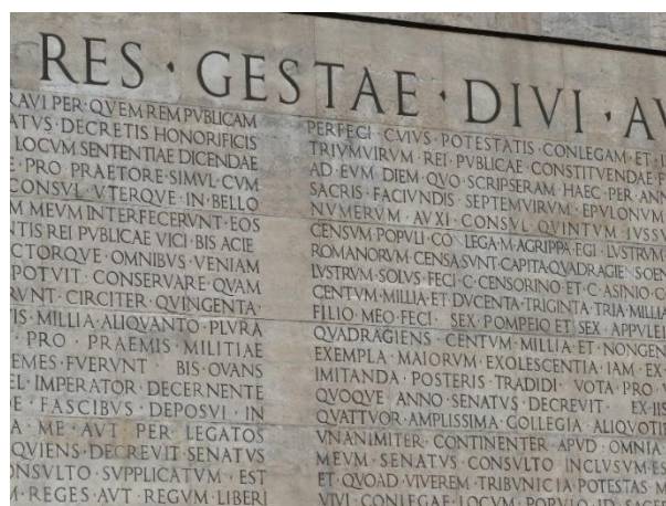
Slika 7. Res Gestae Divi Augusti

U doba cara Augusta 63. godine prije Krista pa sve do 14. stoljeća, Rimska je vlada imala pristup detaljnim financijskim informacijama o čemu svjedoči natpis Res Gestae Divi Augusti. Ovaj natpis pripadao je rimskom narodu upraviteljstva cara Augusta te navodi sve javne izdatke, uključujući raspodjele narodima, darovnice, subvencije, izgradnju hramova, vjerske ponude i rashode na kazališnim predstavama i gladijatorskim igrama. Značaj Augustovog dokumenta za računovodstvo je u tome što prikazuje da je izvršna vlast tog vremena imala pristup detaljnim financijskim informacijama te da su carski savjetnici s tim podacima planirali i donosili financijske odluke (Oldroyd, 1995.).