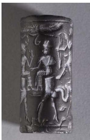
Slika 4. Cilindrični pečat

Pečati su korišteni kao administrativni alati te su obično bili dugački oko 3 centimetra. Bili su ukrašeni raznim oblicima i figuricama, a najviše su se koristili kao utisak u materijale poput vlažne gline. Najraniji uzorak pronađen je u Godin Tepe, arheološkom nalazištu u zapadnom Iranu. Nalazište je otkriveno 1961. godine, a iskopavala ga je kanadska ekspedicija koju je vodio T. Cuyler Young Jr. Važnost ovog mjesta bila je njegova uloga u ranim mezopotamskim trgovačkim mrežama. Cilindrični pečati koji su se koristili za računovodstvo na glinenim skriptama pronađeni su u zgradama koje su imale velike prostorije za pohranu usjeva (Oldroyd i sur., 2008).