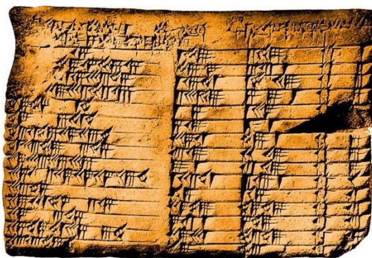
Slika 5. Plimpton 322

Najraniji zapisi o transakcijama i računima su s najranijim poznatim pismom - drevnim Sumeranima i njihovim glinenim pločama. Na tim pločama pronađeni su razni zapisi o prodaji piva i kruha, a vjeruje se kako ploča potječe iz antičkog sumeranskog grada Larse, te da je izrađen između 1822. i 1762. godine prije nove ere.