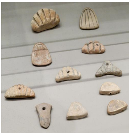
Slika 3. Glineni tokeni

Razvoj računovodstva, zajedno s novcem i brojevima, povezuje se i s oporezivanjem i trgovinskim aktivnostima vezanim za hramove. Jedan dio objašnjenja zašto računovodstvo koristi numeričku metaforu je da su novac, brojevi i računovodstvo međusobno povezani i neodvojivi od samog početka, a sve se pojavilo u kontekstu kontrole robe, dionica i transakcija u gospodarstvu Mezopotamije. Također, rana knjigovodstvena evidencija pronađena je i u ruševinama drevnog Babilona, Asirije i Sumerije, koja datira više od 7.000 godina. Ljudi toga vremena oslanjali su se na primitivne računovodstvene metode kako bi zabilježili rast usjeva i stada (Henio, Edrian. 1992.).