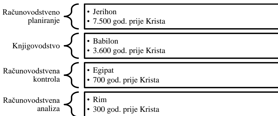
Slika 2. Struktura računovodstva i usporedba s povijesnim razvojem računovodstva

Usporedbom tradicionalne strukture računovodstva s povijesnim razvojem, može se primijetiti povezanost. Na slici 2. je prikaz strukture računovodstva i usporedba s povijesnim razvojem računovodstva.