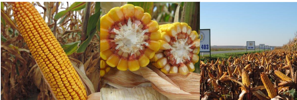
Slika 8. Plod hibrida kukuruza OSSK 403