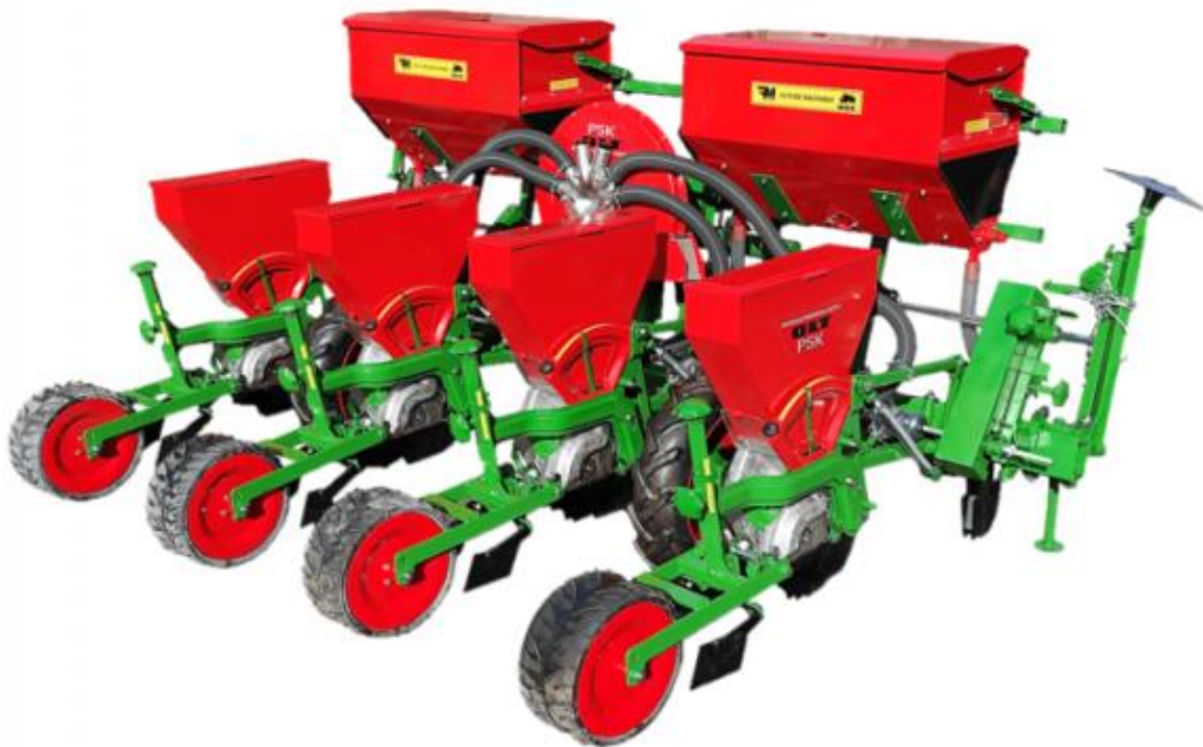
Slika 1. Pneumatska sijačica PSK-OLT 4

Sijačica tipa "PSK" je pneumatska sijačica koja se može univerzalno koristiti za sve širokoredne usjeve (Slika 1). U osnovnoj izvedbi služi za sjetvu kukuruza, a dodatnom opremom i zamjenom sijačice može se koristiti za različite primjene u sjetvi šećerne repe, soje, suncokreta i povrtnih kultura.