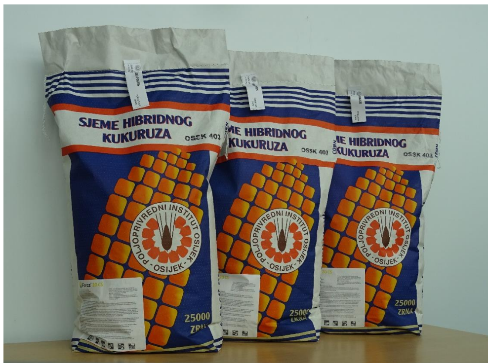
Slika 7. Sjeme hibrida kukuruza OSSK 403