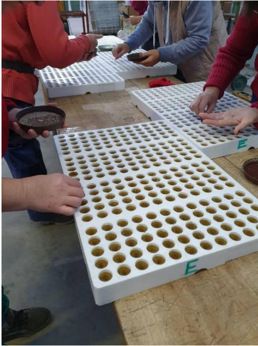
Slika 5. Sijanje rajčice