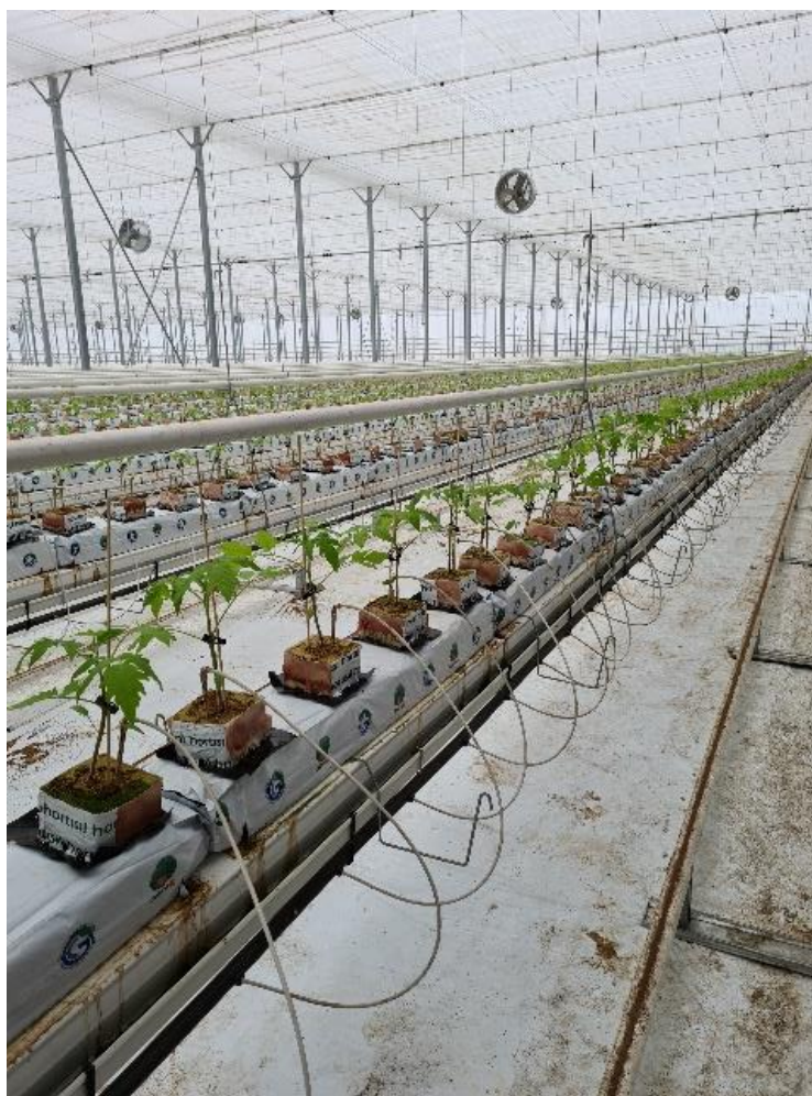
Slika 12. Sadnja

Sadnju je vrlo bitno brzo obaviti jer se presadnice premještaju iz jednog plastenika, a vani je vrlo hladno jer je prosinac. Svaki temperaturni šok za presadnicu rajčice je vrlo opasan i može ostaviti traga na cijeli prinos te iste biljke. Također je bitno posaditi sve presadnice u isto vrijeme da ne bude velike razlike između biljaka. S obzirom da je proizvedeno 5 % više presadnica nego što je potreban broj biljka za proizvodnju, bitno je očuvati taj višak jer se tijekom prvih 40 dana nakon sadnje biljke mogu zamijeniti ako je neka biljka zaostala, bolesna ili doživjela temperaturni šok.