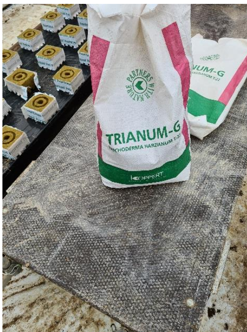
Slika 11. Trianum G

Trianum G je netoksični Koppert-ov proizvod u granulama, svrstan u sredstva za ishranu bilja te mikrobiološki stimulator za rast koji omogućuje bolje usvajanje hranjiva i vode (Slika 11.). Aplikacijom Trianuma G stvaraju se oko korijena uvjeti koji onemogućuju razvoj patogenih gljivica te se izlučuju tvari koje povećavaju otpornost na većinu gljivičnih i bakterijskih oboljenja. Ova korisna gljiva štiti usjeve od „zemljišnih patogena“ odnosno od bolesti koje su uzrokovane gljivama iz roda Fusarium , Phyitium i Sclerotinia .