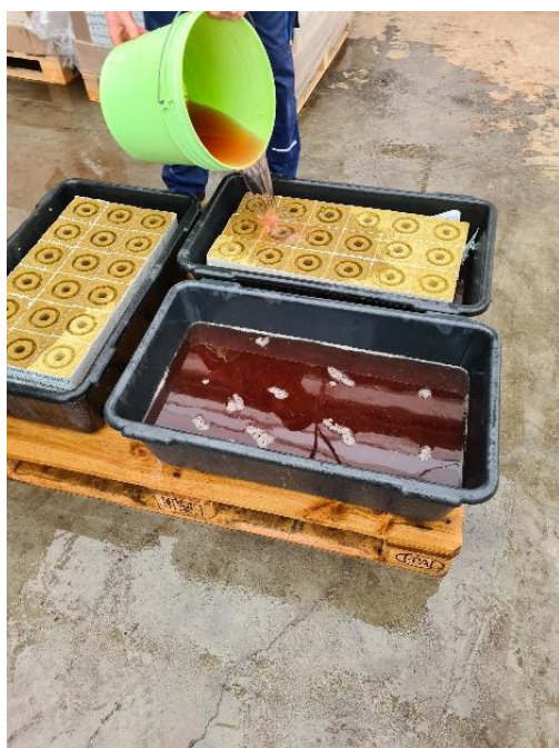
Slika 9. Natapanje kocaka

Također, rupe koje se nalaze u kocki pune se bio fungicidom Trianum G koji pospješuje razvitak korijena. Pikiranje se obavilo 12.11.2020. Pikira se 5 % više od potrebnog broja rasade za sadnju. Kocke se slažu sa razmakom da biljka ima dovoljno svjetlosti i samim time dovoljno mjesta za razvoj. Razmak između presadnica je toliki da stane 28 presadnica na dužni metar. Presadnice se također nalaze u plasteniku i u kontroliranim uvjetima. Temperatura plastenika tijekom dana je 21-22 °C, a tijekom noći 18-19 °C. Presadnice se prihranjuju s gnojivom koja se zamiješaju po receptu kojoj biljci trenutno odgovara po razvoju. Prihrana ovisi o vanjskoj temperaturi i količini sunčevih sati. Presadnice u tim uvjetima ostaju do 20-21 dan, kada se razvije sistem korijena i kada se nazire prva cvjetna grana presadnica je spremna za sadnju. Prije sadnje uz biljku se postave drveni štapići kako bi usmjeravali biljku kako da raste (Slika 10.).