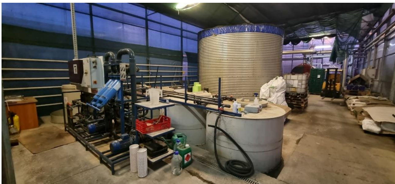
Slika 4. Pogonski kompjuter

Za gnojidbu rajčice koriste se razne kombinacije NPK mineralnih hraniva (s omjerom hraniva 7:14:21 ili 10:30:20) u količini 300-400 kg/ha. Za prihranjivanje se najčešće koriste lako topiva gnojiva u obliku kristalonskih formulacija koja su lako i brzo pristupačna biljci. Prihranjivanje se obavlja prema izboru tehnologije. Prihranjivanje rajčice treba započeti deseti dan od sadnje i traje sve do kraja vegetacije. Opskrbom hranjivom otopinom odgovarajućeg sustava makro i mikro elemenata periodički se tijekom dana od 12-19 puta osigurava sustavom kapanja putem mikroprocesora ili pogonskog kompjutera (Slika 4.).