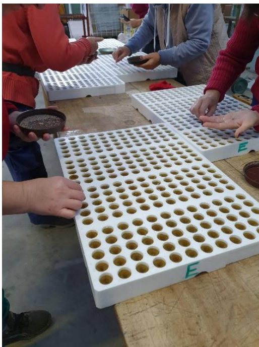
Slika 5. Sijanje rajčice