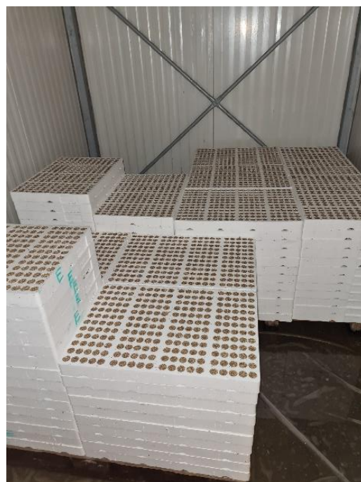
Slika 6. Kontejneri u komori