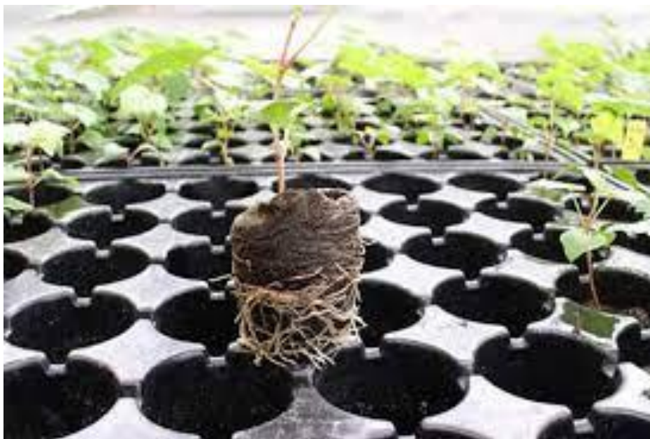
Slika 2. Presadnica

Za ranu proizvodnju na otvorenom sjetva sjemena za proizvodnju presadnica počinje u južnim toplijim područjima oko 10. siječnja, a za srednje ranu oko 15. veljače. U sjevernim područjima sjetva za ranu proizvodnju počinje oko 20. veljače, a za kasniju početkom ožujka pa sve do 10. travnja, što ovisi i o sorti koju sijemo. U zaštićenim prostorima se sve više koristi hidroponski uzgoj rajčice koji se pokazao kao isplativ tip proizvodnje. Proizvodnja rajčice se dijeli na proizvodnju presadnica rajčice, proizvodnju za svježju potrošnju te proizvodnju rajčice za preradu. U suvremenoj proizvodnji presadnice rajčice se uzgajaju kontejnerskim načinom. Sjetvu je najbolje obaviti u kontejnere (Slika 2.) s oko 450 sjetvenih mjesta, nakon sjetve kontejnere smjestiti u klijalnišne komore za naklijavanje u kojima se održava temperatura od 30 °C i potpuna zasićenost zraka vlagom. Nakon što sjeme proklije, kontejneri se iz klijalnišnih komora premještaju u grijane zaštićene prostore u kojima se održava ujednačena temperatura tijekom dana i tijekom noći 25-27 °C sve dok sjeme u potpunosti ne nikne (Parađiković, 2009.).