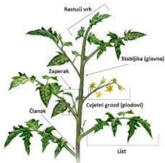
Slika 1. Prikaz biljke rajčice