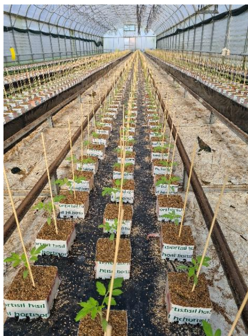
Slika 10. Presadnice