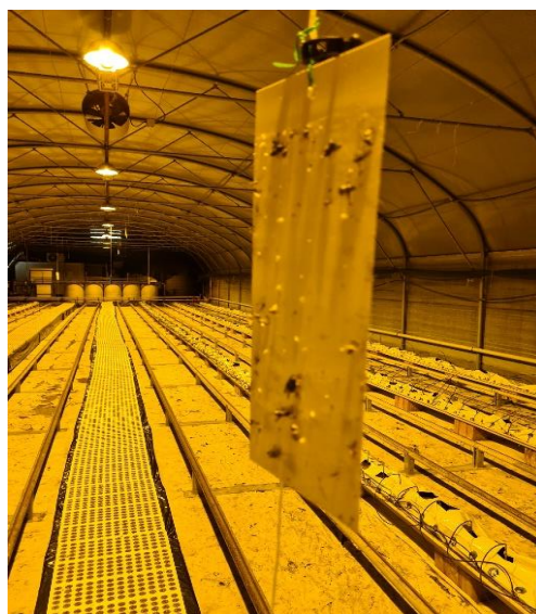
Slika 8. Žuta ljepljiva traka

Iznad kontejnera se nalaze umjetna svjetla koje se pale svaki dan od 06:00 do 22:00 sata. Kontejneri s sjemenom u plasteniku ispod umjetnih svjetala nalazili su se od 30.10 do 11.11. U plastenik se postavljaju žute ljepljive trake kako bi se zalijepili neki od insekata koji su pronašli zaštitu od zime u plasteniku (Slika 8.).