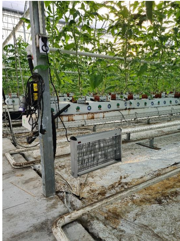
Slika 13. LED svjetla

Nakon sadnje pravilno raspoređeno preko cijelog plastenika postavljaju se led svjetla (Slika 13.). Led svjetla se još nazivaju i zamka za insekte što nam govori i njezinu svrhu, a to je privlačenje i ubijanje insekata. Od velike je pomoći jer možemo vidjeti koje je insekte ubila i tako saznajemo koji se insekti nalaze u plasteniku. Samim uvidom možemo i saznati postoji li opasnost za biljke od pojave određenog štetnika te na vrijeme reagirati ako je potrebno.