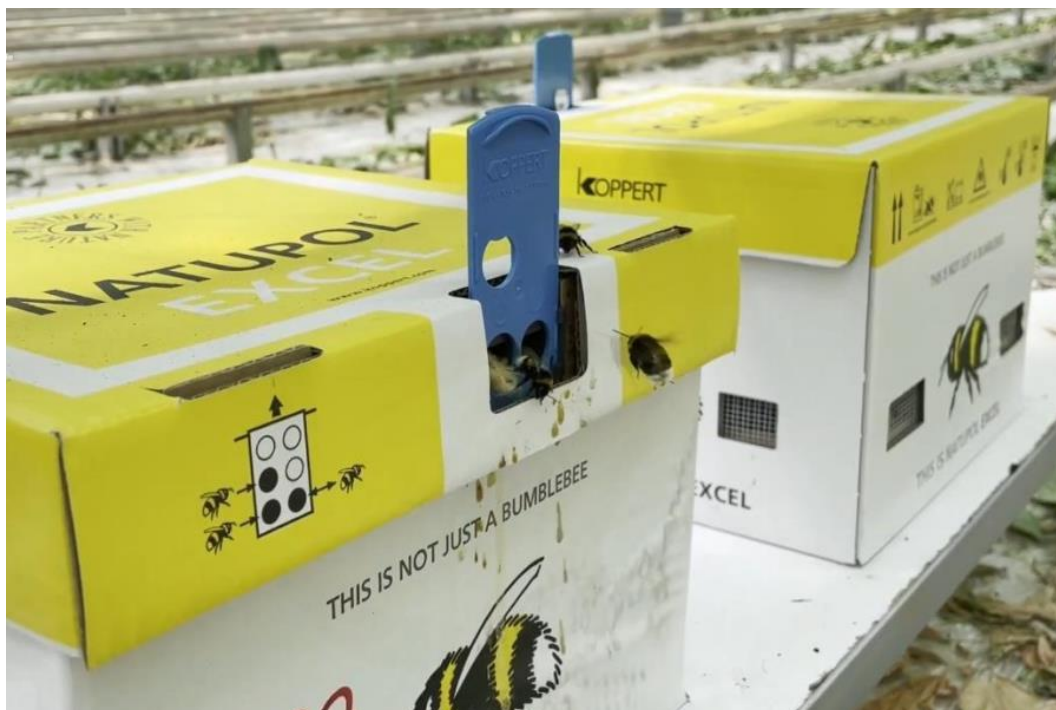
Slika 15. Bumbari za oprašivanje

štetnike. Nakon što se štetnici zalijepe možemo utvrditi prisutnost pojedine vrste te reagirati na vrijeme.