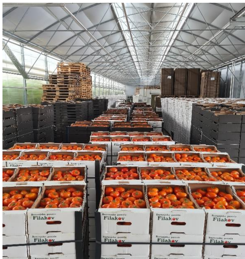
Slika 14. Ubrana rajčica