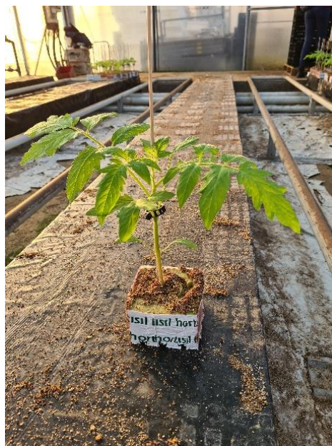
Slika 3. Presadnica rajčice

Dobro razvijene presadnice (Slika 3.) rajčice su pred presađivanje visoke petnaestak centimetara i imaju 5-6 potpuno razvijenih pravih listova. Za uzgoj rajčice u zaštićenim prostorima gdje se sade razvijenije presadnice nego kod uzgoja na otvorenom presadnice se mogu presaditi u pojedinačne lončice. Osim u tlu, rajčica se uspješno može uzgajati hidroponskim načinom na blokovima kamene vune, kokosovih vlakana ili drvenoj piljevini. Navedeni supstrati ne sadrže nikakva hranjiva već isključivo služe samo kao medij za ukorjenjivanje preko kojeg biljka dobiva vodu i potrebna hranjiva iz hranjive otopine. Presadnice za hidroponski način proizvode se u grijanim zaštićenim prostorima sjetvom u čepove kamene vune s kojima se u fazi kotiledonskih listova biljke presađuju u veće blokove najčešće kvadratnog oblika širine 10 cm i visine 7,5 cm. Čepovi i blokovi se vlaže hranjivom otopinom prilagođenog sastava razvojnom stadiju biljke, a temperaturni režim je isti kao kod kontejnerskog uzgoja presadnica i grijanih zaštićenih prostora. Hranjiva otopina za hidropon sadrži u optimalnom odnosu sve hranjive biogene elemente, određene pH vrijednosti i koncentracije koja se određuje stupnjem električne provodljivosti. Ostali režimi tijekom uzgoja kao što su temperature, relativna vlaga zraka ili sadržaj ugljičnog dioksida te sama tehnika uzgoja identični su onima koji se primjenjuju u klasičnom načinu uzgoja u zaštićenim prostorima (Parađiković, 2009.).