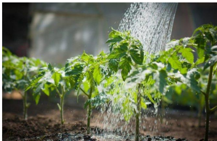
Slika 5. Navodnjavanje rajčice