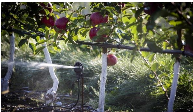
Slika 4. Navodnjavanje jabuka

Od voćarskih kultura kod jabuke su simulirane dvije tehnologije uzgoja, sa travnatim malčom između redova i bez njega. Za te kulture utvrđene su također norme navodnjavanja tijekom vegetacijskog razdoblja u vlažnim i sušnim klimatskim uvjetima.