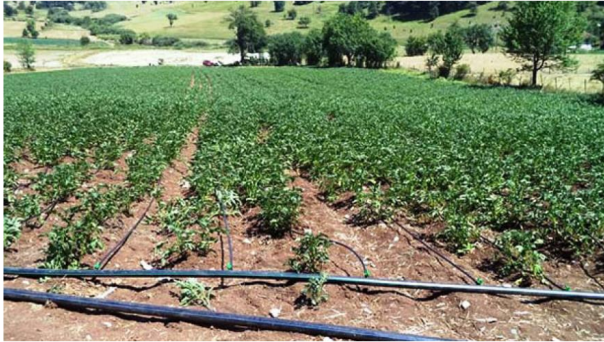
Slika 6. "Kap po kap" u krumpiru na planinskom području