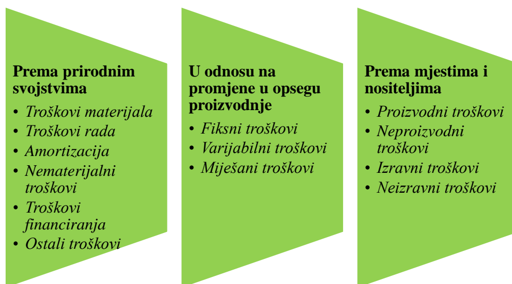
Slika 2. Podjela troškova prema različitim kriterijima

Ulaganja „obuhvaća sve oblike izdataka i troškova; dijeli se na tekuće (kratkoročno) i investicijsko (dugoročno). Investicija je ulaganje novčanih sredstava u nabavku i izgradnju realnih dobara radi stvaranja uvjeta za trajno poslovanje; to je trajno ulaganje novčanih sredstava u sredstva za proizvodnju, to jest u trajna obrtna i stalna sredstva; svrha im je održavanje kontinuiteta poslovanja i razvoj gospodarskih subjekata. Troškovi poslovanja se odnose na tekuća ulaganja učinjena radi proizvodnje u određenoj godini. Mogu se prikazivati za poljoprivredno gospodarstvo kao cjelinu, za određenu granu proizvodnje (na primjer, ratarstvo ili stočarstvo) ili za jednu liniju poljoprivredne proizvodnje“ (Ranogajec, 2009.).