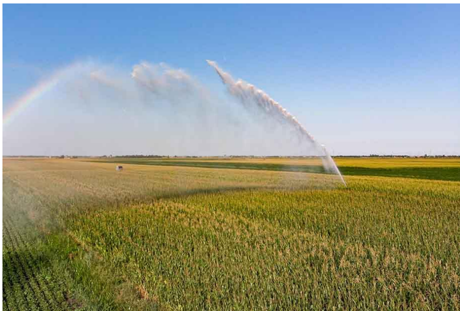
Slika 3. Navodnjavanje kukuruza

na primjeru aktualnih tržišnih prilika na jugoistoku SAD-a, zaključuju da je navodnjavanje kukuruza ekonomski prihvatljivo isključivo kod proizvodnih površina iznad 51 ha. U istom radu autori zaključuju da, neovisno o proizvodnoj površini, ekonomski je neprihvatljivo navodnjavanje soje i pamuka. Mullen i sur. (2009.) navode da je najvažniji čimbenik odluke o navodnjavanju ratarskih kultura njihova cijena, čije oscilacije određuju i isplativost navodnjavanja. Zaključuju da je za odluku poljoprivrednika o uvođenju navodnjavanja u svoju poslovnu praksu, cijena poljoprivrednih kultura važnija od cijene vode za navodnjavanje (Hadelan i sur., 2021.).