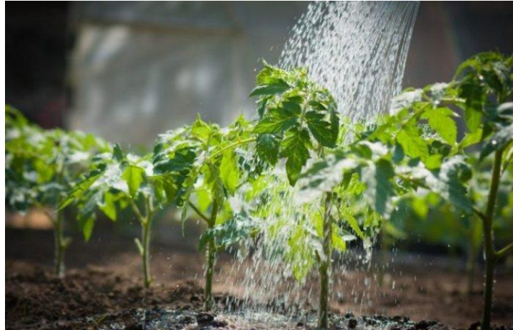
Slika 5. Navodnjavanje rajčice