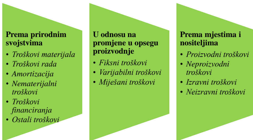
Slika 2. Podjela troškova prema različitim kriterijima

Ulaganja „obuhvaća sve oblike izdataka i troškova; dijeli se na tekuće (kratkoročno) i investicijsko (dugoročno). Investicija je ulaganje novčanih sredstava u nabavku i izgradnju realnih dobara radi stvaranja uvjeta za trajno poslovanje; to je trajno ulaganje novčanih sredstava u sredstva za proizvodnju, to jest u trajna obrtna i stalna sredstva; svrha im je održavanje kontinuiteta poslovanja i razvoj gospodarskih subjekata. Troškovi poslovanja se odnose na tekuća ulaganja učinjena radi proizvodnje u određenoj godini. Mogu se prikazivati za poljoprivredno gospodarstvo kao cjelinu, za određenu granu proizvodnje (na primjer, ratarstvo ili stočarstvo) ili za jednu liniju poljoprivredne proizvodnje“ (Ranogajec, 2009.).