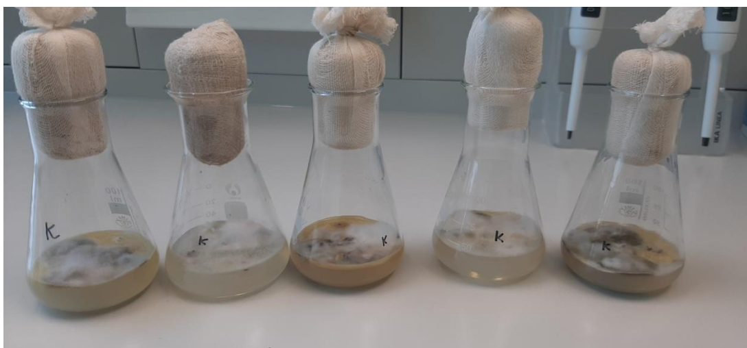
Slika 10. Rezultati kontaminacije kod metode ispiranja sjemenki u vodi, 0 % nekontaminiranih sjemenki

ostalnih metoda sterilizacije je bilo pojedinih podloga koje su kontaminirane samo s jednom skupinom mikroorganizama i nalazio se određeni postotak nekontaminiranih sjemenki (slika 11., slika 12., slika 13., slika 14., slika 15., slika 16., slika 17., slika 18.).