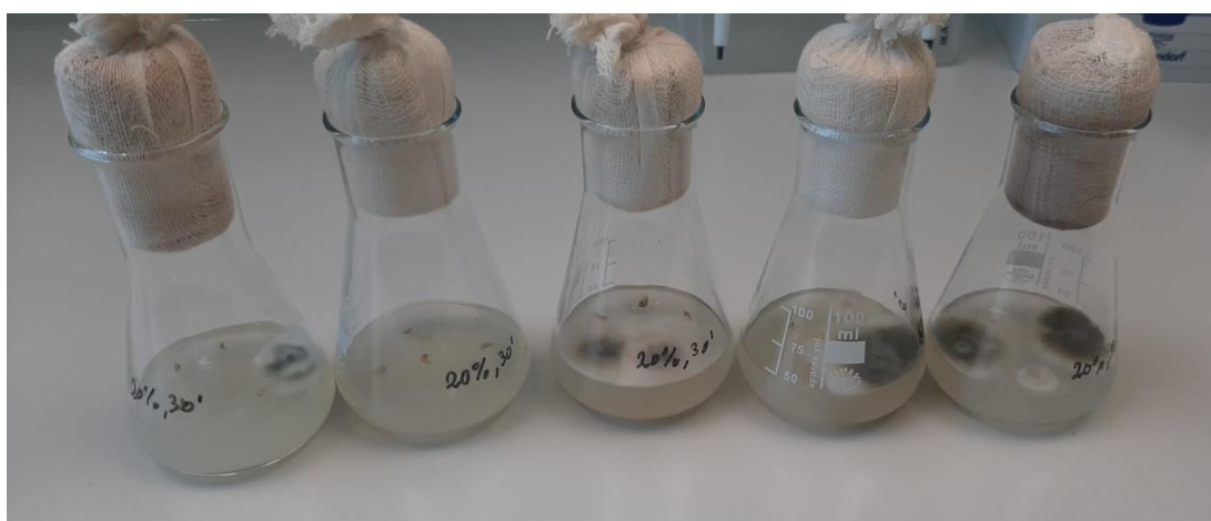
Slika 11. Rezultati kontaminacije kod metode sterilizacije sjemenki 30 minuta u otopini koncentracije od 20 % varikine, 56 % nekontaminiranih sjemenki