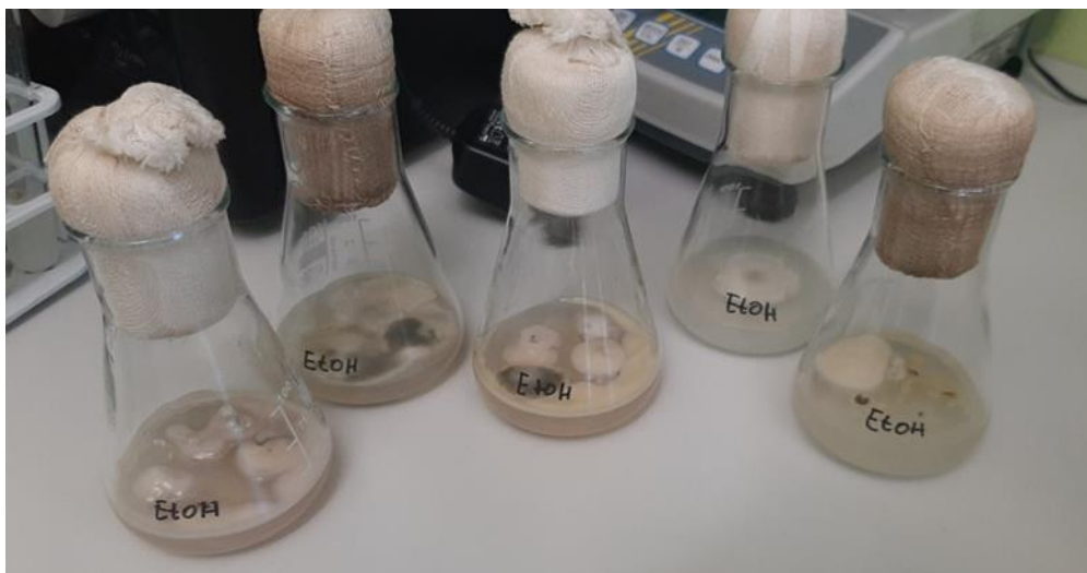
Slika 17. Rezultati kontaminacije kod metode sterilizacije sjemenki u 70 % etilnom alkoholu, 12 % nekontaminiranih sjemenki