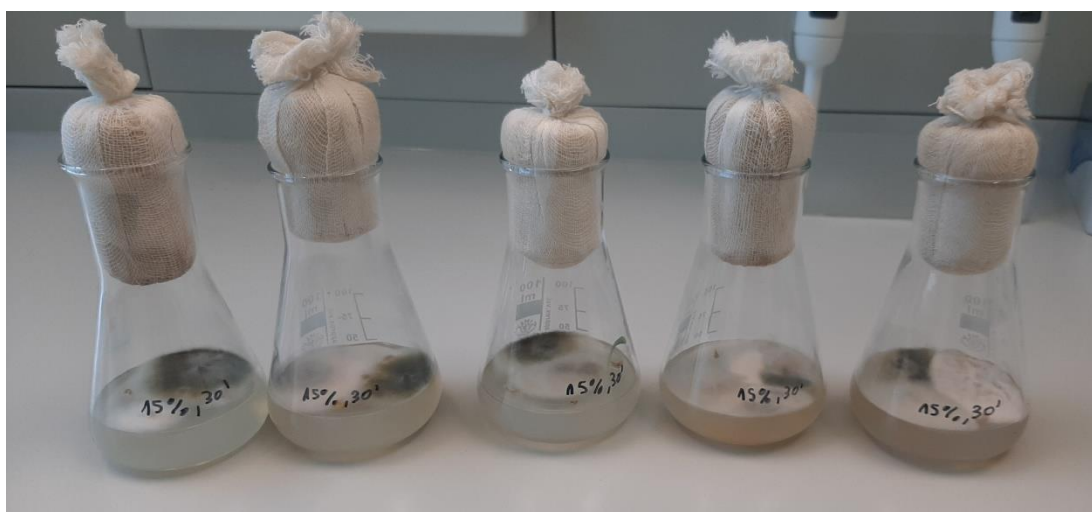
Slika 16. Rezultati kontaminacije kod metode sterilizacije sjemenki 30 minuta u otopini koncentracije od 15 % varikine, 12 % nekontaminiranih sjemenki