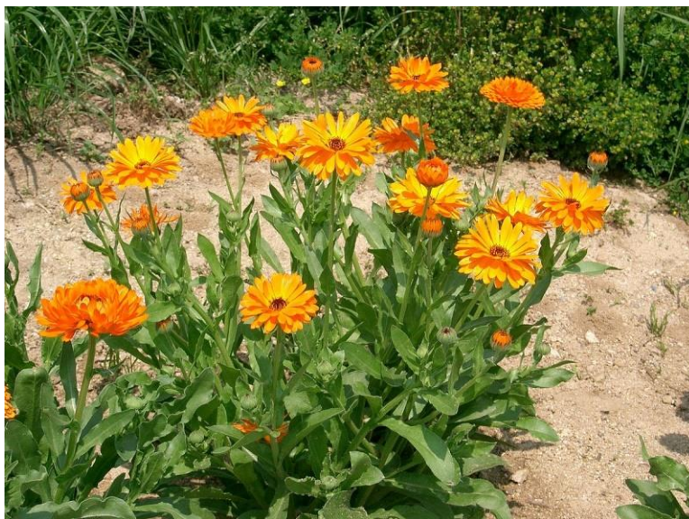
Slika 1. Calendula officinalis L.

Sjemenka je klijava pet do šest godina, a posijano sjeme niče za četiri do pet dana. Biljka raste brzo, već 40 dana nakon nicanja procvatu prvi cvjetovi, a cvjeta sve do jačih jesenskih mrazova. Tijekom visokih temperatura u srpnju naglo procvjeta i daje sjeme, ali s prvim kišama biljka se obnavlja. Redovitom berbom biljke nevena se pomlađuju i produžuje se vijek vegetacije (Šilješ i sur., 1992.).