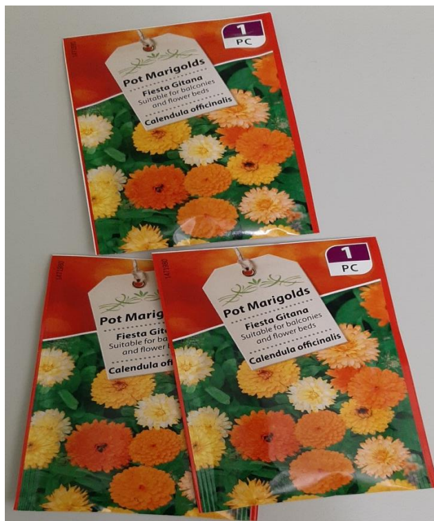
Slika 5. Sjeme nevena, Gartenland GmbH Aschersleben

Laboratorijski pokus započet je u svibnju 2022. godine u laboratoriju za povrćarstvo, cvjećarstvo, ljekovito, začinsko i aromatično bilje na Fakultetu agrobiotehničkih znanosti u Osijeku. Za istraživanje je korišteno sjeme Calendula officinalis L. Kupljeno u trgovačkom centru. Proizvođač sjemena je Gartenland GmbH Aschersleben (Njemačka) (slika 5.).