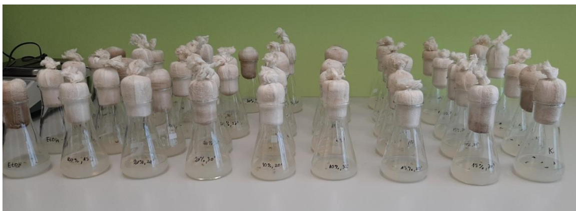
Slika 9. Pripremljena podloga u Erlenmeyer tikvicama

Tri tretmana su se sastojala od sjemenki koje su bile u otopini koja je sadržavala 20 % varikine, u jednoj od ta tri tretmana sjemenke se se držale 15 minuta u otopini varikine, u drugom tretmanu 20 minuta te u trećem 30 minuta. Iduća dva tretmana su se sastojala od sjemenki koje su bile u otopini koja je sadržavala 15 % varikine, u jednoj od tih tretmana sjemenke su se držale po 20 minuta u otopini varikine, a u drugom tretmanu 30 minuta. Slijedeća dva tretmana su se sastojala od sjemenki koje su bile u otopini koja je sadržavala 10 % varikine, u jednom od tih tretmana sjemenke su se držale 20 minuta u otopini varikine, a u drugom tretmanu 30 minuta. U jednom od ostala dva tretmana, otopina u kojoj su bile sjemenke je sadržavala 70 % etilnog alkohola, a u drugom tretmanu sjemenke su bile isprane samo u vodi radi kontrole.