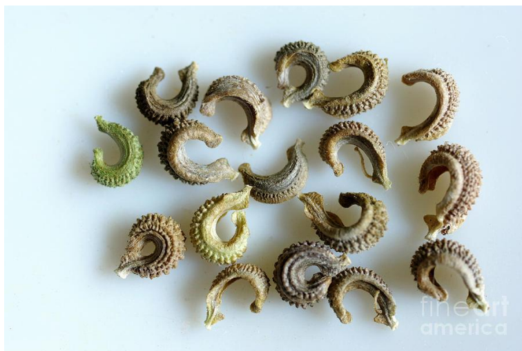
Slika 2. sjeme nevena