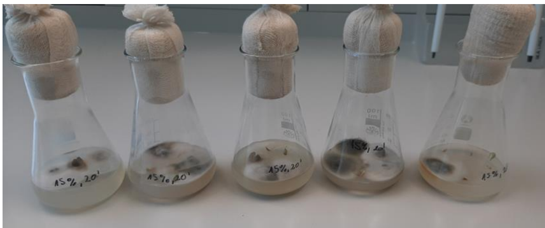
Slika 15. Rezultati kontaminacije kod metode sterilizacije sjemenki 20 minuta u otopini koncentracije od 15 % varikine, 24 % nekontaminiranih sjemenki