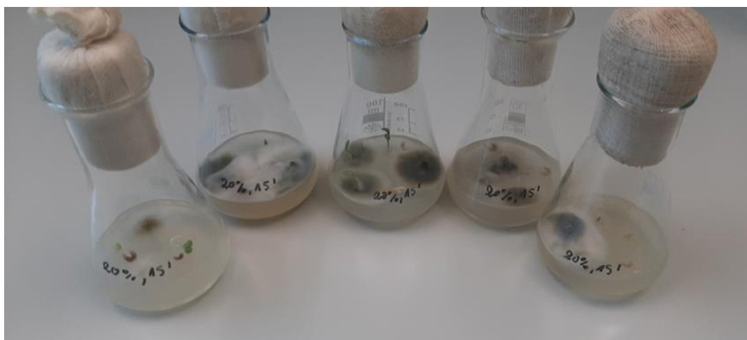
Slika 12. Rezultati kontaminacije kod metode sterilizacije sjemenki 15 minuta u otopini koncentracije od 20 % varikine, 36 % nekontaminiranih sjemenki