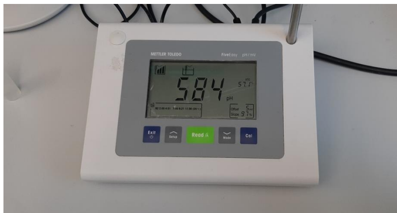
Slika 7. pH hranjive podloge nakon uštivanja

Nakon što su se potrebni pribor i podloge ohladile potrebno ih je izvaditi iz autoklava te pripremiti 225 sjemenki sterilizacijom u predviđenom postotku otopine varikine i držanjem određeno vrijeme u njoj. U svaku Erlenmeyer tikvicu stavljalo se po pet sjemenku. Erlenmeyer tikvice su se razvrstavale u 9 tretmana, za svaki tretman korišteno je po 5 tikvica (slika 9.). Tretmani su se razlikovali kod sterilizacije sjemenki i vremenu stajanja sjemenki u otopini za sterilizaciju (slika 8.).