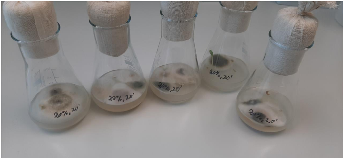
Slika 13. Rezultati kontaminacije kod metode sterilizacije sjemenki 20 minuta u otopini koncentracije od 20 % varikine, 28 % nekontaminiranih sjemenki