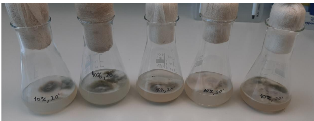
Slika 18. Rezultati kontaminacije kod metode sterilizacije sjemenki 20 minuta u otopini koncentracije od 10 % varikine, 4 % nekontaminiranih sjemenki

U ovom istraživanju primijenjena su različita sredstva za sterilizaciju u različitim koncentracijama i vremenima izlaganja kako bi se odredio optimalni protokol za sterilizaciju površine sjemenki i početak kulture tkiva Calendula officinalis L. Sjemenke su se nakon sterilizacije stavljale na hranjivu podlogu te skladištile u steriliziranim uvjetima na 7 dana.