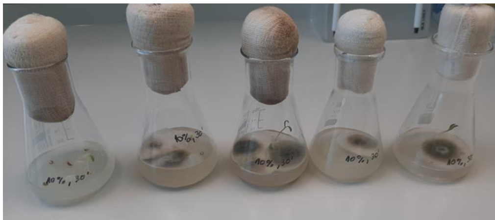
Slika 14. Rezultati kontaminacije kod metode sterilizacije sjemenki 30 minuta u otopini koncentracije od 10 % varikine, 28 % nekontaminiranih sjemenki