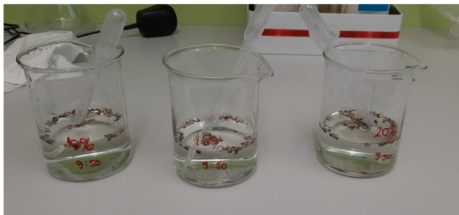
Slika 8. Sjemenke u različitom postotku varikine

Tri tretmana su se sastojala od sjemenki koje su bile u otopini koja je sadržavala 20 % varikine, u jednoj od ta tri tretmana sjemenke se se držale 15 minuta u otopini varikine, u drugom tretmanu 20 minuta te u trećem 30 minuta. Iduća dva tretmana su se sastojala od sjemenki koje su bile u otopini koja je sadržavala 15 % varikine, u jednoj od tih tretmana sjemenke su se držale po 20 minuta u otopini varikine, a u drugom tretmanu 30 minuta. Slijedeća dva tretmana su se sastojala od sjemenki koje su bile u otopini koja je sadržavala 10 % varikine, u jednom od tih tretmana sjemenke su se držale 20 minuta u otopini varikine, a u drugom tretmanu 30 minuta. U jednom od ostala dva tretmana, otopina u kojoj su bile sjemenke je sadržavala 70 % etilnog alkohola, a u drugom tretmanu sjemenke su bile isprane samo u vodi radi kontrole.