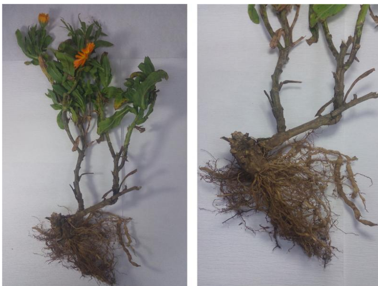
Slika 3. Sustav korijena kod nevena

Neven ima gust sustav vlaknastih korijena (slika 3.) te kada je na otvorenom pomaže mu zadržavati vodu u gornjem sloju tla (Hall, 2021.).