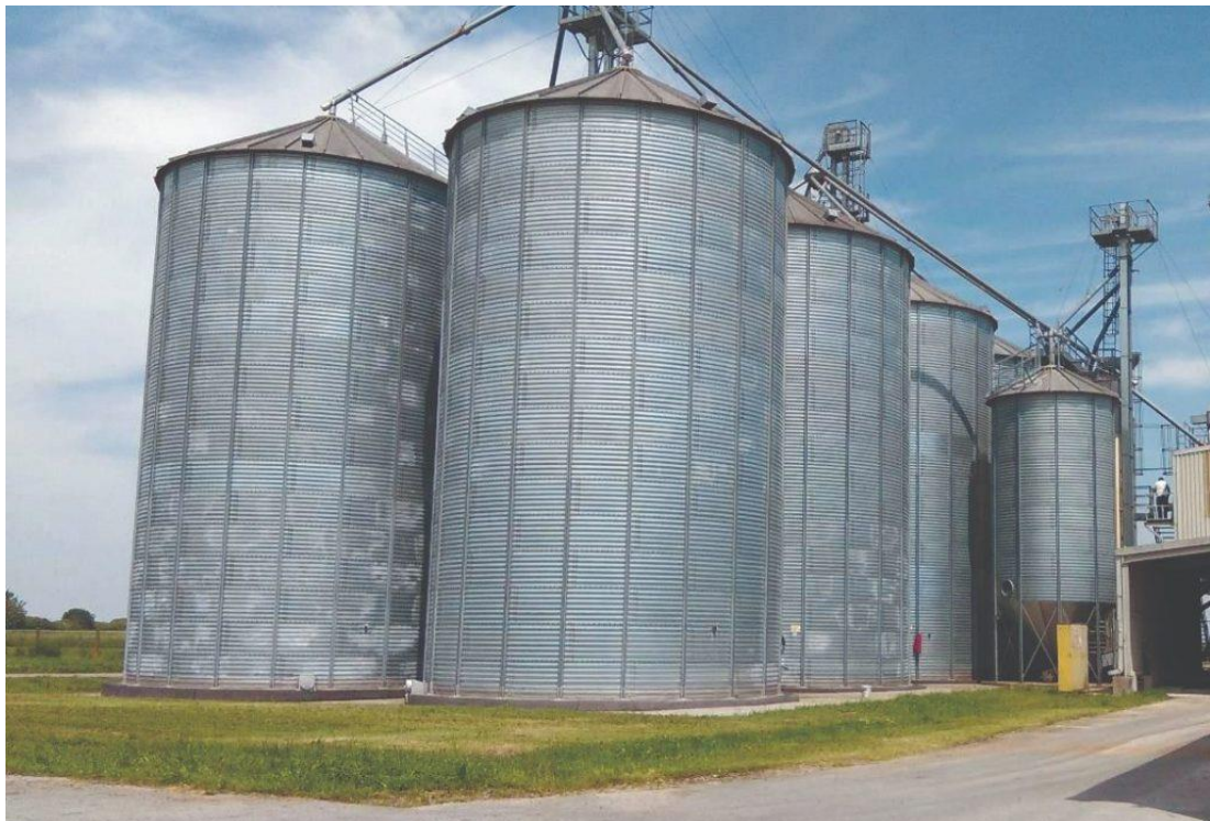
Slika 1. Kompleks silosa za skladištenje žitarica

unutrašnje manipulacije robom, utovar i istovar, automatsku kontrolu temperature i vlage i dr. Takvi silosi raspolažu s određenim brojem rezervnih ćelija koje su prazne kako bi se prebacivanjem kukuruza, i drugih žitarica, iz jedne u drugu ćeliju obavilo prozračivanje i hlađenje mase. Podna skladišta su klasični građevinski objekti izgrađeni od betona i opeke. Takva skladišta mogu biti građena sa pregradama kako bih odvojili više različitih ratarskih proizvoda ili iste ratarske proizvode različitih sorti i sl. Kako bih se održala konstantna vlaga zraka i temperatura skladišta koriste se klima uređaji. Ovaj način skladištenja može primiti veliku količinu zrna kukuruza na skladištenje te u pravilu sloj zrna može biti deblji sto je vlaga zrna manja, te on ne bi trebao prelaziti 1,5 m. Kod podnih skladišta gdje se nalazi uskladištena masa s većom vlagom zrna radi se provjetravanje i sušenje prevrtanjem uskladištene mase.