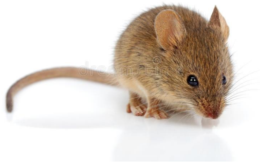
Slika 6. Domaći miš- Mus musculus (L.)

Domaći miš je manji glodavac koji nastanjuje polja i različita mjesta u blizini čovjeka, te se hrani istom hranom kao i čovjek. Domaći miš je glodavac težine oko 0,5 kg koji se hrani i do 20 puta dnevno te može pojesti 50-80 % svoje tjelesne mase. Ženka domaćeg miša se koti 4-6 puta godišnje te okoti 6-8 mladih. Prisustvo domaćeg miša vidljivo je po njihovom izmetu i mirisu sekreta. Za suzbijanje glodavaca potrebno je primijeniti preventivne, mehaničke i kemijske mjere. Preventivne mjere za suzbijanje glodavaca se uglavnom sastoje od očuvanja dobre čistoće i reda skladišta, dok se od mehaničkih mjera koriste zamke za hvatanje. Kao kemijske mjere koriste se gotovi mamci koji se postavljaju na različitim mjestima. Kako bih kemijske mjere bile učinkovite potrebno je koristiti hranu koju glodavci vole, a nemaju dostupnu u skladištu.