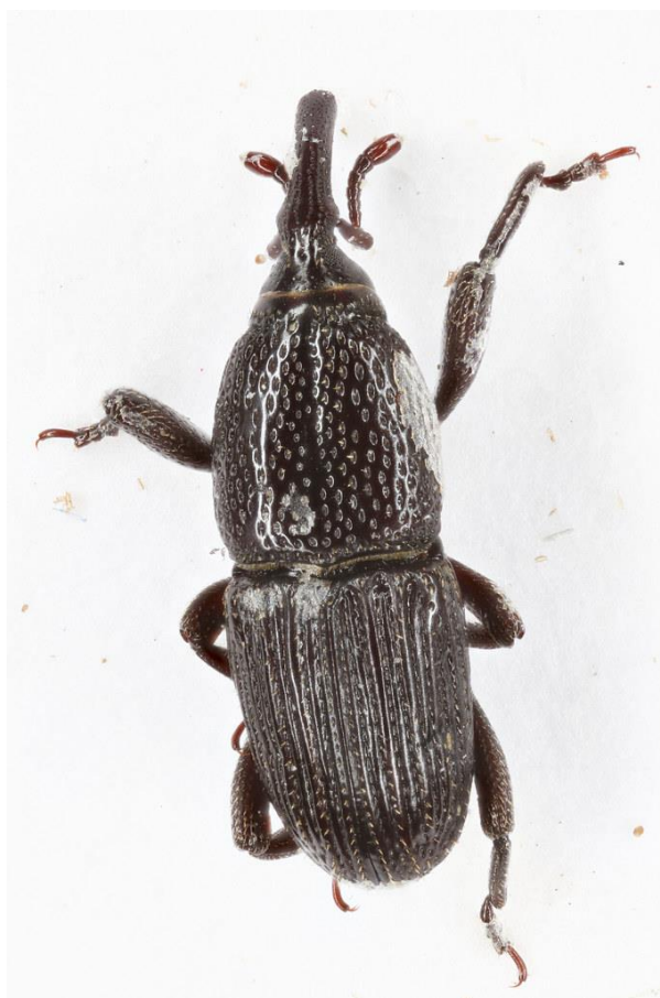
Slika 4 . Žitni žižak – Sitophilus granarius L. (imago)

Žitni žižak je najrašireniji skladišni štetnik čiji imago i ličinka napadaju pšenicu, ječam, raž, zob i kukuruz. Imago je kestenjaste, gotovo crne boje i duljine tijela 3-4 mm. Odrasli kukac žitnog žiška voli umjereno tople i tamne prostorije. Razvoj ovog kukca je intenzivan i pri relativno niskoj vlažnosti zraka od 14-16 %, gdje može razviti od 2-8 generacija godišnje ovisno o uvjetima u skladištu. Za razvoj jedne generacije potrebno mu je oko 60 dana. Ličinka žitnog žiška živi u zrnu uskladištenih poljoprivrednih proizvoda cijeli svoj razvojni ciklus, te podiže vlagu i temperaturu proizvoda kao posljedicu disanja zrna i ishrane ličinke ugljikohidratima. Pokazatelj napada ovog štetnika je topla, vlažna i pljesniva uskladištena masa. Svojim napadom ovaj štetnik znatno smanjuje kvalitetu proizvoda, te stvara uvijete za napad sekundarnih štetnika.