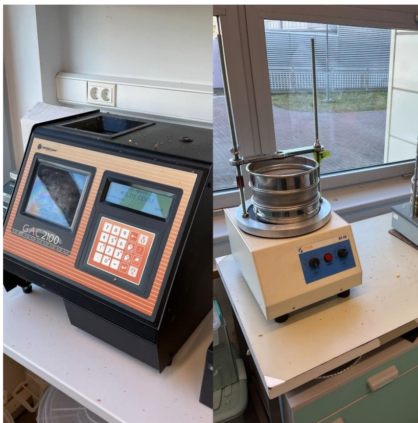
Slika 2. GAC 2100 i CISA uređaji korišteni u provedbi ovog istraživanja

U vremenskom razdoblju od tri mjeseca analizirano je stanje merkantilne robe kukuruza hibrida P9911. Uzorci su uzimani jednom mjesečno kroz siječanj, veljaču i ožujak 2022. godine. Kako bih se utvrdilo stanje za cijelu uskladištenu masu, uzorci su uzimani s vrha, sredine i zida silosa. Sa svakog navedenog mjesta u silosu uzeta su 4 poduzorka mase 250 grama, te je tijekom ovog istraživanja analizirano 36 uzoraka. Sve analize uzoraka odrađene su u Laboratoriju za posliježetvene tehnologije na Fakultetu agrobiotehničkih znanosti Osijek. Neposredno nakon uzimanja uzorka merkantilnog kukuruza iz silosa, koristeći uređaj Dickey John GAC 2100 (slika 2.), izmjerena je količina vlage u zrnju, temperatura uzorka i hektolitarska masa. Nakon toga urađena je analiza na potencijalne štetnike. Koristeći tresilicu CISA (slika 2.) i sita s promjerima otvora 0,2-0,5 mm, svi uzorci su prosijani kako bih se izdvojile primjese, te je obavljen pregled na prisutnost štetnika.