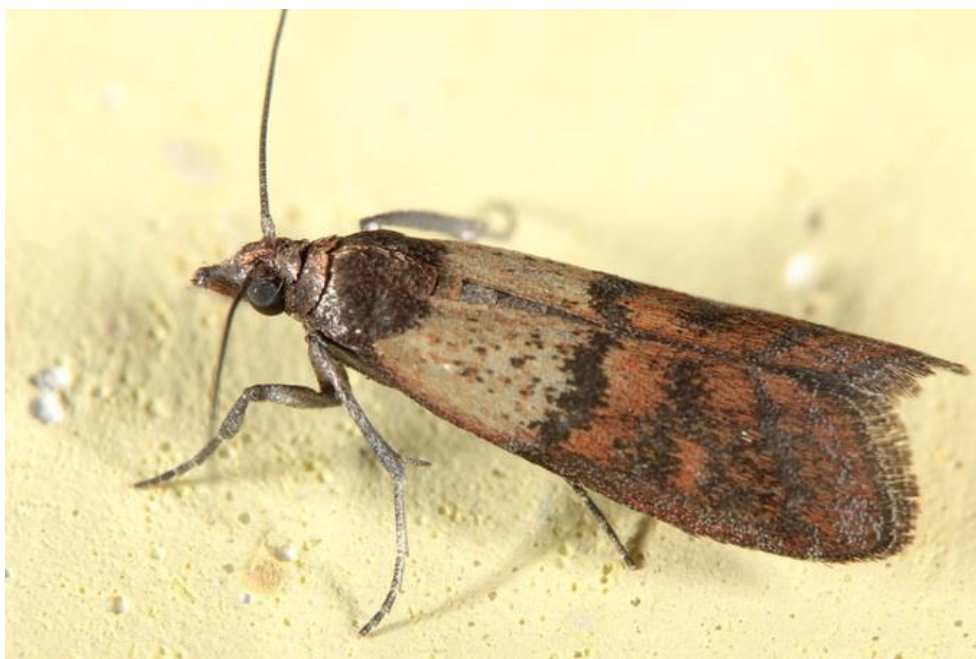
Slika 5 . Imago Bakrenastog moljca – Plodia interpunctella (Hübner)

Bakrenasti brašneni moljac je široko rasprostranjen polifagni skladišni štetnik koji napada kukuruz, pšenicu, raž brašno, suhe plodove, začine i čokoladu. Odrasli kukac ima tijelo i srednja krila bakrenaste ili crvenosmeđe boje, dok je bazalni dio krila je svijetlosive boje. Duljina tijela ovog štetnika je 7-9 mm, a raspon krila i do 16 mm. Razvojni ciklus ovog štetnika traje 2-7 mjeseci te je potrebna temperatura za razvoj u rasponu do 20-24 °C, a godišnje može razviti 2-3 generacije. Ženka bakrenastog brašnenog moljca odlaže jaja na uskladištene poljoprivredne proizvode. Osim štete grizenjem koju nanosi gusjenica, bakrenasti brašneni moljac štetu pravi i zagađivanjem proizvoda izmetom i paučinastom masom koju luče gusjenica.