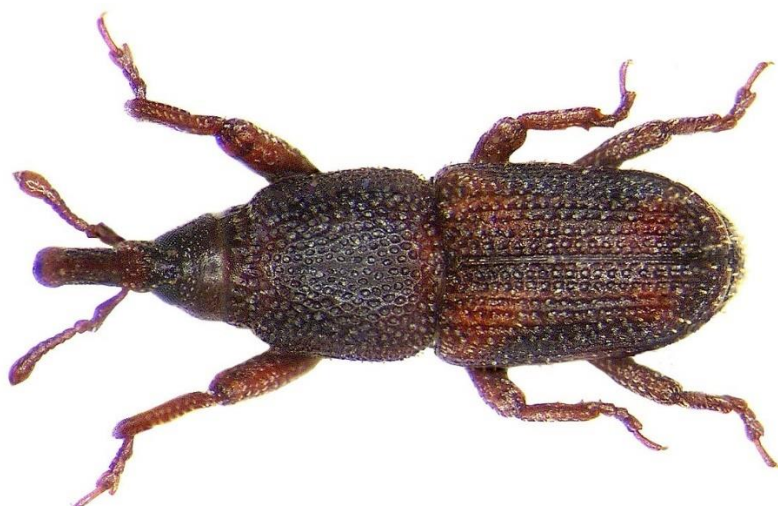
Slika 3. Imago Sitophilus oryzae L. – rižin žižak

Rižin žižak je porijeklom iz tropskih krajeva gdje napada žitarice u poljima, dok u krajevima s umjerenom toplom klimom napada poljoprivredne proizvode u skladištima. Izgledom i karakteristikama ovaj kukac nalikuje žitnom žižku Sitophilus granarius (L.). Od žitnog žiška se razlikuje po svojoj sposobnosti letenja te po kraćem i točkastom vratnom štitu, te dvije svijetlo smeđe mrlje na pokrildju. Imago rižinog žiška veličine je 2,5-3,5 mm, crveno smeđe do crne boje. Razvojni ciklus ovog štetnika traje oko 60 dana te se godišnje javlja tri generacije u hladnijim prostorima, a u zagrijanim prostorima može se očekivati i do pet generacija godišnje. Rižin žižak osim kukuruza napada i rižu, ječam, raž, grašak, grah i suho voće. Ličinke rižinog žiška žive i hrane se u zrnu. Nakon stadija kukuljice, kukac napušta zrno kroz otvor na zrnu koji je ujedino i znak napada ovog štetnika na zrno uskladištenog proizvoda.