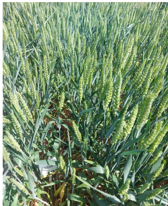
Slika 11. Kultivar Gemini