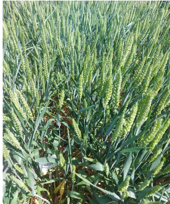
Slika 11. Kultivar Gemini