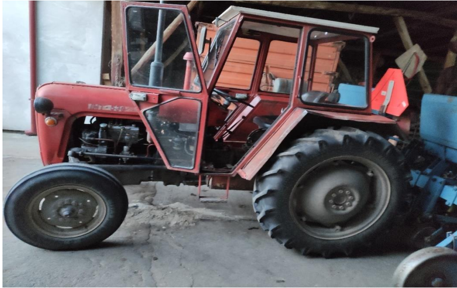
Slika 3. Traktor IMT-539

Prema priručniku za rukovanje i održavanje traktor traktor IMT-539 (1988.) koji je prikazan na slici 3. je traktor sa četverotaktnim IMR-M33/T motorom snage do 30 kW. Teži između 1,5 t do 2 t te ima 6 stupnjeva prijenosa.