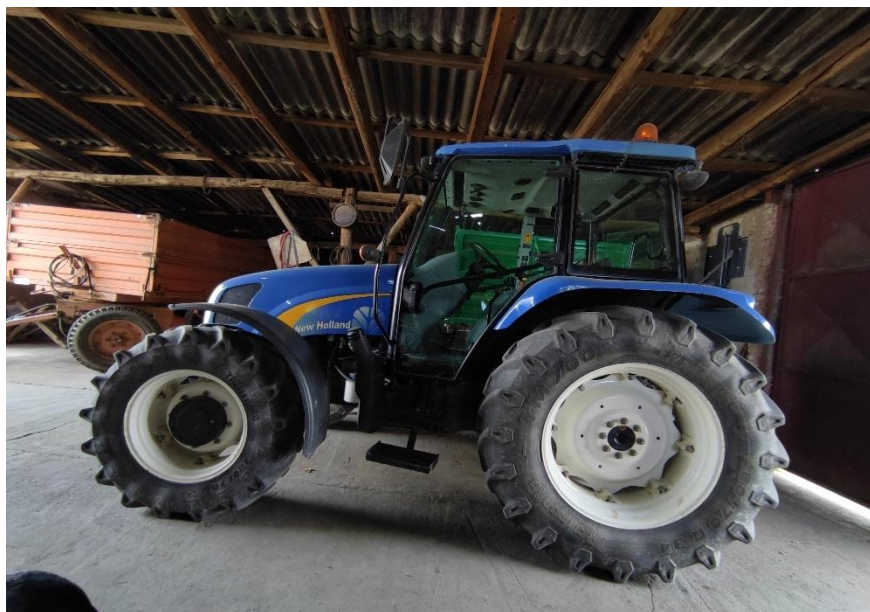
Slika 2. Traktor New Holland T5060

Prema priručniku za rukovanje i održavanje traktor New Holland T5060 (2010.) koji je prikazan na slici 2. je traktor sa linijskim motorom 4 cilindra , maksimalne snage 106 KS. Traktor teži 4,2 t te postiže brzinu od 40 km/h.