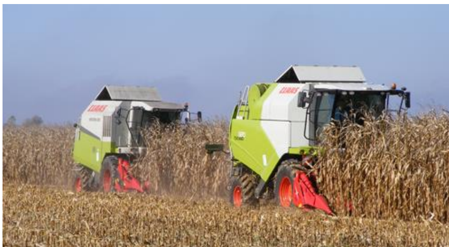
Slika 1. Berba kukuruza u zrnju ( https://www.savjetodavna.hr/ )

Za berbu kukuruza u zrnju koriste se žitni kombajni sa specijalnim hederom za otkidanje klipova kukuruza. Zrno je moguće uskladištiti na dulje vrijeme. Ovaj način berbe vrlo je efikasan, no i dosta skup. Kada zrno ima vlagu do 28 % tada je najpovoljnije za berbu kod većine hibrida. Zrno se treba sušiti toplim zrakom u sušarama da bi se sadržaj vode spustio na najviše 13 % pri kojem se može sigurno čuvati u skladištima i silosima (Izvor: Agroklub: Kukuruz. https://www.agroklub.com/sortna-lista/zitarice/kukuruz-115/ ).