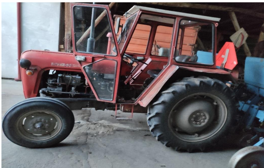
Slika 3. Traktor IMT-539

Prema priručniku za rukovanje i održavanje traktor traktor IMT-539 (1988.) koji je prikazan na slici 3. je traktor sa četverotaktnim IMR-M33/T motorom snage do 30 kW. Teži između 1,5 t do 2 t te ima 6 stupnjeva prijenosa.