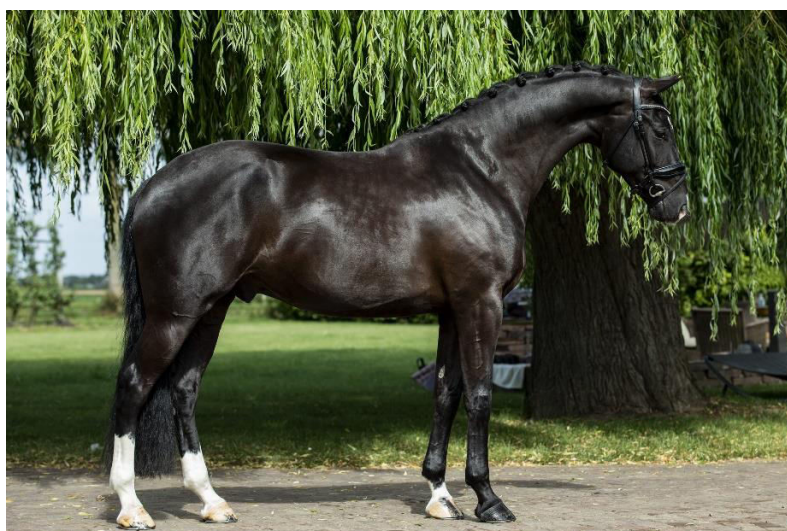
Slika 5. Kraća leđa