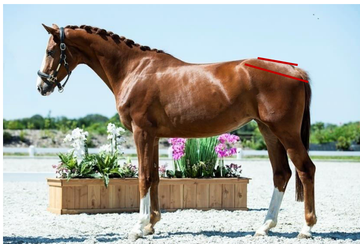
Slika 7. Nagib sapi i zdjelice kod dresurnog konja

zdjelicu s većim nagibom smatraju povoljnom za prikupljene radnje. Tako i Koenen i sur. (1995.) spušteniji stražnji dio povezuju s kvalitetnijim kretnjama konja.