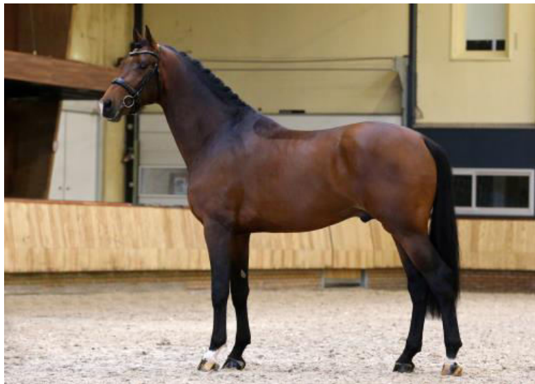
Slika 1. KWPN licencirani šestogodišnji dresurni pastuh Las Vegas

Popularizacija i zahtjevnost dresurnog sporta utjecali su na potrebu za stvaranje specifičnog sportskog tipa konja. Vrhunska sportska grla nastala su vrlo strogom selekcijom unutar pasmina ili križanjem različitih pasmina. Posljednjih nekoliko godina KWPN uzgojna organizacija dopušta križanje dresurnih kobila s pastusima španjolskih punokrvnjaka i luzitano ( Lusitano ) pasmine zbog prenošenja poželjnih osobitosti za izvođenje piaffa i passagea (Kwpm.org, 2021.). Rovere i sur. (2014.) su u svome istraživanju potvrdili da je specijalizacija unutar uzgojnog programa nizozemskog toplokrvnjaka efikasnija kada se uzgaja specifičan tip dresurnog ili preponskog konja. Isti autori tvrde kako je performans u dresurnom i preponskom sportu genetski drugačija osobitost koja je nepovezana ili slabo nepoželjno povezana. Dresurni tip KWPN pasmine opisan je kao uzbrdno i finije građen konj pravokutnoga oblika tijela duljih proporcija, s finijim spojem glave i vrata koji je visoko nasađen te s razvijenim mišićima u gornjem dijelu (Slika 1.).