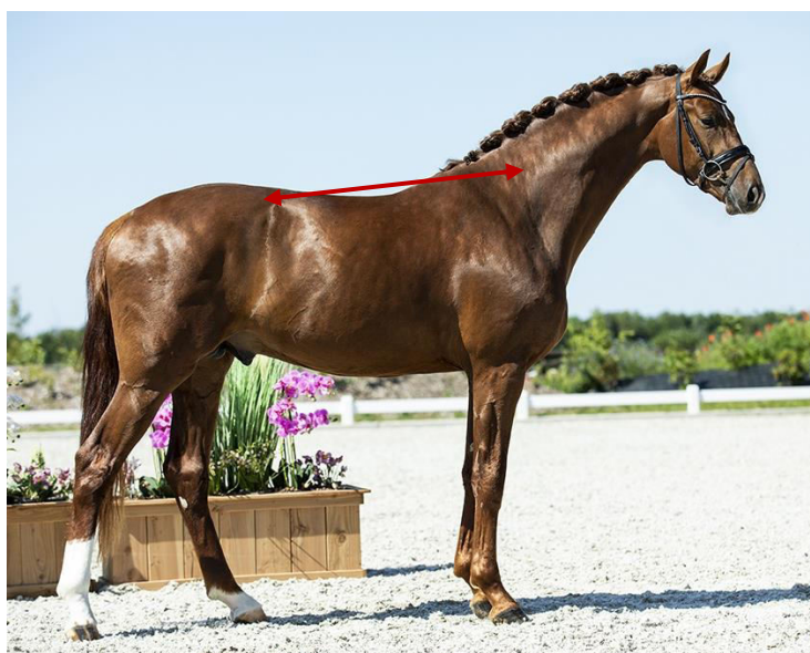
Slika 2. Uzbrdna građa

konjima koji i pri završetku svoga razvoja imaju sapi smještene više nego greben, oni će imati sklonost za nošenje težine na prednjem dijelu tijela. Metoda usporedbe visine grebena i sapi nije potpuno pouzdana pri određivanju uzbrdne ili nizbrdne građe te se stoga određuje pravac koji se proteže od šestog vratnog kralješka do slabinsko-križnog zgloba. Thomas (2005.) mjesto između petog i šestog vratnog kralješka opisuje kao vizualno najširi dio vrata, a kada taj pravac, gledajući s lijeva na desno, ima padajuću putanju, konj je uzbrdno građen (Slika 2.).