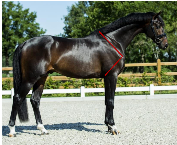
Slika 4. Prikaz lopatice s nagibom i duge nadlaktice

bolju podlogu za troglavi nadlaktični mišić koji utječe na domet prednjih nogu. Duljina nadlaktice konja promatra se od početne točke ramena do lakta i ona ne bi trebala biti duža od ramena konja s pravilnim spojem na lopatičnu kost. Prsa konja definira njihova širina, a upravo šira prsa su u pozitivnoj korelaciji s performansom jer uglavnom označavaju i bolji kapacitet pluća (Weeren i Crevier-Denoix, 2006.). S druge strane, prsa dresurnog konja ne bi trebala biti preuska jer uzrokuju preblisku postavljenost prednjih nogu, a time i neelastične kretnje.