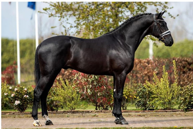
Slika 6. Duža leđa