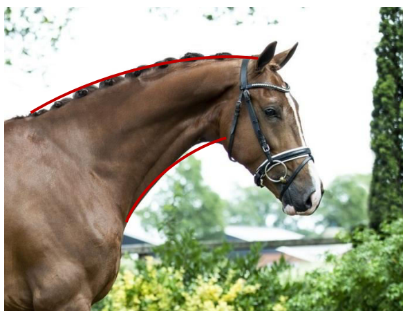
Slika 3. Odnos između gornjeg i donjeg luka vrata