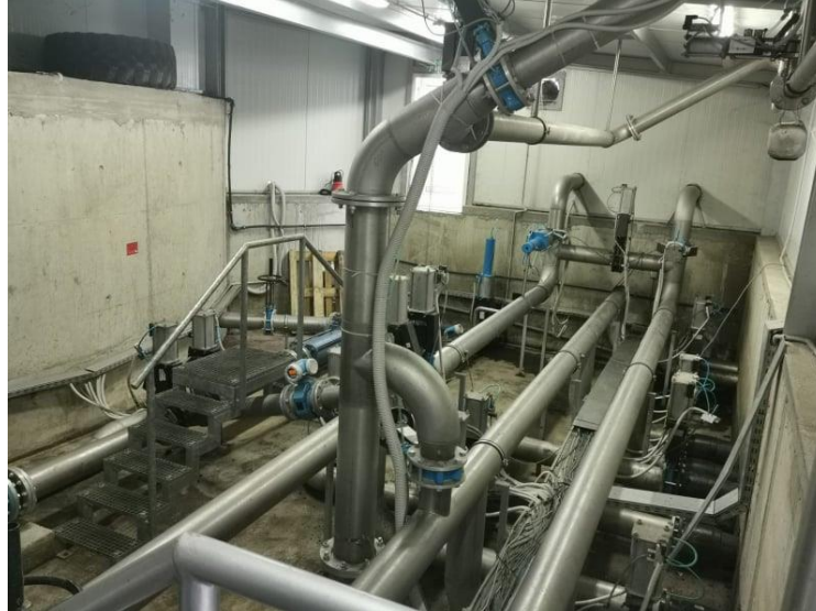
Slika 6. Dozirna stanica