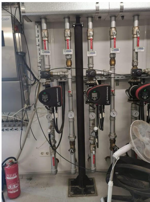
Slika 7. Pnemstski ventili