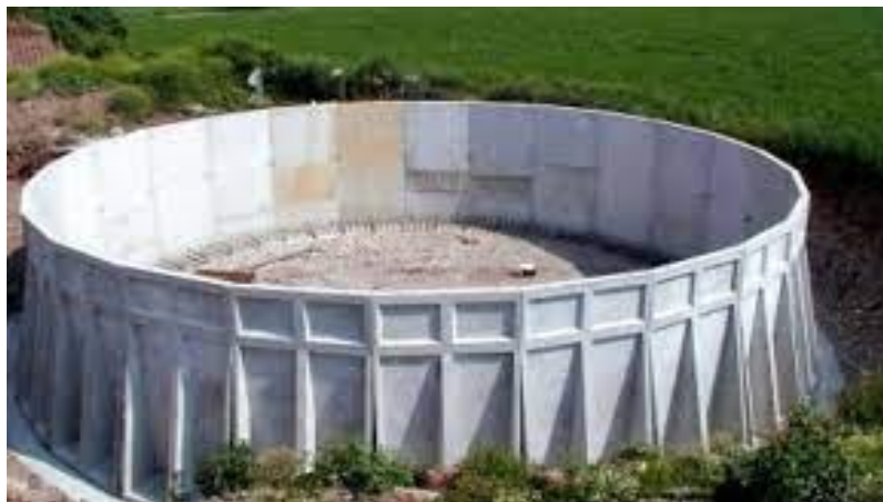
Slika 4. Laguna za tekuću gnojnicu

Gnojnica u tekućem obliku najčešće se skladišti u velikim betonskim spremnicima (lagunama) koji moraju biti nepropusni, te pokriveni zbog sprečavanja emisije plinova. Takvi spremnici obično imaju kapacitet za skladištenje gnojnice na jedan ili dva dana. Laguna može biti i ukopana u zemlju, ali prednost je kada se postavi na razinu višu od digestora pa nema potrebe za pumpanjem sirovine pri čemu se i štedi energija (Al Seadi i sur., 2009.). Na Slici 4 prikazana je nadzemna betonska laguna.