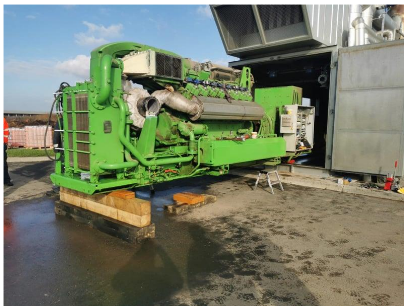
Slika 8. Bioplinski motor