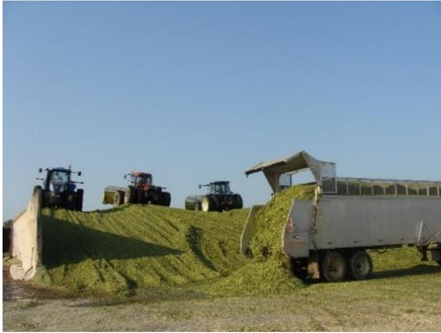
Slika 3. Bunker silos