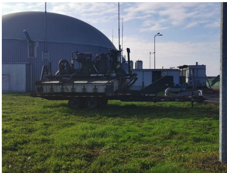
Slika 5. Brod za razbijanje kore u laguni

Slika 5 prikazuje „brod“ za razbijanje kore u laguni, a opremljen je pumpom i služi za ispumpavanje tekućeg dijela digestata.