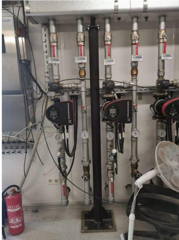
Slika 7. Pnemstski ventili