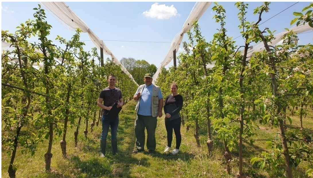
Slika 12. Nasad jabuka u Valpovu

dvokrilac. Medonosne pčele i pčela solitarka su pokazale ponašanje tako što su velikom većinom slijetale izravno na vrhove cvjetova dok su ostali oprašivači na cvjetovima imali neodređeni položaj.