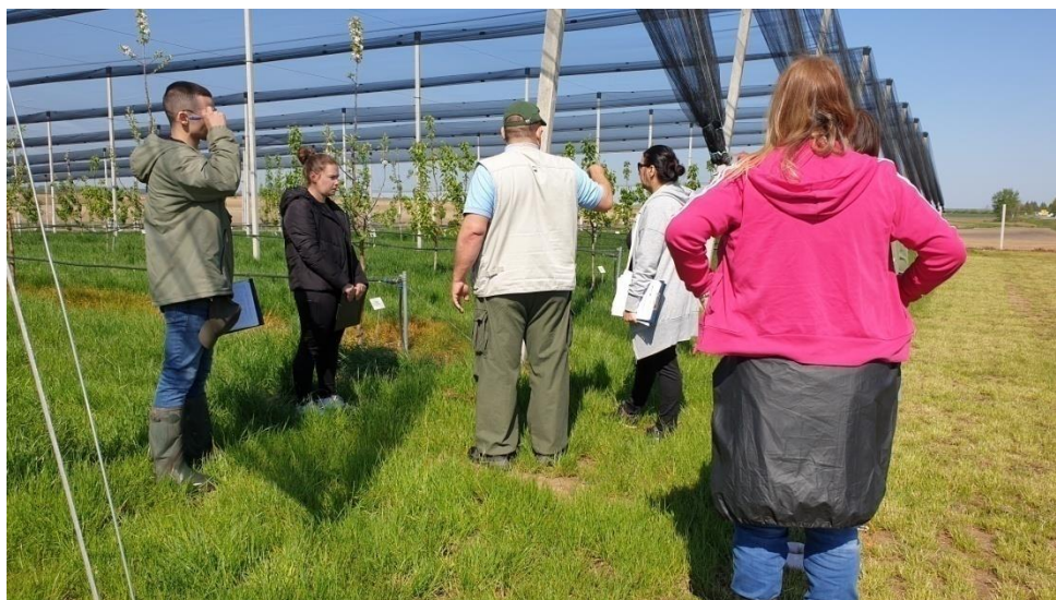
Slika 10. Zapisivanje osnovnih podataka