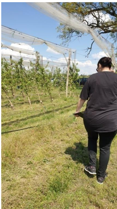
Slika 8. Zapisivanje aktivnosti oprašivača na transektima