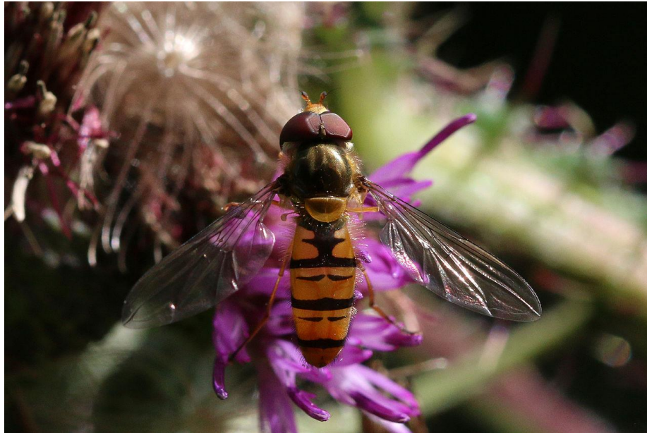
Slika 6. Osolika muha

Gledajući na potrebe medonosnih pčela, cvjetovi su vitalni za osolike muhe iz drugog razloga, a to je da oni osiguravaju nektar kao izvor hrane i pelud potreban za razvoj jajnika. Ova je razlika važna budući da osolike muhe nisu ograničene. Za razliku od pčele imaju domet i sposobnost prenošenja peludi na veće udaljenosti dok traže hranu, te su sposobne na znatno veće udaljenosti tijekom migracije. Neke osolike muhe također mogu biti prisutne u vrlo velikim gustoćama, što se posebno odnosi na migratorne vrste.