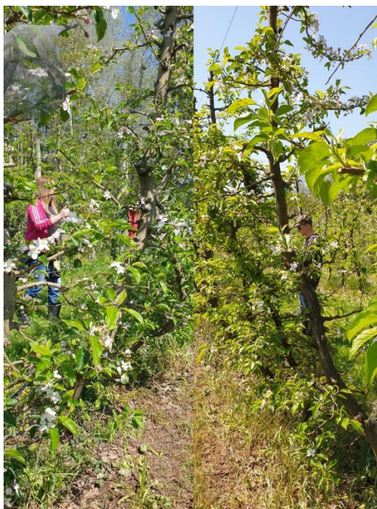
Slika 13. Nasad jabuka u Satnici

oprašivača je pokazalo da su manje slijetali na vrhove cvjetova te puno više su slijetali na neodređene položaje cvjetova.