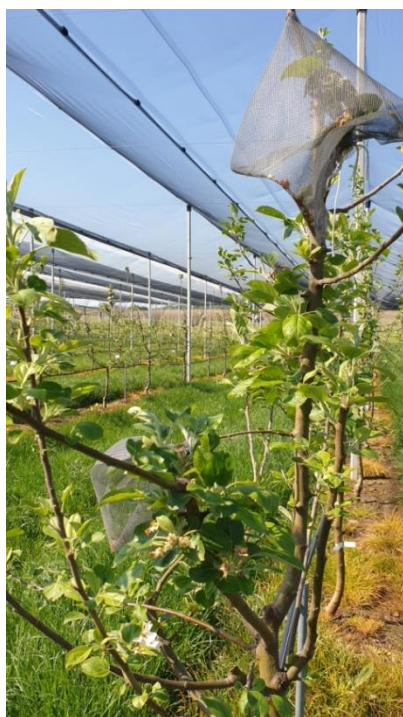
Slika 9. Mrežicom obavijene odabrane grane