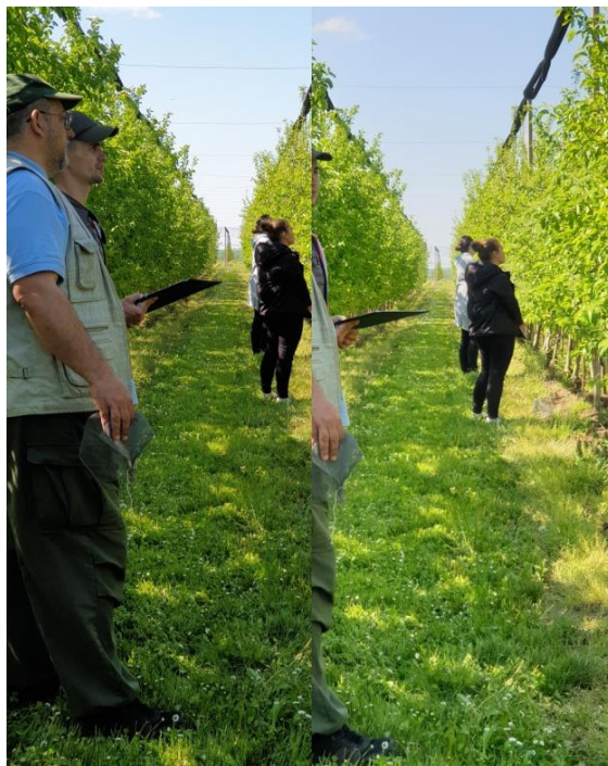
Slika 14. Nasad jabuka na poljoprivrednom institutu Osijek

četiri medonosne pčele, tri druga dvokrilca, pčela solitarka i osolika muha. Oprašivači su pokazali ponašanje oko cvjetova slijetajući na njih velikom većinom sa strane te nekolicina slijetanjem sa vrha i na neodređeni položaj.