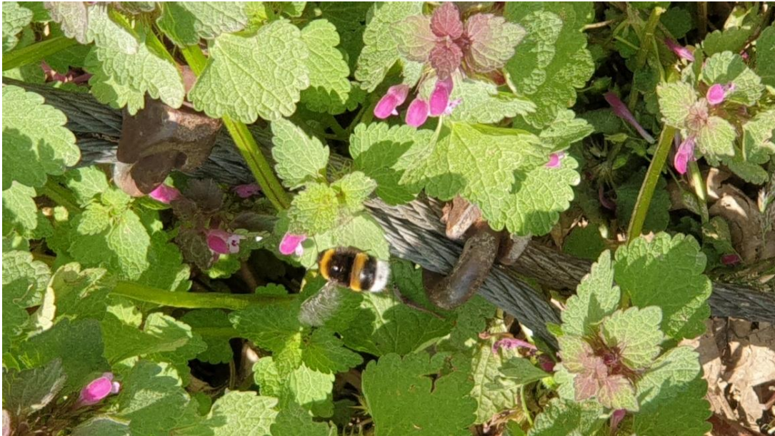
Slika 5. Bumbar