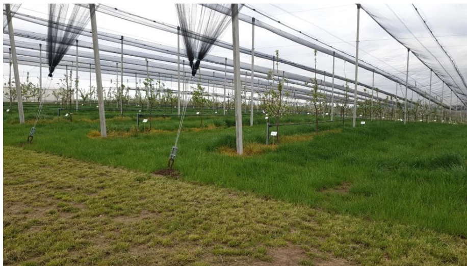
Slika 7. Nasad jabuka i transekti

Istraživanje je provedeno 29.04.2022. praćenjem aktivnosti oprašivača na nasadima tijekom cvatnje jabuke na četiri lokacije. Na ekološkom nasadu u Erdutu te na tri konvencionalna nasada u Osijeku (Poljoprivredni institut), Satnici i Valpovu. U svakom nasadu mjerenje je obavljeno na 5 označenih stabala jabuke, Golden sorte, te na vanjskom i unutarnjem transektu unutar i izvan nasada (slika 7.). U prvom pokusu odabrane su grane s cvjetovima u stadiju balona (BBCH-59). Prethodno su pripremljene grane za obavljanje ovog istraživanja, tako da su obavijene širom mrežicom (slika 9.), kako bi se osiguralo da oprašivači nisu došli do cvijetova prije početka praćenja. Izmjerena je temperatura i vlaga zraka korištenjem termometra koji ima i ugrađeni vlagomjer. Korištenjem anemometra izmjerena je i zabilježena brzina vjetra. Dodatni podatci koji su zapisani su lokacija ekološkog nasada, sorta jabuke, broj pupoljaka na grani te vrsta i količina oprašivača koji su posjetili odabranu granu (slika 10.). Pokus je započeo skidanjem mrežica s odabranih grana gdje se, u rasponu od 10 minuta, pratilo i zabilježavalo koja vrsta i kolika količina oprašivača prilazi cvjetovima na odabranoj grani. Pri završetku pokusa, mrežice su vraćene na grane. Tijekom drugog pokusa pratila se aktivnost oprašivača na unutarnjem i vanjskom transektu nasada jabuka (slika 8). Zapisivalo se broj i vrsta oprašivača te vrsta biljaka koje su posjetili, također u rasponu od 10 minuta.