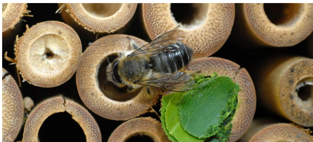
Slika 4. Solitarna pčela

Odrasle jedinke solitarnih pčela pojavljuju se u proljeće pojavom prvih cvjetova voćaka. U prirodi je izlijetanje odraslih jedinki postupno. Aktivne su tijekom cvatnje voćaka pri temperaturi od 8°C. Tijelo ovih pčela prekriveno je gustim dlakama, najviše s trbušne strane. Pomoću dlaka solitarna pčela sakuplja pelud po cijelom tijelu i prenosi ga s cvijeta na cvijet, a potom i u gnijezdo gdje sprema hranu za svoje potomstvo. Postoji više razloga zašto je potrebno očuvati solitarne pčele. Čovjek je narušio njihovu biološku ravnotežu i raznolikost, onečistio okoliš te utjecao na smanjenje broja solitarnih pčela u prirodi. Solitarna pčela u usporedbi sa medonosnom pčelom leti pri nižim dnevnim temperaturama. Jedna ženka solitarne pčele ima učinkovitost 120 letačica medonosne pčele. Za oprašivanje jednog hektara konvencionalnog nasada jabuke potrebno je 500 ženki solitarne pčele ili 3 košnice medonosne pčele s ukupno 60.000 radilica. Solitarne pčele nisu u kompeticiji sa medonosnom pčelom ili bumbarima. Njihov zajednički rad povećava broj zametnutih plodova u voćnjacima.