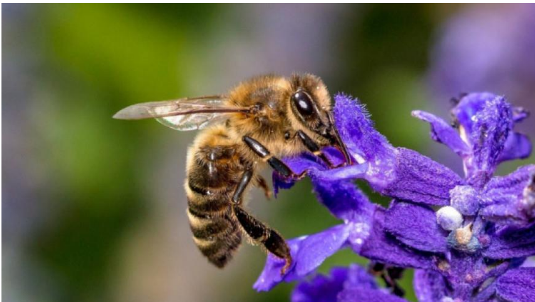
Slika 3. Medonosna pčela