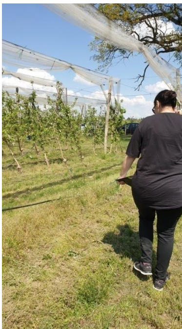
Slika 8. Zapisivanje aktivnosti oprašivača na transektima