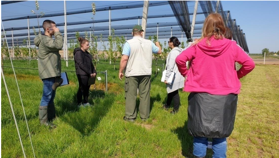
Slika 10. Zapisivanje osnovnih podataka