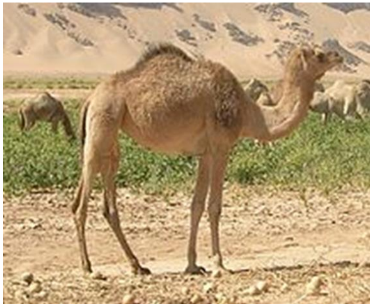
Slika 1. Tijelo jednogrbne deve

Dromedari su najviši od triju vrsta deva. Imaju jednu grbu kao baktrijske deve, ali dvije kao baktrijske deve. Dromedari imaju prepoznatljiva obilježja kao što su dugačak, zakrivljen vrat; uska prsa; guste, dvoslojne trepavice i čupave obrve. Odrasli mužjak dromedara može biti visok između 1,8 i 2,4 m. Ženke su visoke od 1,7 do 1,9 m (Slika 1). Tjelesna masa mužjaka iznosi 400-690 kg, a ženki 300-540 kg.