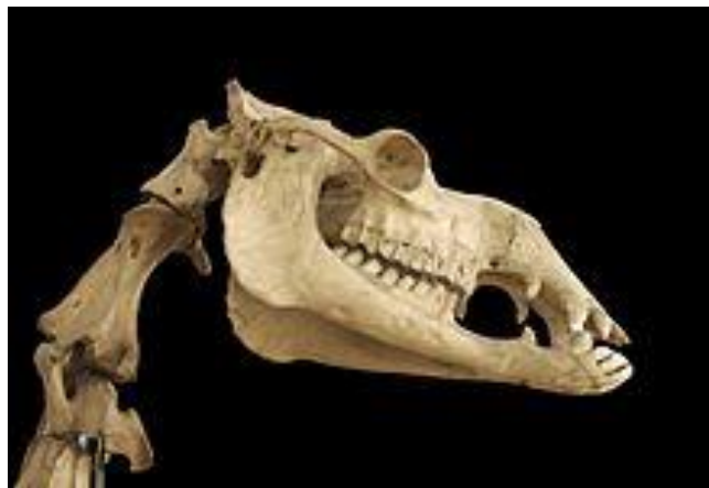
Slika 4. Kostii lica jednogrbne deve

Mladi dromedar ima donje kutnjake koji se razvijaju nakon 12-15 mjeseci. Imaju i stalne donje sjekutiće koji se pojavljuju u dobi od 4,5 do 6,5 godina. Svi ostali zubi kod su mliječni koje na kraju zamijene trajni zubi (Slika 4). To uključuje 22 mliječna zuba koje zamijene 34 trajna zuba. Otprilike 8 do 13% proteina prisutnih u oku su kristalini. Ovaj protein nalazi se u lećama i jedini je protein normalno prisutan u izvanstaničnim tekućinama (Abdelrahman, 2013.).