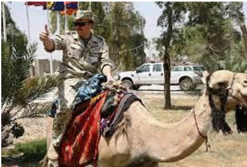
Slika 9. Deve u vojnoj upotrebi

Imperial Camel Corps osnovala je Velika Britanija 1916. Prvotno je bio namijenjen borbi protiv plemena Senussi, ali je kasnije korišten u bitkama Prvog svjetskog rata na Sinaju i u Palestini. Vojnici ICC-a bili su na devama i mogli su se kretati pustinjskim terenom; međutim, bili su sposobni i za borbu pješice. Nakon srpnja 1918., ICC se počeo gasiti jer nije dobio nova pojačanja i formalno je raspušten 1919. (Palmer, 1999.). Britanska vojska stvorila je Egipatski korpus za prijevoz deva od egipatskih vozača deva i njihovih deva (Slika 9). Ova je grupa podržavala britanske ratne operacije u Siriji, Palestini i Sinaju transportirajući zalihe. Godine 1912. kolonijalne vlasti britanskog Somalilanda stvorile su Somali Camel Corps, koji je prestao s radom 1944. (Palmer, 1999.).