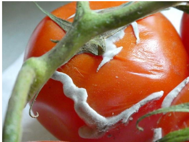
Slika 4. Šteta na plodu rajčice nakon infekcije Sclerotinia sclerotiorum

Sclerotinia sclerotiorum je uzročnik bijele truleži. Napada više od 400 domaćina kultiviranih i korovnih vrsta (Slika 4). Osnovni izvor zaraze predstavljaju sklerocije koje kasnije kliju u micelij ili apotecij sa askusima i askosporama. Klijanjem sklerocija u tlu nastaje micelij koji se prvo naseli na mrtvu organsku tvar, a zatim prodire u korijen i vrši zarazu. Ukoliko se radi o stabljичnom tipu bolesti zarazu obavljaju askospore, odnosno hife se iz prokljalih askospora šire na lisnu peteljku i stabljiku. Zaraza se može pojaviti i na neoštećenim dijelovima stabljike koju vrše askospore. Suzbija se na način da se treba poštivati plodored (4 – 6 godina), sjetva zdravog sadnog materijala, uništavanje korova i upotrebom kemijskim sredstava (Ivić, 2016; https://www.chromos-agro.hr/ ).