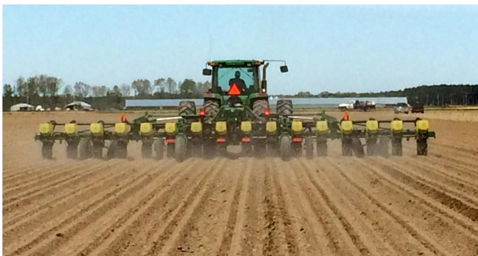
Slika 8. Sjetva kukuruza

Najbolje je sijati provjerene hibride, odnosno one koje preporučuju znanstvene institucije za to područje. Optimalan agrotehnički rok za sjetvu kukuruza u sjeverozapadnoj Hrvatskoj je od 15. do 30. travnja, dok je za istočnu Hrvatsku taj rok od 10. do 25. travnja. Sjetva se ne obavlja u tom roku ako je hladno i kišovito vrijeme. Sjetva se obavlja kada oranični sloj tla dođe do 10 °C (Slika 8.). Rana sjetva dovodi do ranijeg klijanja i nicanja, ranijeg metličanja, svilanja i oplodnje, kukuruz ranije dozrijeva, a sve to povećava količinu i kvalitetu prinosa. Međutim, rana sjetva ima i loše strane. Ako je povećana vlažnost tla i niže temperature može dovesti do lošijeg sklopa i nekad se zasijana površina mora preorati. Sjetva kukuruza se vrši sijačicama (mehaničkim i pneumatskim) na razmak između redova 70 cm, a razmak unutar redova iznosi od 16 do 26 cm. Sjetva se obavlja na dubinu 5-7 cm. Raniji hibridi se siju gušće, a kasniji rjeđe. Također kukuruz za silažu se sije gušće (Pospišil, 2010.).