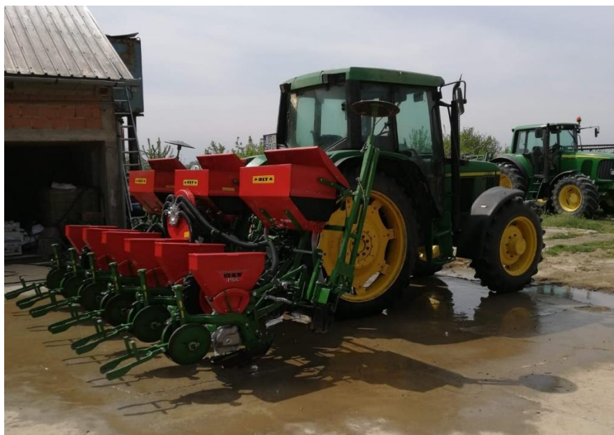
Slika 12. Pneumatska sijačica OLT PSK 6