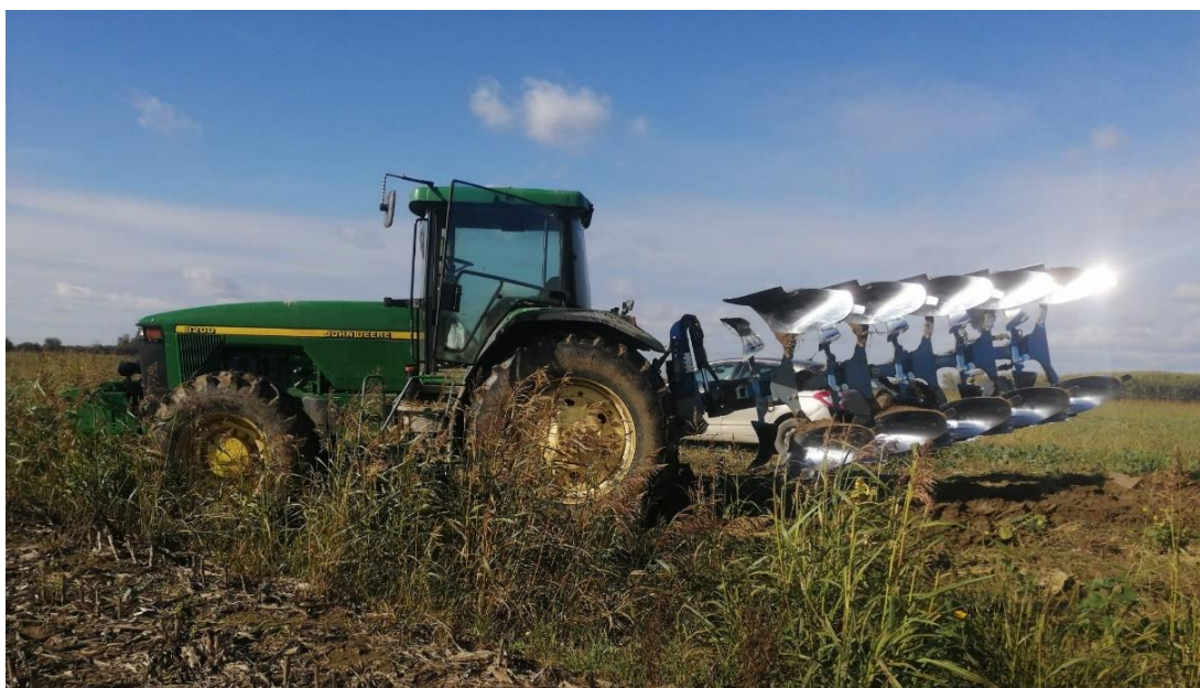
Slika 10. Traktor John Deere 8200 i peterobrazdni plug

Na obradivim površinama OPG-a „Pikec Goran“ u 2020. godini je zasijano 32 ha kukuruza. Predkultura kukuruza bio je suncokret. Žetva suncokreta trajala je od 1.9. do 5.9. 2019. godine. Pošto predkultura nisu uljana repica i strne žitarice, nije rađeno prašenje strišta te je glavna obrada tla bila duboko jesensko oranje i to na dubinu oko 25 cm. Duboko jesensko oranje odrađeno je početkom studenog, a korišten je traktor John Deere 8200 s peterobrazdnom plugom (Slika 10.). Polovicom veljače obavljeno je zatvaranje zimske brazde teškim drljačama, a u svrhu poravnanja tla i zadržavanja vlage u tlu skupljene tijekom zimskih mjeseci. Krajem travnja obavljena je predsjetvena priprema tla stjevospremačima na dubinu tla od 5-7 cm.