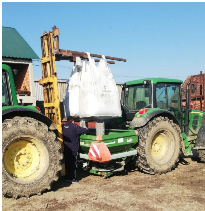
Slika 11. Rasipač gnojiva Amazona SBS 1001

Sjetva kukuruza na OPG-u „Pikec Goran“ započela je 24. travnja 2020. godine, što je unutar optimalnog roka koji traje od 10. do 25. travnja. Za sjetvu je korištena pneumatska sijačica OLT PSK 6 (Slika 12.) s razmakom između redova od 70 cm i na dubinu tla oko 4 cm. Na parcelama su sijani hibridi Pioneer P9911 i OS Kulak. Pioneer P9911 je hibrid FAO grupe 450, prilagođen je za proizvodnju zrna u cijeloj Hrvatskoj i zbog kvalitete zrna i postojanosti prinosa postao je najprodavaniji hibrid u Hrvatskoj. Hibrid OS Kulak je FAO grupe 400 i jedan je od najnovijih hibrida Poljoprivrednog instituta Osijek. Odlikuje se povećanjem tolerancije na nepovoljne klimatske uvjete i crvenkastom osnovicom zrna.