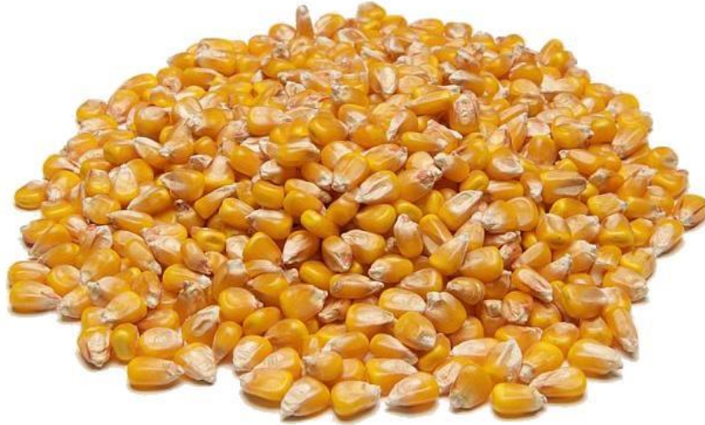
Slika 6. Zrno kukuruza

klica i to na donjem prednjem dijelu zrna. Pretežno se sastoji od ulja. Masa 1000 zrna može biti od 50 do 500 grama.