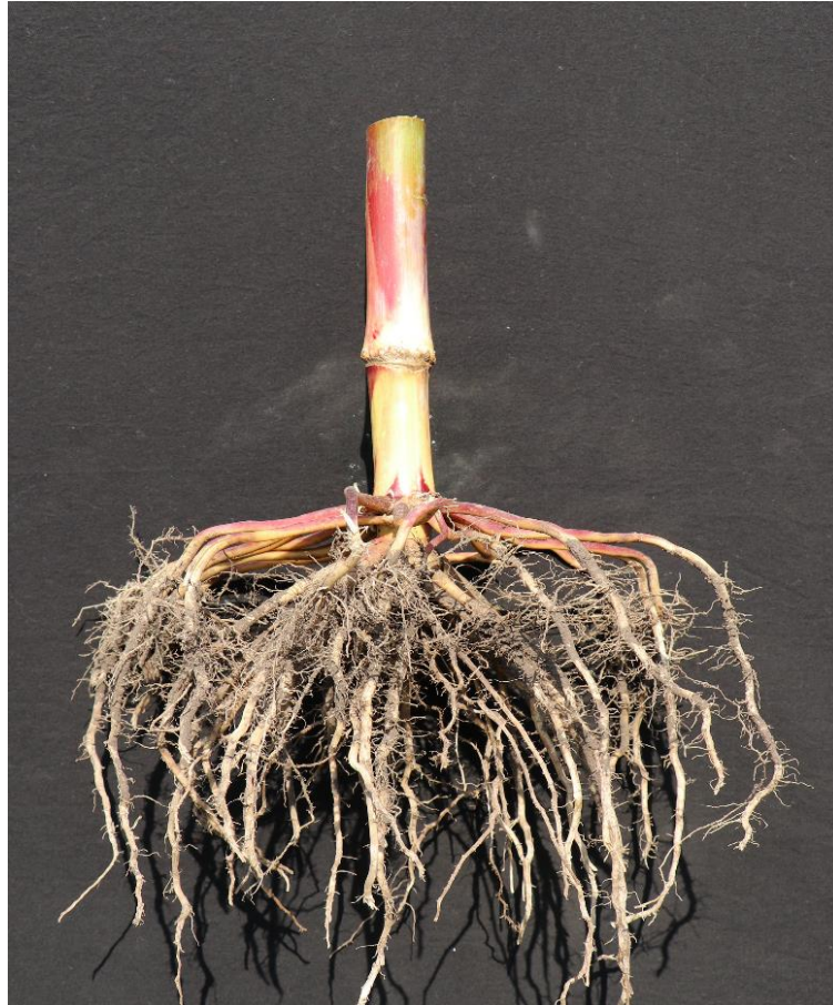
Slika 1. Korijen kukuruza

stabiliziranje biljke. Na razvoj korijena utječu tip tla i plodnost, hibrid, klimatski uvjeti, obrada tla, dubina sjetve, njega i zaštita (Kovačević i Rastija, 2014.). Korijen kukuruza prodire u tlo do 2 m, dok je glavnina korijena u oraničnom sloju od 25 do 30 cm (Pospišil, 2010.).