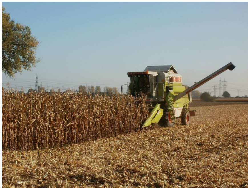
Slika 9. Berba kukuruza u zrnju žitnim kombajnom

Berba kukuruza se obavlja u tehnološkoj zrelosti, a ona ovisi o načinu korištenja kukuruza. Berba kukuruza u klipovima radi se beračima komušaćima, a izvodi se kada vlažnost zrna padne ispod 30 %. U spremnik se skladište zdravi i zreli klipovi s vlažnošću ne većom od 26 %. Za berbu kukuruza u zrnju koristi se žitni kombajn sa specijalnim hederom za otkidanje klipova. Vlažnost zrna treba biti od 25 do 28 % i takvo pobrano zrno se suši u sušarama na 13 % vlažnosti i onda se uspješno čuva u skladištima i silosima. Za berbu silažnog kukuruza koristi se silažni kombajn i to kada je vlaga cijele biljne mase 70 %, odnosno nedozrelog zrna 45 %. Silažni kukuruz koristi se za prehranu stoke i tako smanjuje troškove proizvodnje stočne hrane po jedinici površine (Pospišil, 2010.).