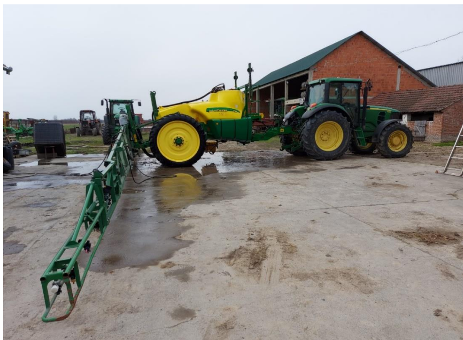
Slika 13. Prskalica John Deere 724

Berba kukuruza u znu započela je 20.10.2020. godine uz vlagu zrna od 15 %. Korišten je kombajn Deutz-Fahr 4080 (Slika 14.) s posebnim Fantini hederom za kukuruz. Ostvaren je prinos od 11,5 t/ha, što je za 28 % više od prosječnog prinosa u Hrvatskoj za 2020. godinu (9 t/ha).