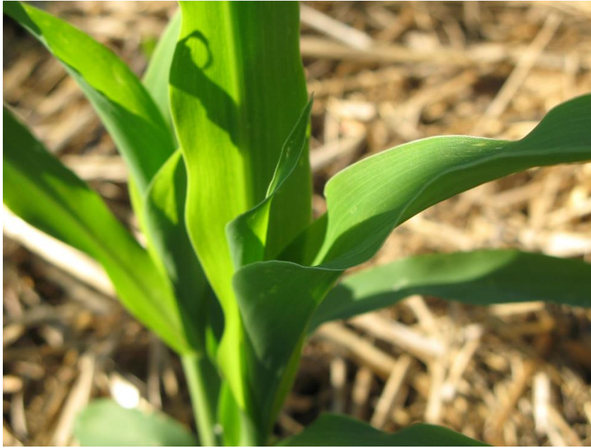
Slika 3. List kukuruza