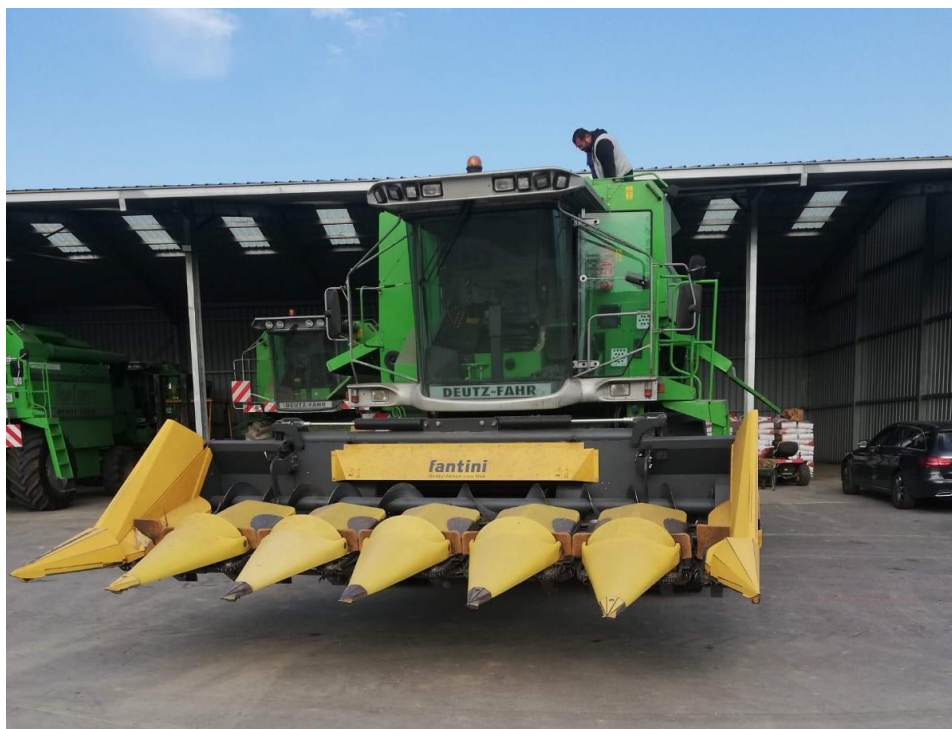
Slika 14. Kombajn Deutz-Fahr 4080 s hederom za kukuruz