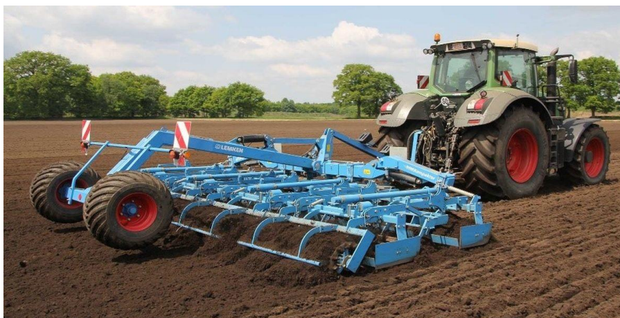
Slika 7. Predsjetvena priprema tla