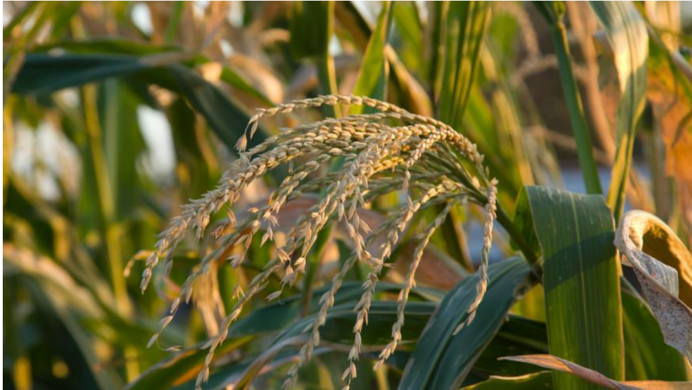
Slika 4. Metlica kukuruza