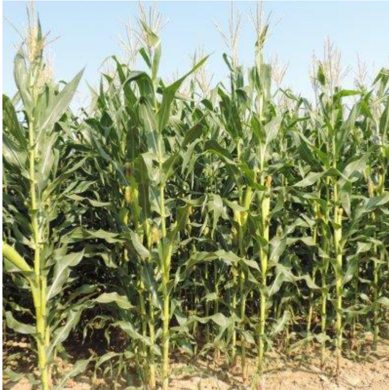
Slika 2. Stabljika kukuruza