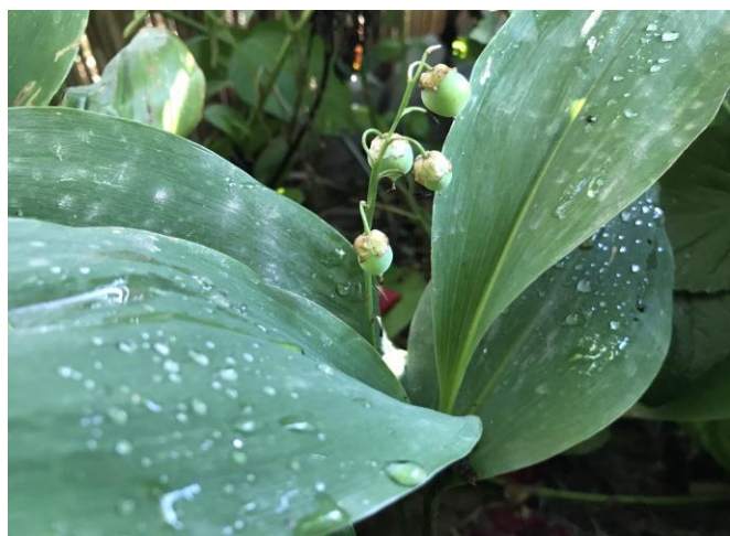
Slika 4. Đurđica ( Convallaria majalis L.)

Listovi, cvijeće i bobice su otrovne, sadrže srčane glikozide. Simptomi trovanja su mučnina, povraćanje, bolovi u želucu, vrtoglavica, umor, glavobolja, pospanost te nepravilan rad srca (Alsop i Karlik, 2016.). Mučnina i povraćanje se javlja unutar nekoliko sati, a klinički učinci se kasnije pogoršavaju te napreduju do letargije (stanje umora-pospanosti), vrtoglavice, povećana koncentracija kalija u krvi, nepravilan rad srca, nizak krvni tlak i bradikardija (usporen rad srca).