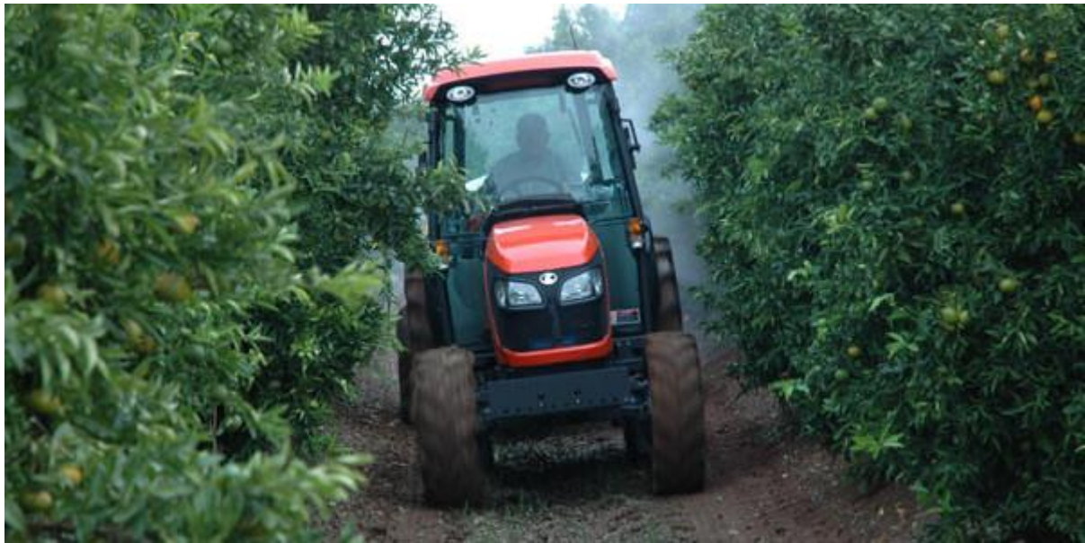
Slika 2. Primjer traktora namijenjen voćarstvu I vinogradarstvu – Kubota M serija, model Narrow