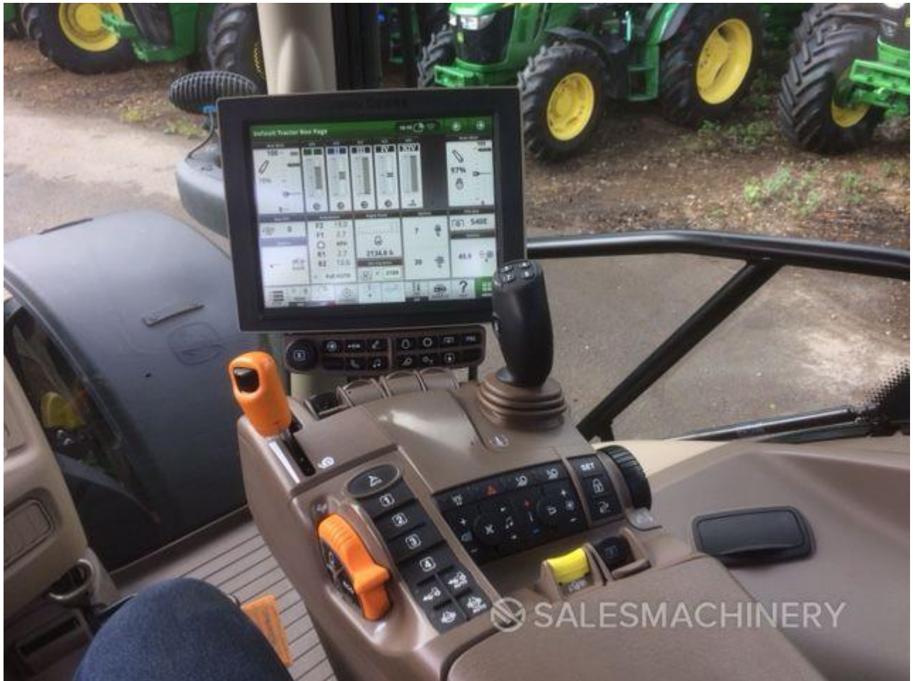
Slika 6. Primjer osobnog računala u traktoru John Deere 625 OR, 2018.