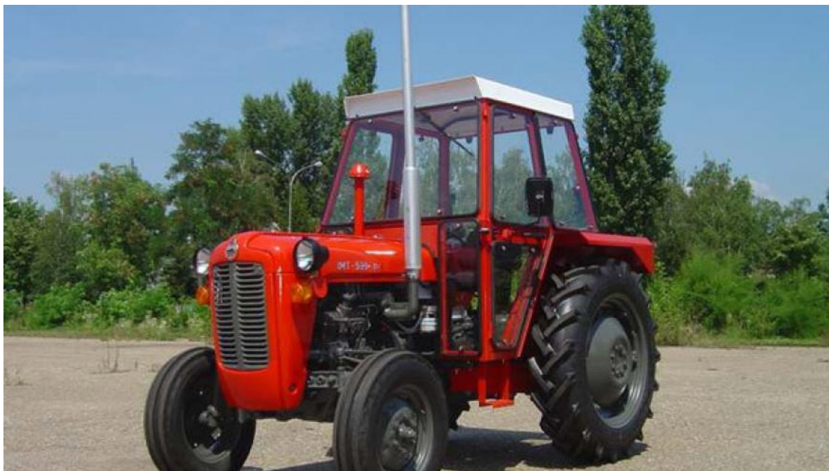
Slika 1. Primjer univerzalnog traktora – traktor IMT 539