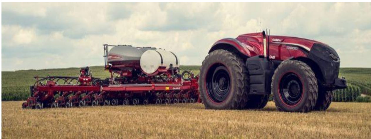
Slika 10. Primjer Autonomous Concept Vehicle traktora budućnosti

Slika 10. prikazuje primjer traktora budućnosti – Autonomous Concept Vehicle.