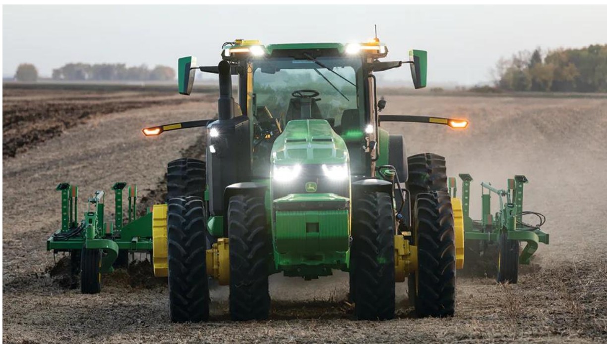
Slika 9. Autonomni John Deere 8R traktor