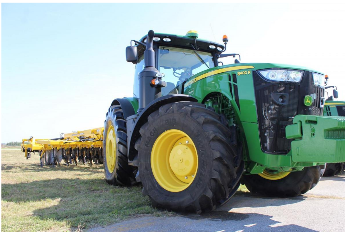
Slika 3. Primjer traktora s kotačima, John Deere, 8400R