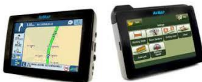
Slika 8. Primjer globalnog sustava za pozicioniranje poljoprivrednih strojeva

Slika 8. Prikazuje kako izgleda globalni sustav za pozicioniranje poljoprivrednih strojeva.