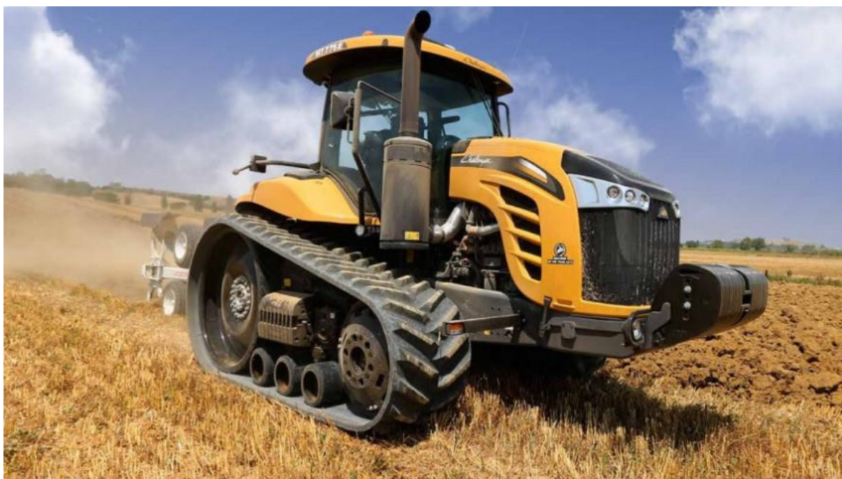
Slika 4. Primjer traktora gusjeničara – Challenger