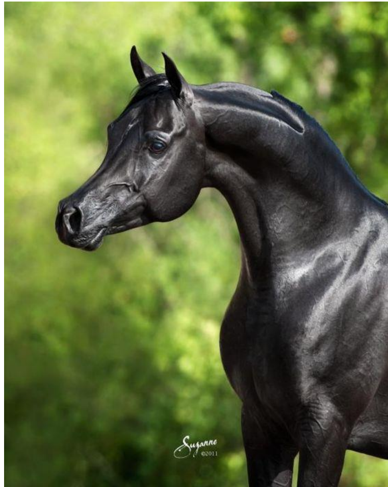
Slika 5. Arapski punokrvnjak (TPS, 2019.)

Arapi kažu da su najizdržljiviji dorati, najbrži alati, s vatrenom krvi vrancu, a blagoslovljeni bijelci (Poljoinfo, 2011.). Crni arapski konji su neuobičajeni, ali nisu tako rijetki kao što su nekad bili. Crna boja upija toplinu, a pustinjski konj s takvom dlakom ne bi bio učinkovit pa su marljivi uzgajivači tu boju izbacivali iz krvnih linija. Danas većina tih konja ne živi u pustinji, a uzgajivači pokušavaju zadovoljiti potražnju za crnim konjima (Holderness-Roddam, 2007.). Masa tijela je od 400 do 450 kg (Ivanković, 2004., Gavran, 2016.).