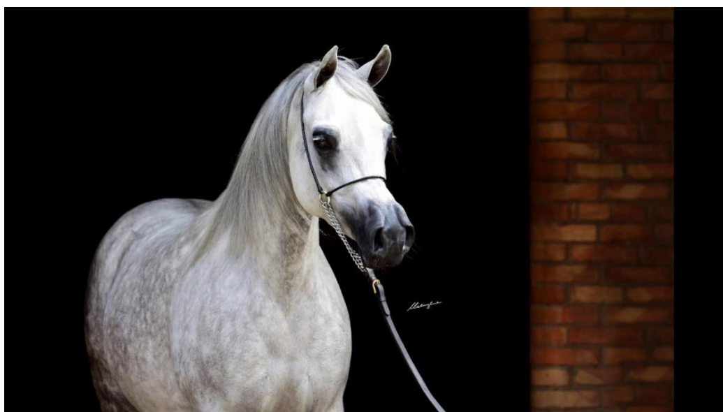
Slika 8. Poljski arapski konj

Poljska je stoljećima bila zemlja poznata po uzgoju konja, a istočnjački pastusi svih pasmina otmiani su Turcima tijekom dugog niza ratova. Oni su nedvojbeno djelovali na poljske konje i nakon što je uhvaćeno nekoliko čistokrvnih arapskih kobila, uzgojeni su čisti u Poljskoj. Od tada Poljska proizvodi neke od najboljih arapskih konja na svijetu, a pastusi su u velikoj potražnji diljem svijeta. Godine 1926. uvedena je Poljska arapska matična knjiga pod pokroviteljstvom Ministarstva poljoprivrede. Ranije su rodovnice vodile sve ergele. Mnogi poljski arapski konji imaju pedigre koji se može pratiti unazad deset generacija, a često i mnogo više, protežući se kroz razdoblja od 150-200 godina. Janow Podlaski, osnovana 1817., sada je glavna poljska ergela gdje se danas proizvode i čistokrvni Arapi i Anglo-Arapi (Costantino, 2003.). Imaju elegantno zaobljene vratove, mišićava tijela, visoko nasadene repove i mala kopita. Visoki su oko 144 do 152 cm i dolaze u različitim bojama dlake, uključujući smeđu, bijelu i sivu. Ovi konji su čvrsti, lijepi i super atletski građeni, vjerni Arapima. Koriste se u konjici, natjecanjima, farmama, a također i za rekreativno jahanje (DHR, 2022.).