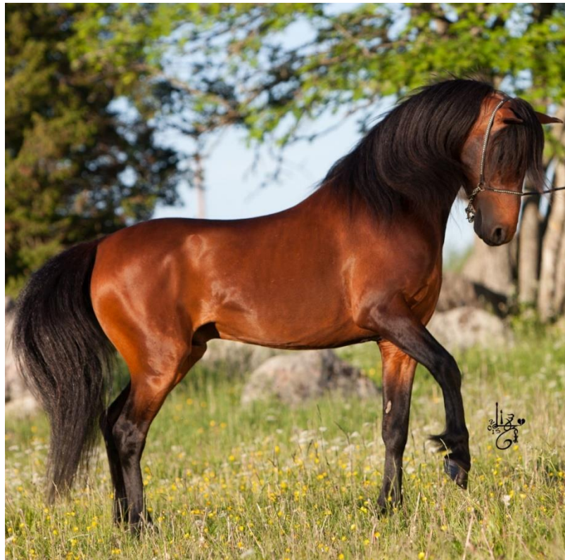
Slika 4. Kaspjski konj (Globe Trotting, 2022.)

ove pasmine i sada postoje ergele u Iranu i kaspjska udruženja u Britaniji, SAD-u, Australiji i Novom Zelandu (Costantino, 2003.). Visina u grebenu je od 100 do 120 cm. Ima konkavan profil i zasvođeno čelo; velike, inteligentne oči; male, pokretne uši; tanak i graciozan vrat; nagnuta ramena; kratka, kompaktna leđa; dobro definirane grebene; visoko postavljeni rep; tanke noge jakih kostiju te jaka ovalna kopita. Kaspjski konj je izuzetno izdržljiv, sa snažnim kopitima koja rijetko treba potkivati osim ako se stalno radi na vrlo tvrdom ili kamenitom tlu. Njihova osnovna boja dlake je dorat, kesten i crna, a ostale boje uključuju sivu i tamnocrvenu. Bijele oznake mogu se pojaviti na glavi i nogama, ali obično se preferiraju minimalne bijele oznake ili nikakve bijele oznake. Spolna zrelost nastupa s oko osamnaest mjeseci (World animal, 2022.).