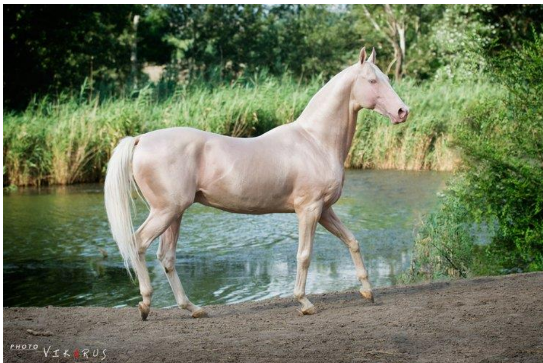
Slika 3. Akhal-Teke (Akhal Teke, 2022.)