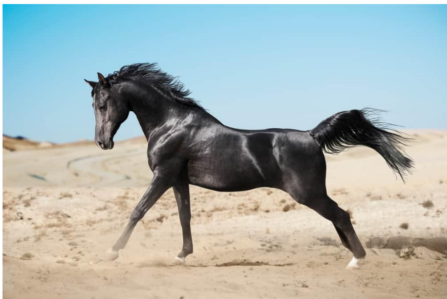
Slika 6. Egipatski arapski konj (DHR, 2022.)

Egipatski tip najčišći je od svih arapskih tipova, jer njegov čistokrvni status dolazi od neprekinute loze. Egipatski arapski konji mogu pratiti svoje krvne loze do stada u Egiptu u vlasništvu potkralja Muhameda Alija i njegovog unuka Abbas-paše I. Za razliku od drugih arapskih tipova koje su naizmjenično uzgajane kako bi se povećao genetski fond, egipatska linija ostaje čista. Ova jedinstveni tip arapskog konja može se 100 % pratiti do beduinskih plemena u Arabiji. Iako su se uzgajali stotinama godina, tek su se 1952. počeli pratiti rodovnici egipatske linije kako bi se službeno označilo njihovo nasljeđe. Danas uzgajivači još uvijek nastoje očuvati ovaj povijesni tip. Cijenjen je zbog svoje manje, profinjenije građe s vrlo ugladenim licem i visokim repom. Obično su sitnije građe od ostalih tipova arapskih konja i visine su od 144 do 154 cm, a mogu biti raznih boja. Pokazuju besprijeckornu ravnotežu inteligencije, hrabrosti, snage i druželjubivosti. Egipatski arapski konj čini samo oko 2 % pasmine. Ovu liniju traže ozbiljni uzgajivači zbog svoje čistoće i elegantne građe (Horsey Hooves, 2021., DHR, 2022.).