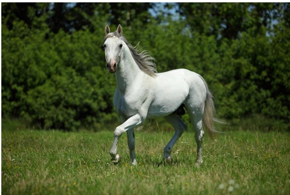
Slika 7. Shagya (FEI, 2021.)

Shagya je pasmina nastala u 19.stoljeću u mađarskoj vojnoj ergeli, namjernim križanjem arapskog punokrvnjaka s andaluzijskim, lipicanskim konjem i engleskim punokrvnjakom. 1836. Baron von Herbert kupio je u Siriji kobilu imena Shagya od tadašnjih beduina te je pasmina po njoj dobila ime i ujedno je začetnica pasmine. Vrsni arapski punokrvnjaci odabirani su u kasnijem uzgoju za oblikovanje pasmine, uz signifikantan priljev krvi engleskog punokrvnjaka, španjolskih i mađarskih konja. Dugotrajan sustavni selekcijski trud za posljedicu je imao stvaranje konja u tipu arapa s naglašenim jahaćim karakteristikama. Kao prepoznatljiv osobit uzgoj postoji od 1960.godine. Veličinom tijela nalazi se između arapskog i engleskog punokrvnjaka (visina u grebenu 153 do 165 cm). Karakteristike vrata i trupa su sličnije engleskom punokrvnjaku, dok je glava sličnija arapskom. Prevladavajuća boja tijela je siva, ali dopuštene su i druge boje. U današnje vrijeme nastoji se povećati okvir raznim selekcijskim metodama, uz očuvanje postojećih značajki arapskog punokrvnjaka. Pretežno se uzgaja u čistoj krvi, ali i služi kao meliorator. Adekvatan je dresuru, jahanje, zaprežna i preponska natjecanja, odličan u galopskim utrkama, kao i u enduranceu (Ivanković, 2004.).