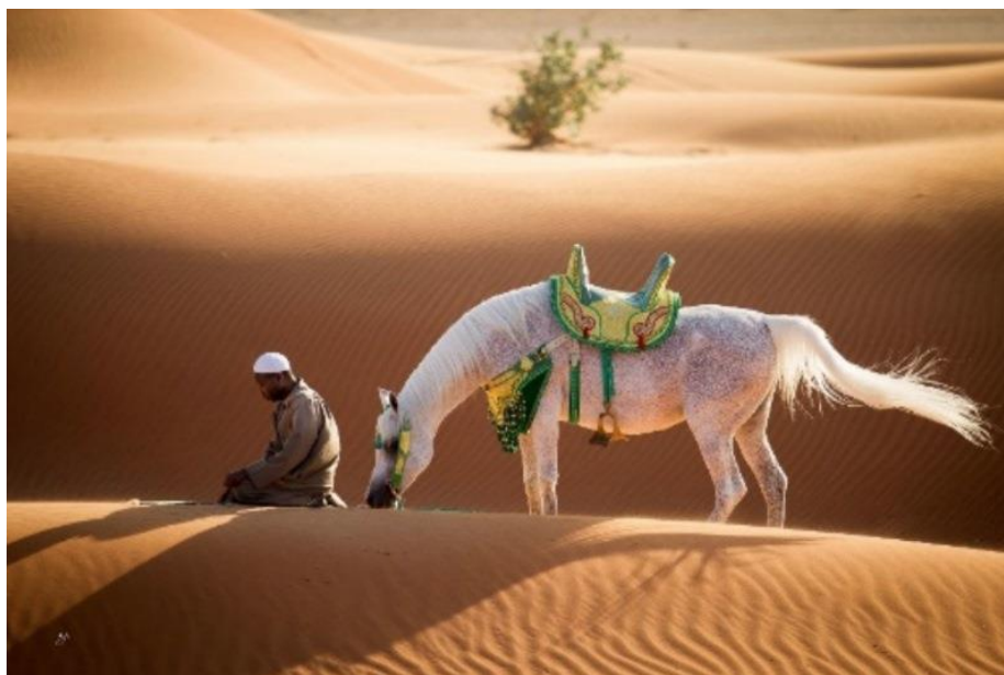
Slika 1. Arapski konj u pustinji (Avad i sur., 2021.)

Zbog teških klimatskih uvjeta beduina nužno je bilo dijeljenje hrane i vode sa svojim konjima (ukoliko nije bilo vode, beduini su im davali datulje i devino mlijeko (Equus Journeys, 2022.)), a ponekad i životnog prostora. Kobile su čak i živjele u šatorima svojih vlasnika ukoliko se radilo o bolesti ili ždrijebljenju, a njihova ždrijebad rasla su zajedno s djecom njihovih vlasnika. Pretpostavka je da je ova bliskost, tisućama godina prenošena genetskim materijalom, razlog zašto su arapski konji jako inteligentni te kompetentni za blisku vezu s čovjekom (Svijet konja, 2017.).