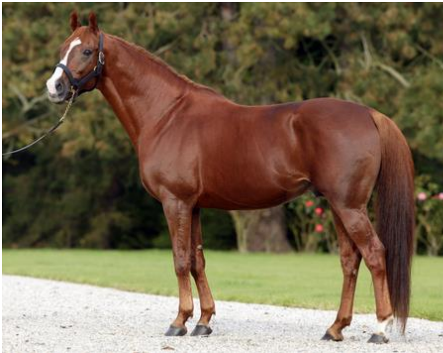
Slika 9. Anglo-Arap

( https://www.horsebreedpictures.com/wp-content/uploads/2017/03/Anglo-Arabians.jpg )