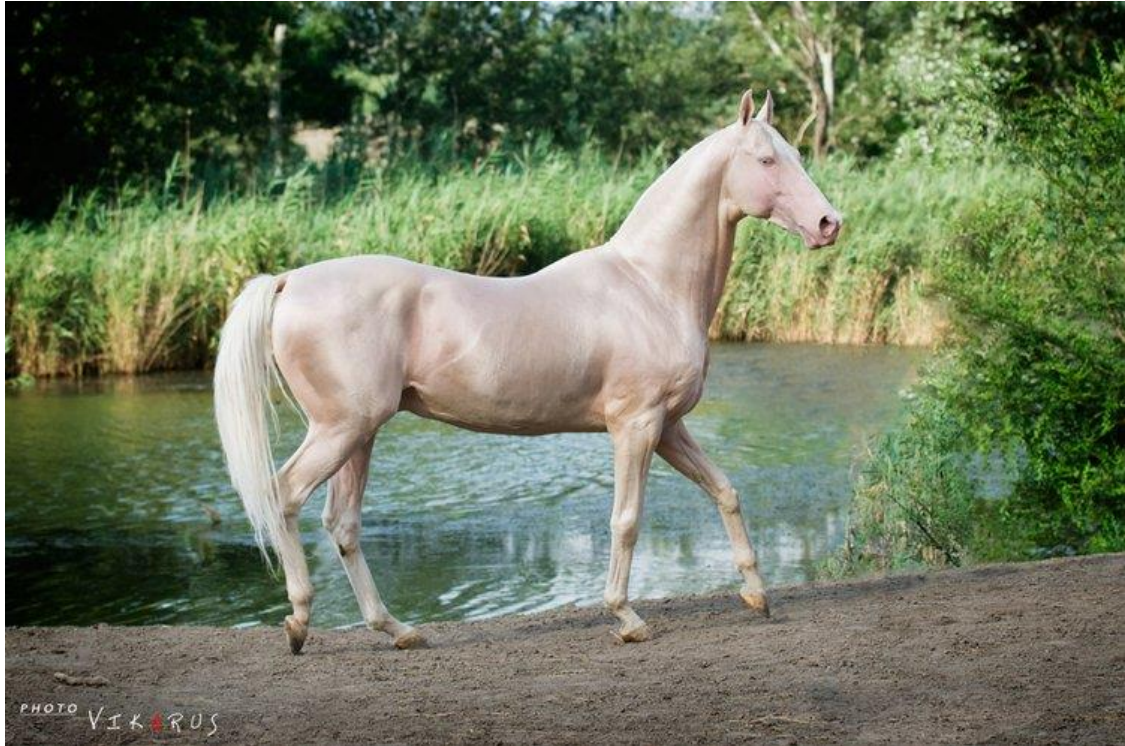
Slika 3. Akhal-Teke (Akhal Teke, 2022.)