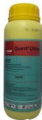
Slika 27. Duett Ultra