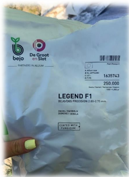
Slika 13. Pakiranje sjemena korištenog u sjetvi