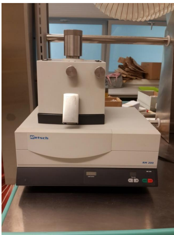
Slika 3a. Mlin Retsch RM200

Čišćenje uzoraka je obavljeno ručno da bi se zrno potpuno odvojilo od pljevica. Za mljevenje u brašno korišten je mlin Retsch RM200 (slika 3a i 3b.). Budući da je cilj ovoga istraživanja bilo utvrđivanje koncentracije cinka u uzorcima, korišteni su posebni gumeni tučci, jer bi korištenjem metalnih noževa moglo doći do povećanja koncentracije metala u uzorcima. Svaki uzorak je mljeven 8 minuta.