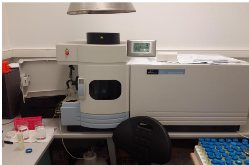
Slika 6. Optima 2100 DV

Induktivno spregnuta plazma je struja visoko ioniziranog argona koji prolazi kroz magnetno polje zavojnice. Visoko frekventno magnetno polje ionizira argon, koji je inertni plin i formira se plazma. Plazma razvija temperature od 8000 – 10000 Kelvina što joj omogućuje determinaciju oko 75 elemenata iz periodnog sustava.