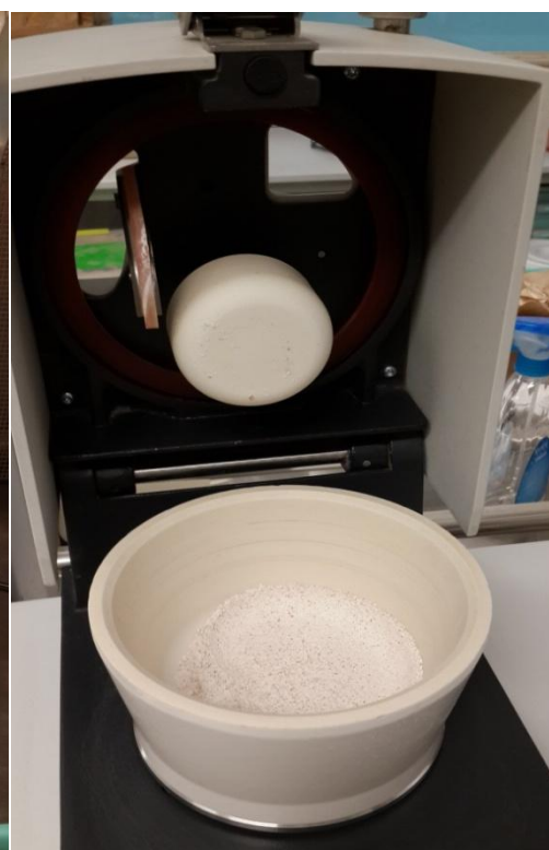
Slika 3b. Mljevenje uzoraka