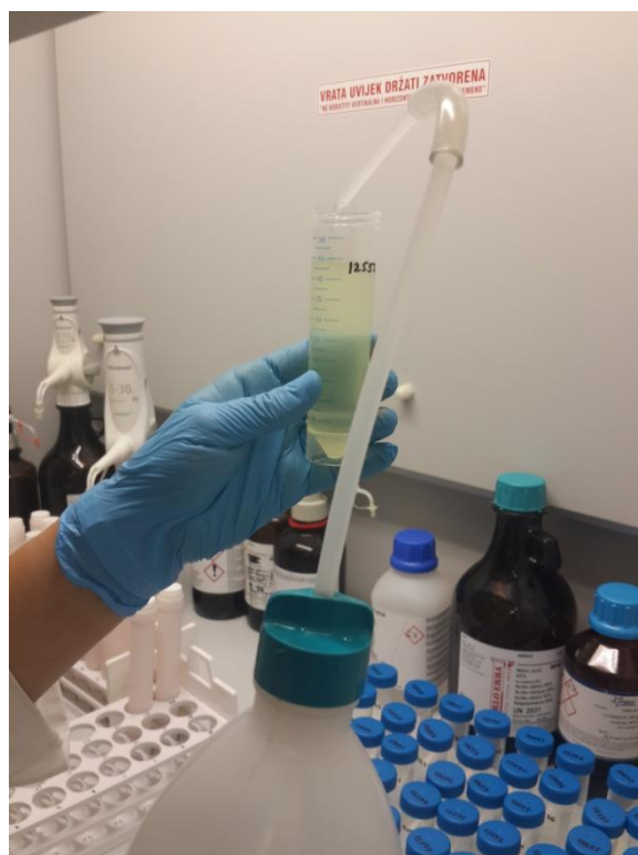
Slika 4. Dodavanje destilirane vode u otopinu

Razaranje biljnog materijala smjesom \text{HNO}_3 i \text{H}_2\text{O}_2 daje najbrže, najsigurnije i najpreciznije analitičke rezultate s točnošću većom od 5% za determinaciju teških metala u biljnoj tvari. Koncentracije teških metala dobivene mjerenjem na ICP-OES-u predstavljaju njihov ukupan sadržaj u biljnoj tvari. Uzorci organske tvari razoreni su prema sljedećem postupku: u teflonske kivete odvažuje se 1 g suhe biljne tvari, te prelije sa 8-10 mL koncentrirane \text{HNO}_3 i 2-4 mL koncentriranog \text{H}_2\text{O}_2 . Kivete se hermetički zatvore i umetnu u za njih predviđeno kružno postolje koje se postavi u mikrovalnu peć. Biljni materijal se razara pod tlakom od 180 psi u trajanju od 20 min. Ohlađeni uzorak se kvantitativno uz ispiranje deioniziranom vodom prelijeva u odmjerne tikvice od 25, 50 ili 100 mL i nadopuni vodom ( \text{dH}_2\text{O} ) do oznake.