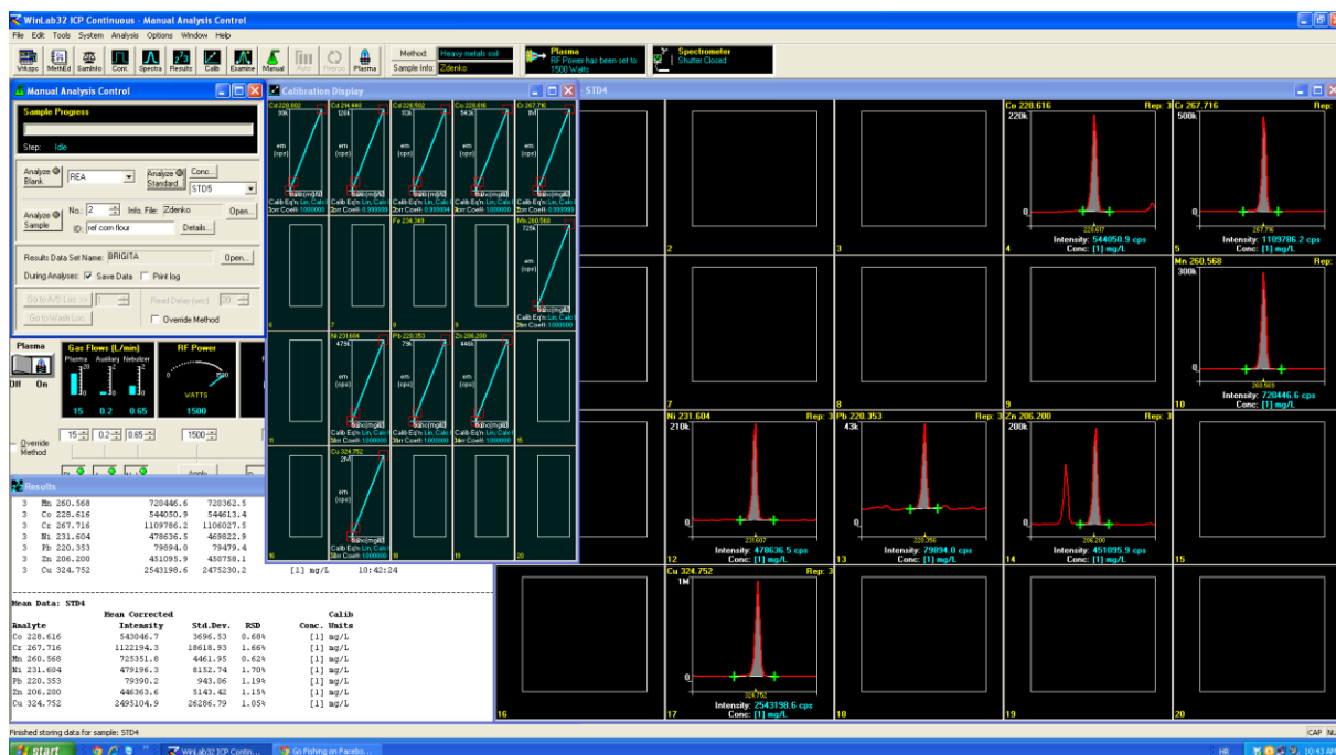
Slika 8. Programski prozor za očitavanje rezultata

Očitavanje rezultata koncentracije Zn u zrnu obavljeno je WinLab 32 ICP Continuous – Manual Analysis Control programom povezanim s gore navedenim ICP - OES uređajem. Na slici 8 je prikazan primjer dobivenog rezultata.