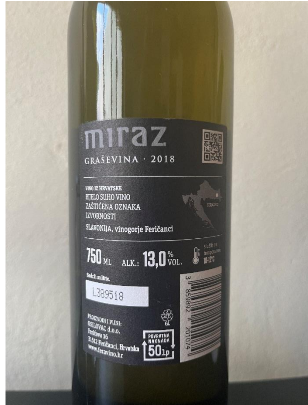
Slika 2. VINO SA ZOI FERAVINO GRAŠEVINA