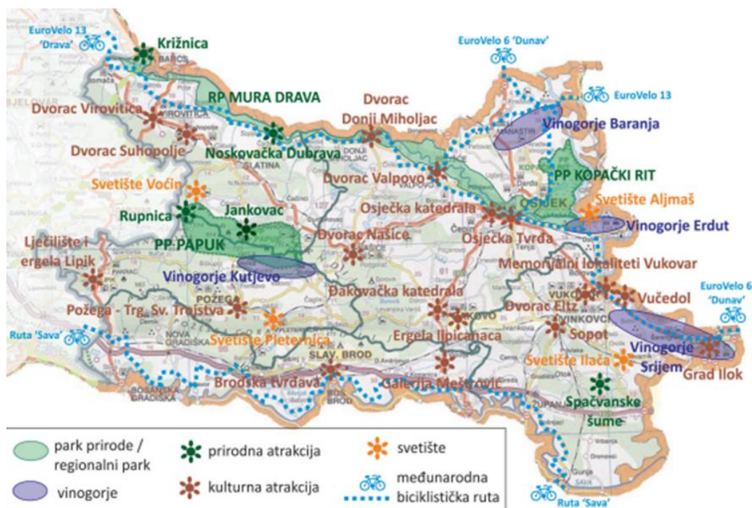
Slika 3. Četiri glavna vinogorja Slavonije

Veliki broj turističkih atrakcija Slavonije i Baranje ima međunarodnu važnost, gospodarstvenu, i prometnu. Malobrojne atrakcije imaju višu razinu uređenosti i veće privlačne snage domaćih i inozemnih turista. Većina manifestacija i atrakcija nema tu postignutu razinu, ali imaju perspektivu prerastanja u međunarodne i nacionalne. Posebno se ističu enogastronomija i tradicijska narodna kultura. U vinogradarskoj tradiciji najistaknutija je proizvodnja prepoznatljivih sorti vina kao što su graševina, traminac i merlot te višetoletna tradicija podrumarstva. Temeljem analize Požeško slavonske županije, Osječko baranjske županije i Vukovarsko srijemske županije izdvojene su manifestacije koje se ističu: Vinogorje Kutjevo; vinogorje / vinski podrumi, Vinogorje Baranja (Kneževi Vinogradi, Zmajevac, Suza); vinogorje / vinski podrumi, Vinogorje Erdut; vinogorje / vinski podrumi, Vinogorje Srijem (Ilok); vinogorje / vinski podrumi.