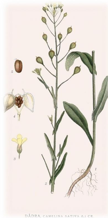
Slika 1. Camelina sativa L.

Domaća imena: kamelina, lanolik, podlanak