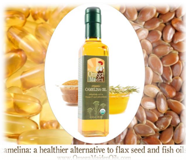
Slika 2. Sjeme i ulje Camelina sativa L. ( http://www.omegamaidenoils.com/blog/wp-content/uploads/2013/08/.jpg )

Sjeme kameline daje ulje zlatne boje, delikatnog okusa poput lješnjaka koje sadrži 45% omega – 3 alfa linolenske kiseline (ALA). Osim vrijednih omega – 3 masnih kiselina, bogata je snažnim antioksidansima, prvenstveno tokaferolom. Sjemenke kameline (Slika 2.) su vrlo male, oko 400 000 sjemenki \text{kg}^{-1} , a sadrže 40 % ulja u odnosu na 20 % ulja kod zrna soje. Ulje dobiveno iz sjemenki ima jedinstveni profil koji pobuđuje veliko zanimanje među krajnjim korisnicima u kozmetici, ljudskoj prehrani i industriji.