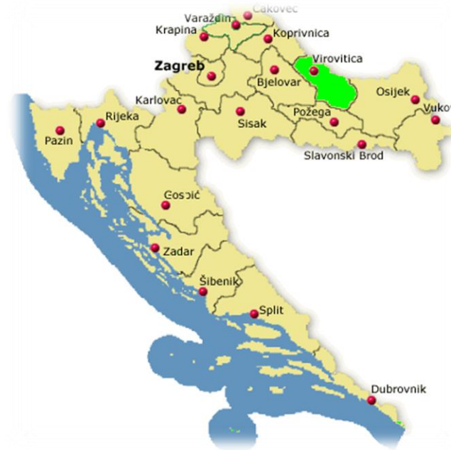
Slika 7. Karta Virovitičko – podravske županije ( www.invest-croatia-vp-country.com )

Istraživanje uzgoja kameline u ekološkom ratarenju provedeno je na lokalitetu Vraneševci, (Virovitičko-podravska županija) na lesiviranom tlu (luvisol).