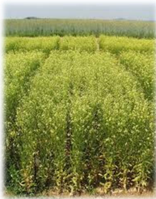
Slika 3. Polje kameline ( https://encryptedtbn0.gstatic.com/images/jpg )

Kamelina izuzetno dobro uspijeva u klimama jugozapada Sjedinjenih Američkih Država i sjeveroistoka Brazila. Odlikuje se jednostavnim i ne zahtjevnim potrebama za tipovima tla, hranivom te temperaturom i oborinama. Zbog kratkog razdoblja vegetacije može se uspješno uzgajati u Sjevernoj Europi, ponekad prelazi čak liniju Arktičkog kruga te se istodobno može uzgajati u gorju, na visinama do 1 400 metara.