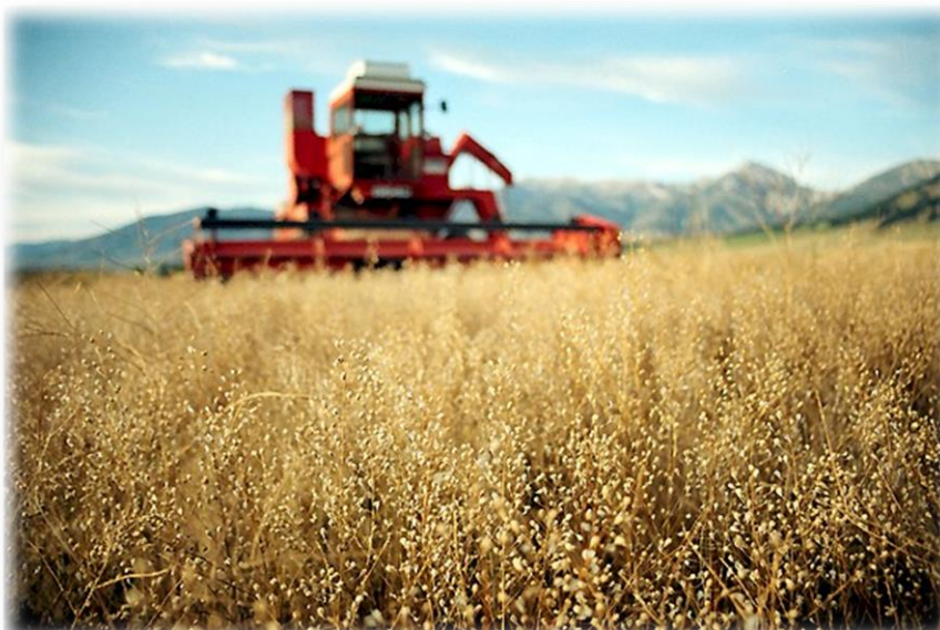
Slika 4. Žetva kameline

U svakom slučaju, sjeme treba osušiti na 6- 8 % vlage pri kojoj se može skladištiti do daljnje prerade. Visina uroda zrna kameline se kreće od 500 do 2 500 kg ha -1 .