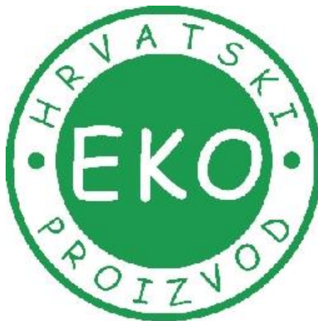
Slika 6. Eko znak u Hrvatskoj ( http://www.kontkod.hr/ekomed/ekoznaknovi.jpg )

U Hrvatskoj je ekološka poljoprivreda zakonski regulirana tek 2001. godine kada je donesen prvi Zakon o ekološkoj proizvodnji poljoprivrednih i prehrambenih proizvoda koji je bio u skladu sa regulativama EU i IFOAM-a, dok je novi Zakon o ekološkoj poljoprivredi i označavanju ekoloških proizvoda (Slika 6.) donešen je 2010. godine. Ulaskom u Europsku uniju, 1. srpnja 2013. godine, u potpunosti je preuzeta europska regulativa ekološke poljoprivrede.