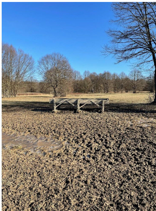
Slika 8. Silazni stol za prihranu jelenske divljači – Lovište „Kapelački lug“