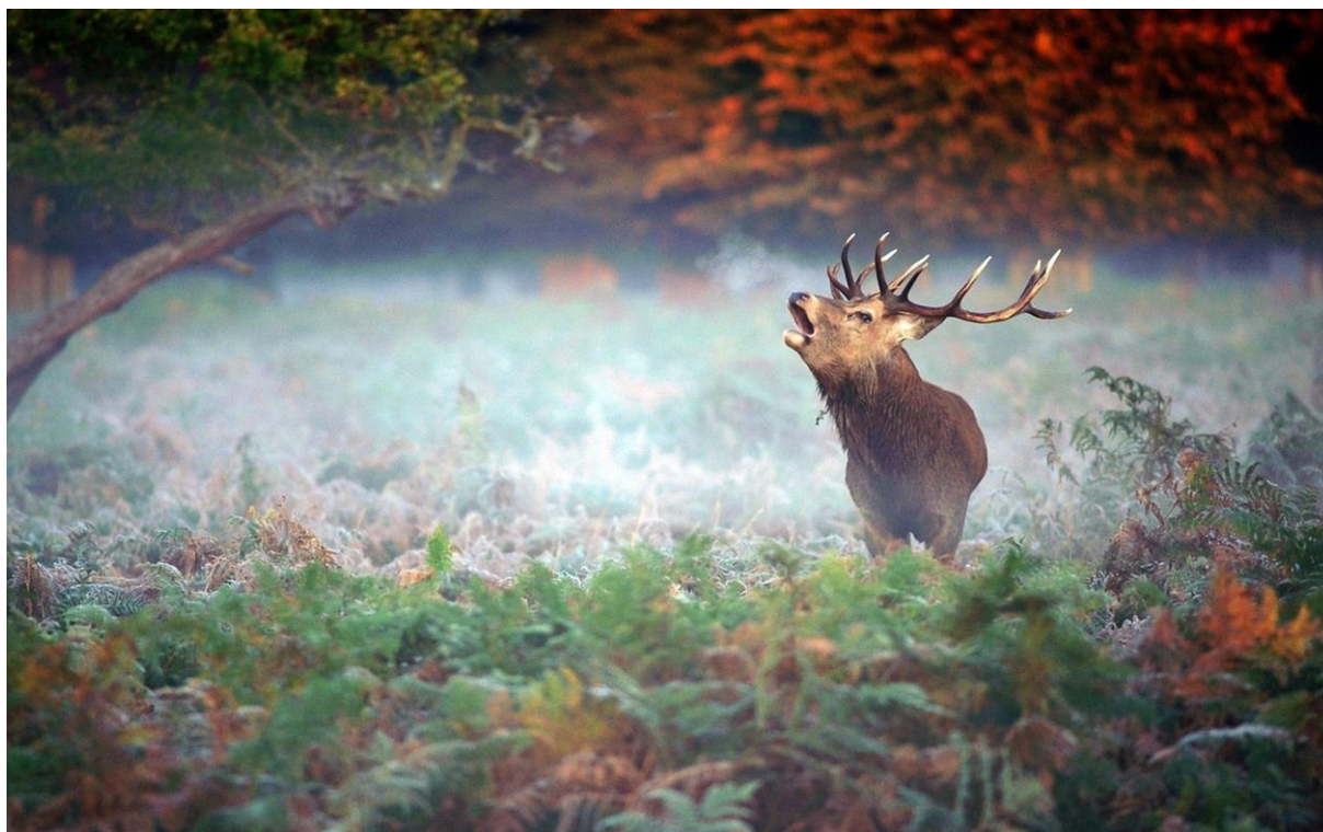
Slika 1. Jelen obični ( Cervus elaphus L.) u prirodnom staništu

izraženije. Boja dlake je ljeti hrđavo- crvena, na trbuhu svjetlija do žućkasta. Krški soj jelena je znatno tamniji boja mu je tamno- hrđastosmeđa što je odlika križanja s nizinskim sojem. Zimska dlaka je puno gušća i duža te varira od sivosmeđe do tamnosmeđe. Duža dlaka na vratu nakon treće godine dobiva izraziti oblik grive pa se po veličini grive približno ocjenjuje starost jelena. Zadnjica i košute i jelena je prljavo- bijele do žuto- crvenkaste boje, a obrubljena je tamnocrvenom dlakom , zimi je siva. Jelen ima vrlo dobro razvijena osjetila. Nanjušiti može čovjeka i na 150 metara uz povoljan vjetar, a također i dobro čuje. Zbog asigmatične građe očiju lošije vidi. Životni vijek jelena kreće se od 15 – 20 godina. Rast jelena završava sa 8 – 9 godina, a košute sa 3 – 4 godine (Mustapić i sur. 2004., Tucak i sur. 2002.).