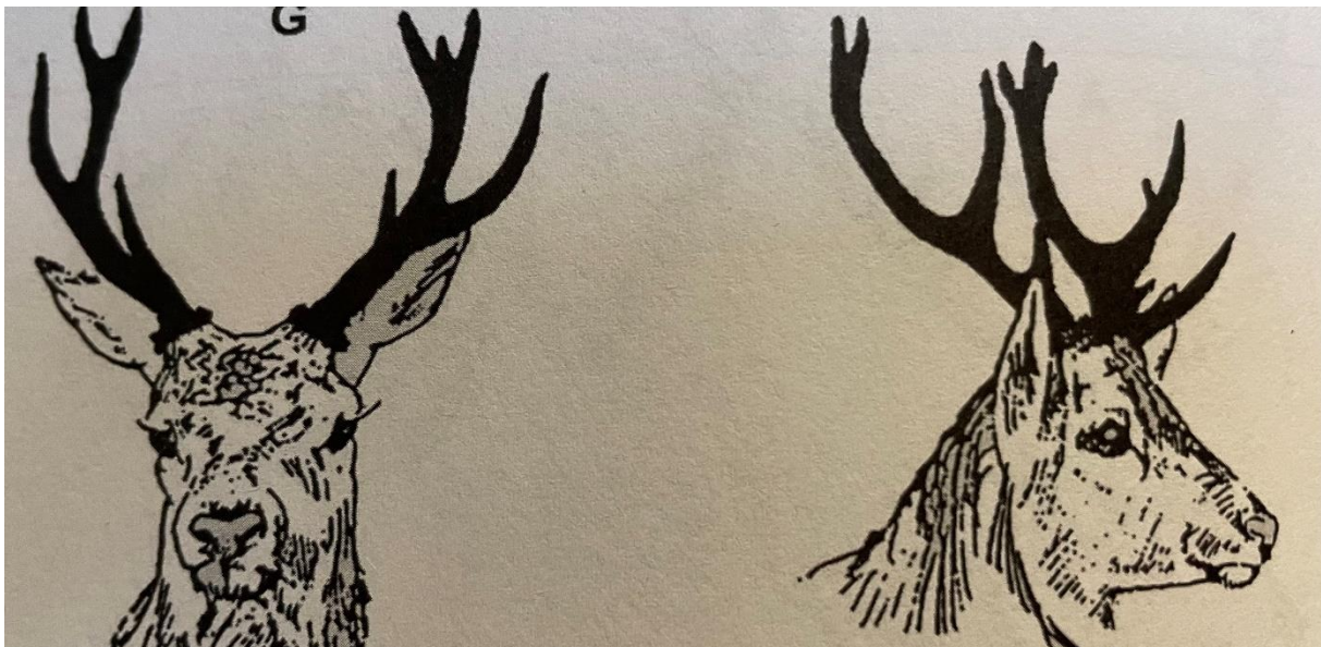
Slika 3. Uzgojno vrijedni jeleni četvrte godine života okarakterizirani jakim i dugim parošcima, posebno paroškom srednjakom (slika iz knjige Sertić, D., (2008.) Uzgoj krupne divljači i uređivanje lovišta. Veleučilište u Karlovcu.)

Kod jelena nazadnjaka starih 14 i više godina razvoj rogova nazaduje, vrijednost trofeje pada. Jelene tih godina koje smo ostavili u lovištu zbog dobrih nasljednih osobina, a prešli su kulminaciju moramo posebno pratiti jer gubitkom parožaka u kruni zadržavaju nadočnjak i srednjak. Ti parošci su u pravilu dugi i snažni pa takve jelene nazivamo ubojicama i siledžijama jer napadaju, ranjavaju i ubijaju i moramo ih bezuvjetno odstrijeliti jer nam mogu ubiti najjačeg i najkvalitetnijeg jelena.