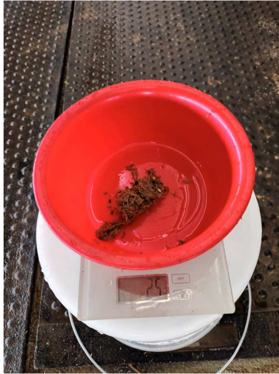
Slika 6. Kontrola 2. sito