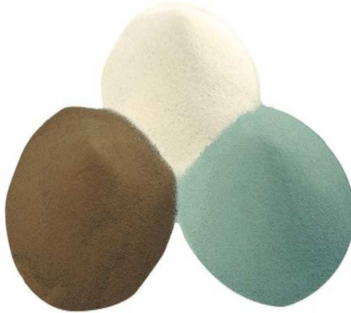
Slika 2. Minerali u tragovima, Article about Intellibond in Dairy Global Magazine

Minerali u tragovima utječu na fiziološke performanse krave uključujući imunološku sposobnost, cjelovitost kopita i reprodukcija. Kada su 1940-ih i 1950-ih uvedeni izvori minerala u tragovima sulfata, malo je istraživanja provedeno o tome kako su radili u životinji. Kako su istraživači saznali više o posljedicama upotrebe sulfatnih minerala u tragovima u obroku, organski izvori minerala u tragovima razvijeni su 1970-ih i 1980-ih. Dok su organski izvori poboljšali neke probleme povezanim sa sulfatnim mineralima u tragovima, učinili su to uz naglo povećanje cijene. Uvođenje hidrosikloridnih minerala u tragovima 1990-ih pružilo je učinkovit i ekonomičan pristup hranjenju esencijalnim mineralima u tragovima. Minerali u tragovima hidrosiklorida daju učinkovitost jednaku – i potencijalno bolju – od organskih, ali po pristupačnijoj cijeni. Napravljen s kristalnom strukturom i čvrst kovalentne veze, minerali u tragovima hidrosiklorida manje su topljivi i manje reaktivni od sulfatnih minerala u tragovima.