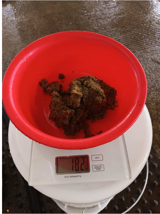
Slika 16. Završno uzimanje uzoraka pokus 3. sito