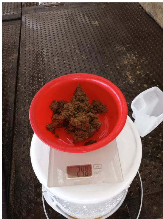
Slika 10. Pokus 3. sito