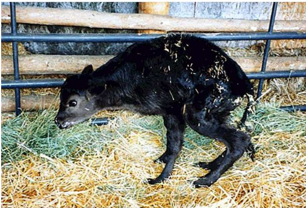
Slika 4 . Rahitis kod teladi

Veće količine minerala troše se i kod povećane proizvodnje mlijeka, jaja, vune, u tovu. Posebice je potrebno osigurati dovoljne količine kalcija i fosfora koji moraju biti u određenom odnosu. Ali taj odnos je često poremećen pa dolazi do mnogih anomalija kao što su: rahitis i osteomalacija, proždiranje raznih predmeta, lizanje zidova, pijenje tekućeg stajnjaka, nošenje jaja s mekom ljuskom, kanibalizam i slično. Također, manjak kalija i natrija u organizmu dovodi do različitih anomalija, kao što su poremećaji u probavi, smanjenje produkcije mlijeka, gubljenje apetita, lizanje raznih predmeta, smetnje u funkciji mišića i tako dalje.