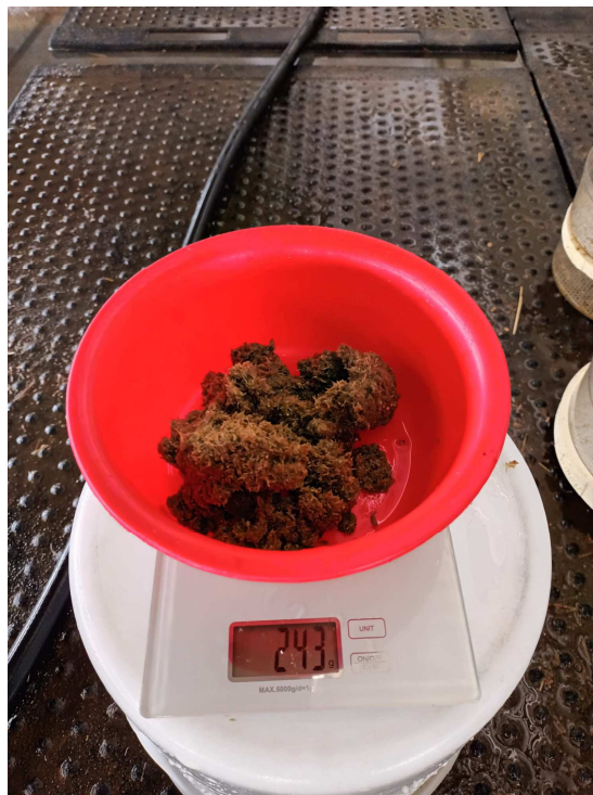
Slika 13. Završno uzimanje uzoraka kontrola 3. sito