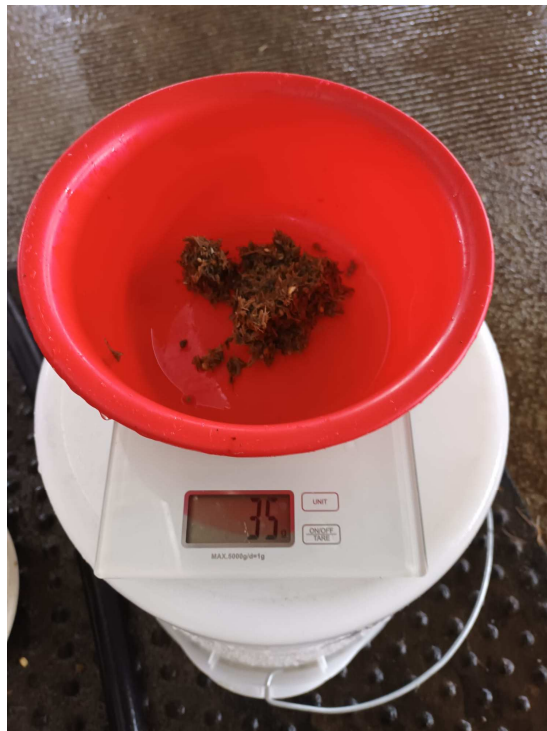
Slika 15. Završno uzimanje uzoraka pokus 2. sito