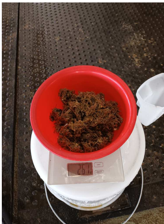
Slika 8. Pokus 1. sito