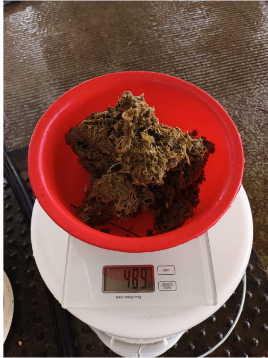
Slika 14. Završno uzimanje uzoraka pokus 1. sito