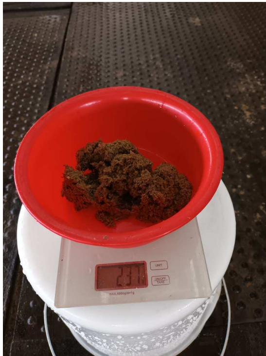
Slika 7. Kontrola 3. sito