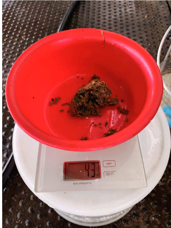
Slika 12. Završno uzimanje uzoraka kontrola 2. sito