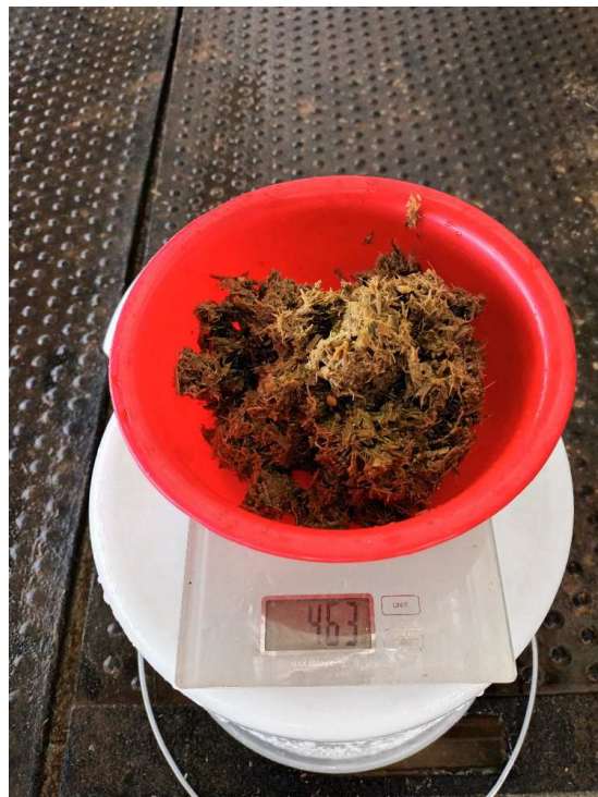
Slika 11. Završno uzimanje uzoraka kontrola 1. sito

Druga kontrola uzoraka 24. ili 25.05.2022/ sakupljanje uzoraka balege za ispitivanje na fakultetu, te ispiranje balege Nasco sitima ( za vizualni pregled) s čime završavamo pokusni period i uzimanje podataka za mjerenje probavljivosti.