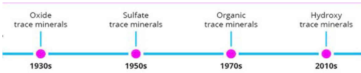
Slika 3. Vremenski okvir inovacije minerala u tragovima, Article about Intellibond in Dairy Global Magazine

Svaki poremećaj odnosa mineralnih tvari u organizmu dovodi do promjena zdravstvenog stanja, dok nepovoljna vitaminska hranidba dovodi do najrazličitijih patoloških stanja kod raznih vrsta i kategorija domaćih životinja.