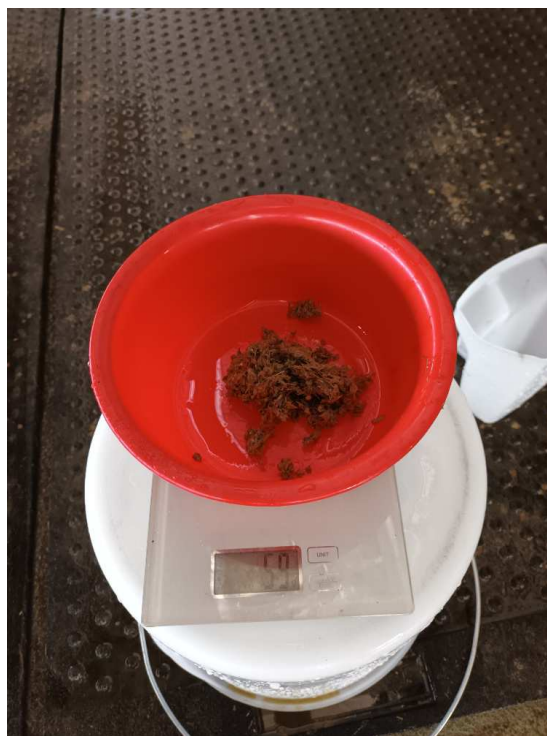
Slika 9. Pokus 2. sito