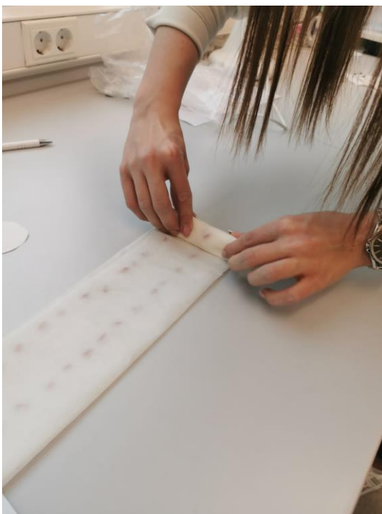
Slika 5. Zamatanje filter papira za PVC vrećicu

Nakon postavljanja zrna na filter papir, isti je lagano zamotan (Slika 5.) i stavljen u PVC vrećicu kako bi se spriječilo isparavanje vlage tj. otopine iz filter papira. U svakoj vrećici stavljena je oznaka s brojem tretmana, odnosno pH vrijednosti i temperaturom. Zrno zobi se naklijavalo na dvije različite temperature (15 °C i 20 °C) u klima komori (Slika 6.), a tijekom pokusa redovito je obavljen pregled svih ponavljanja i tretmana.