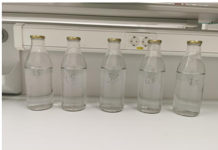
Slika 2. Otopine različitih pH vrijednosti