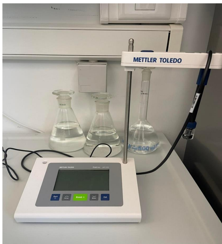
Slika 1. pH metar

Prije postavljanja pokusa, pomoću pH metra (Slika 1.), destilirane vode i otopine klorovodične kiseline (HCl) i natri hidroksida (NaOH), napravljene su otopine različite pH vrijednosti (3,5, 4,5, 5,5, 6,5 i 7,5) koje su korištene u provedenom pokusu (Slika 2.). Otopine su čuvane u staklenim bocama do trenutka korištenja u laboratorijskom pokusu, a bile su bezbojne. S obzirom da se radi o kemijskim otopinama sav pokus je rađen uz pomoć gumenih rukavica.