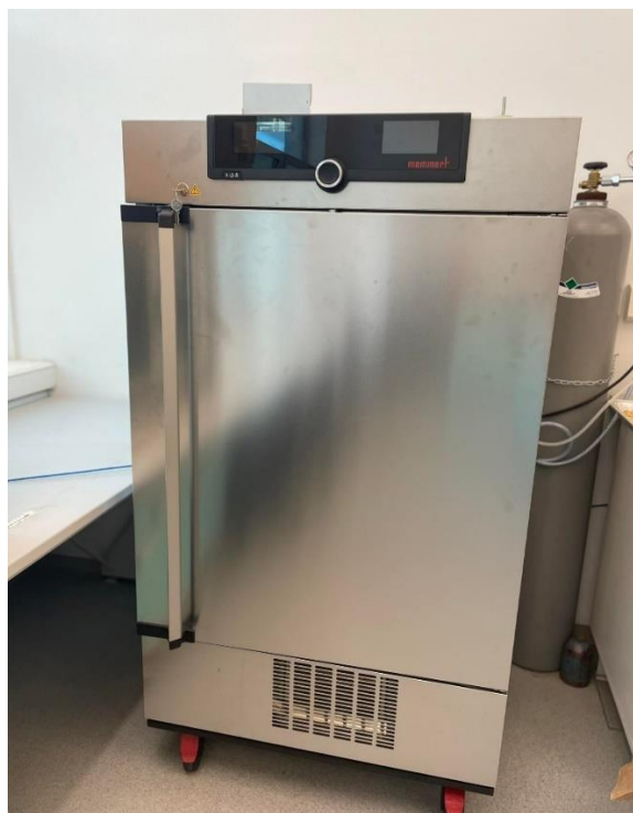
Slika 6. Klima komora