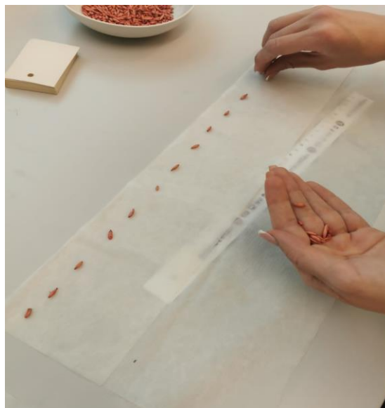
Slika 4. Postavljanje zrna na filter papir