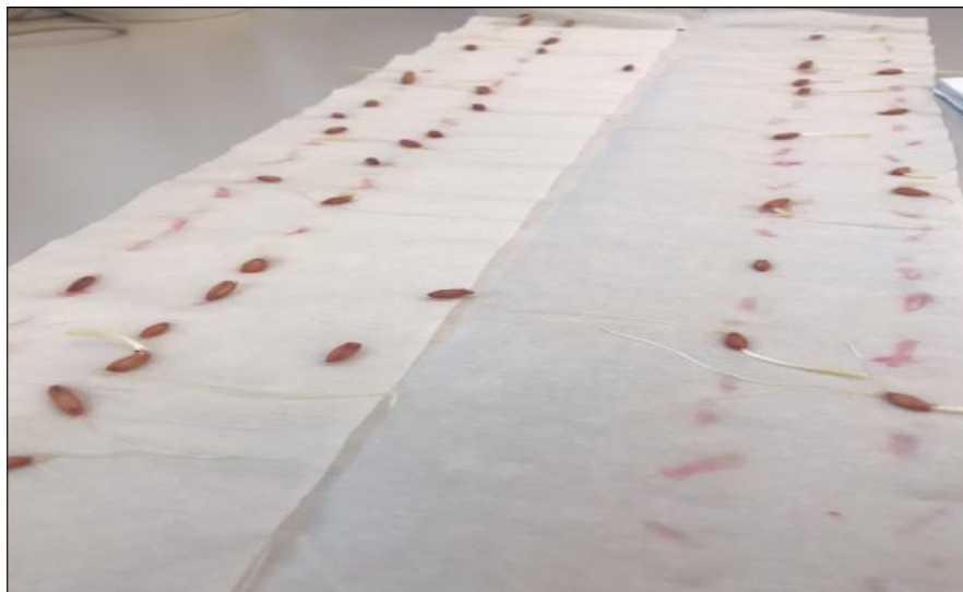
Slika 7. Određivanje ukupne klijavosti zrna zobi nakon 4 dana