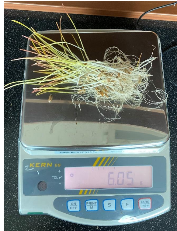
Slika 9. Mjerenje svježe mase raži pri temperaturi od 20°C