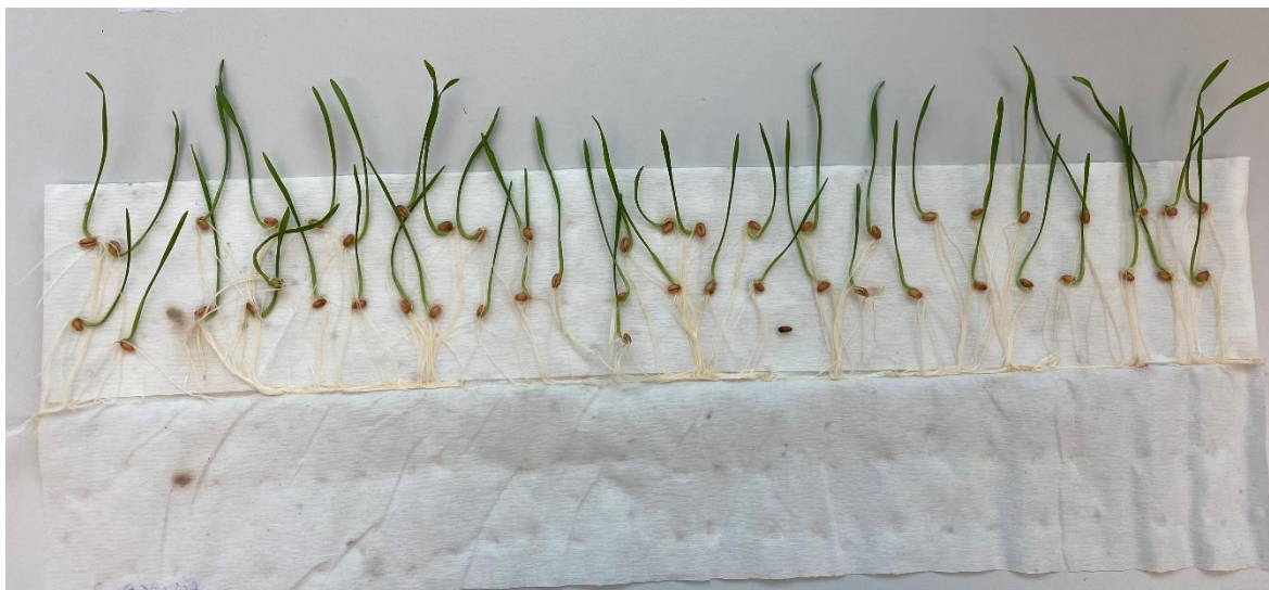
Slika 6. Mjerenje različitih morfoloških svojstava na klijanju pšenice pri temperaturi 10°C

Nakon 8 dana od početka postavljanja pokusa, u laboratoriju na fakultetu provedeno je mjerenje morfoloških svojstava biljke: broj korijena, dužina korijena (cm), dužina koleoptile (cm), dužina izdanka (cm), svježa masa (g), suha masa (g) i ukupno klijanje pšenice, ječma, raži i zobi za svako ponavljanje posebno (Slika 6. i Slika 7.).