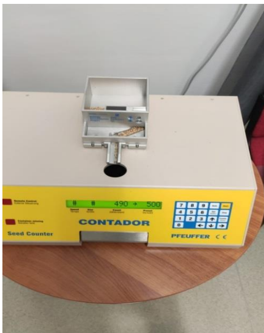
Slika 8. Brojač zrna