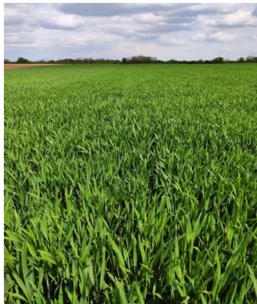
Slika 11. Sorta Kraljica