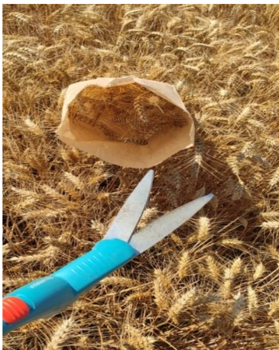
Slika 6. Uzimanje uzoraka za analizu

Sva mjerenja su obavljena na Fakultetu agrobiotehničkih znanosti Osijek (Slika 7., Slika 8. i Slika 9.), a određivanje kvalitete zrna je obavljeno na Poljoprivrednom institutu Osijek uz pomoć uređaja Infratec Grain analyzer.