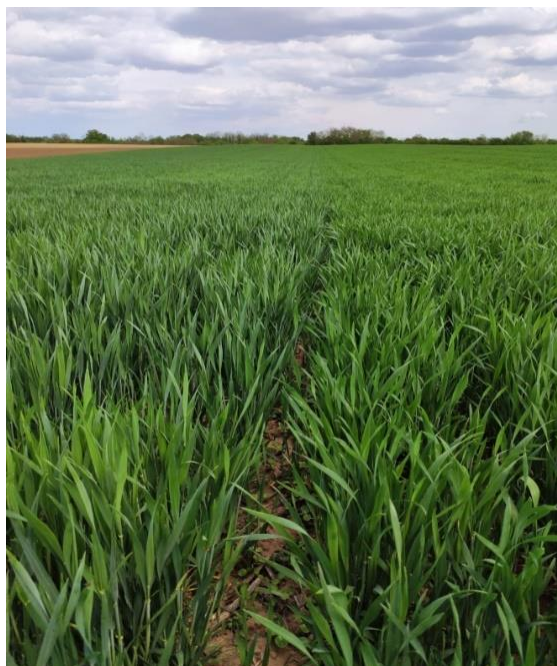
Slika 5. Izgled usjeva pšenice

Prilikom obilaska usjeva pšenice 02. svibnja 2022. obje sorte pšenice su izgledale vrlo dobro. Sofru je bujnijeg rasta, blijedo zelene boje lista i vidljivo je gušća dok je Kraljica niža i manje bujna sa tamnije zelenim listovima (Slika 5.). Općenito, oba usjeva su imali dobru kondiciju bez prisutnosti bolesti i štetnika.