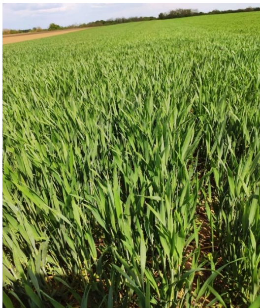
Slika 10. Sorta Sofru

bjelančevina je oko 14 %, a masa 1000 zrna u prosjeku iznosi 40 g. Karakterizira je visoka tolerantnost na niske temperature i najraširenije bolesti u Hrvatskoj, te je vrlo otporna na polijeganje. Optimalni rok za sjetvu ove sorte je od 10. do 25. listopada s 500 – 650 klijavih zrna po m 2 (POLJINOS katalog, 2021.).