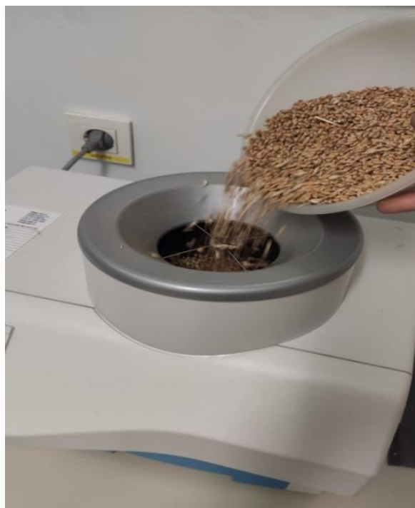
Slika 7. Mjerač vlage i hektolitara