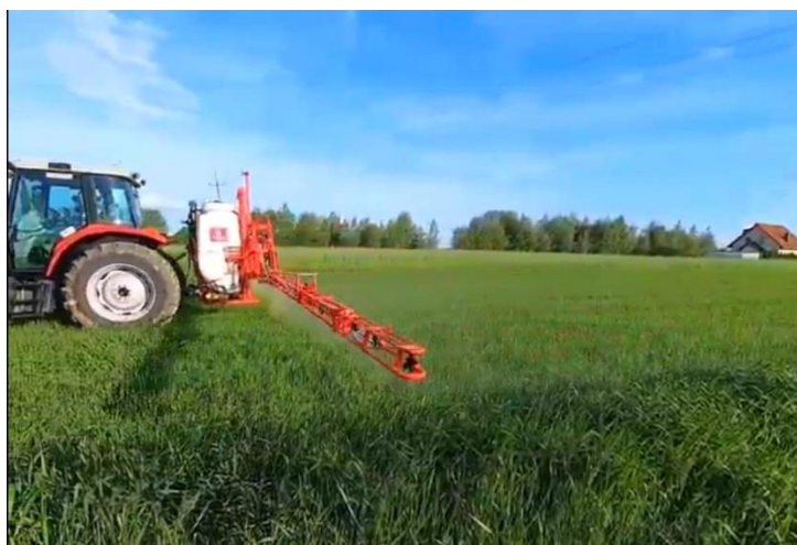
Slika 4. Zaštita pšenice od korova

Prilikom obilaska usjeva pšenice 02. svibnja 2022. obje sorte pšenice su izgledale vrlo dobro. Sofru je bujnijeg rasta, blijedo zelene boje lista i vidljivo je gušća dok je Kraljica niža i manje bujna sa tamnije zelenim listovima (Slika 5.). Općenito, oba usjeva su imali dobru kondiciju bez prisutnosti bolesti i štetnika.