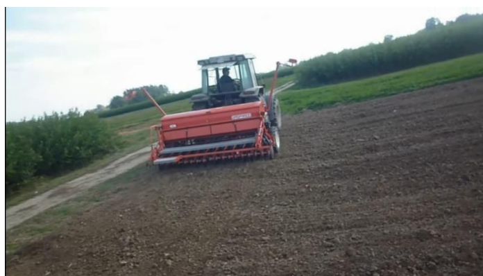
Slika 2. Sjetva pšenice na pokusu

Predkultura na provedenom pokusu je bio suncokret nakon čega je izvršeno samo tanjuranje u dva prohoda, jedan prohod sjetvospremačem i jedan prohod drljačom nakon sjetvospremača kako bi se usitnilo i priredilo tlo za obavljanje sjetve. Sjetva pokusa obavljena je sa mehničkom sijačicom za strne žitarice Gaspardo zahvata 3 m i 21 redom (Slika 2.). Razmak između reda je 14 cm.