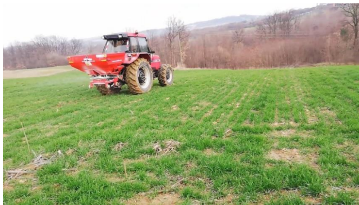
Slika 3. Obavljanje prihrane pšenice

Nakon žetve suncokreta kako bi ubrzali razgradnju žetvenih ostataka dodano je 100 kg/ha ureje (46 % N), a predsjetvena gnojidba obavljena je sa 350 kg/ha mineralnog gnojiva N:P:K formulacije 15:15:15. Pokus pšenice gnojili smo različito. Kontrolna parcelica gnojena je u tri navrata i to osnovna gnojidba i dvije prihrane (Slika 3.). Kod GT1 dodavali smo preporučenu dozu folijarnog dušičnog gnojiva od 50 ml/100 m 2 , dok smo u GT2 dodavali duplu dozu folijarnog gnojiva. Sredstvo korišteno u pokusu je FERTPOL LN 30 sa 30 % dušika.