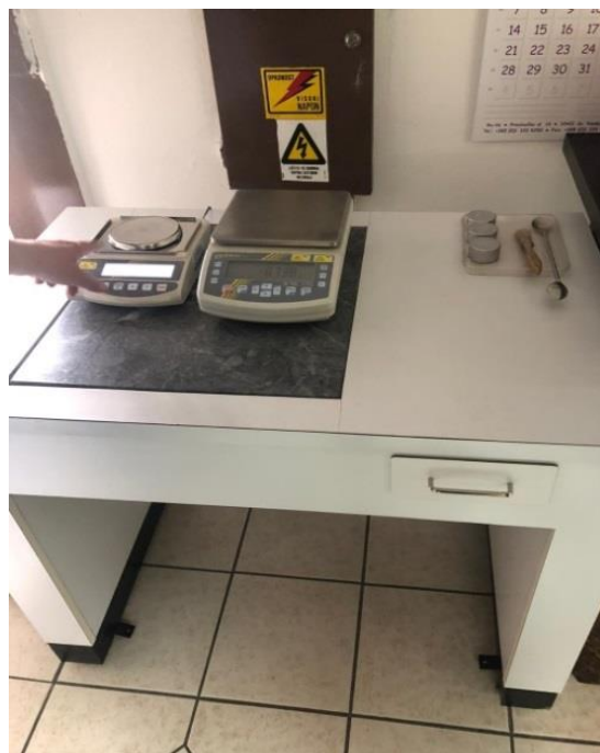
Slika 9. Precizne vage