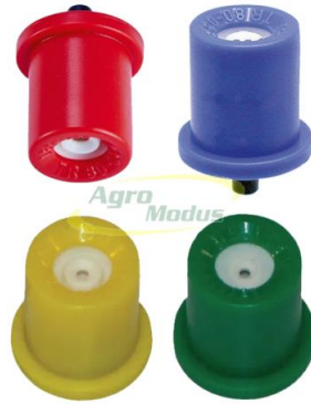
Slika 3. Mlaznice raspršivača

Mlaznice raspršivača (slika 3.) otporne na začepljenja zbog svoga okruglog dizajna otvora. Ove mlaznice su keramičke izrade te osiguravaju fine kapljice da bi se ostvarila visoka pokrivenost lisne mase, te imaju osigurač koji ih osigurava od ispadanja.