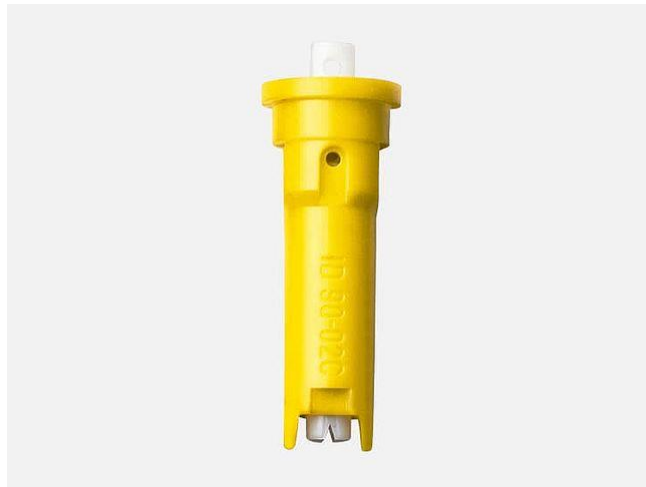
Slika 13. Injektorska mlaznica Lechler ID 90 – 02

Do raspršivanja dolazi izlaskom tekućine kroz otvor mlaznice. Glavni cilj razvoja ovog tipa mlaznice je sprječavanje zanošenja, uz zadržavanje dobrih svojstava koje imaju mlaznice sa lepezastim mlazom.