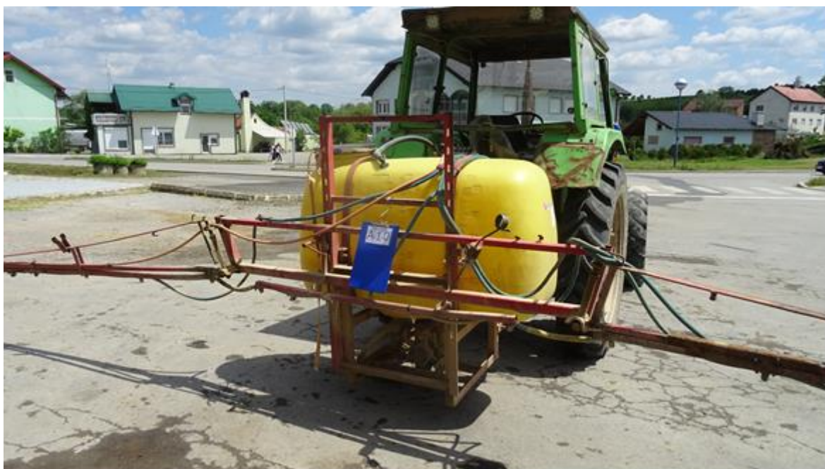
Slika 17. Prskalice MIO M – 612

Na području općine Čaglin testirana je prskalice proizvođača MIO M – 612 u vlasništvu M. B. iz Darkovca. Proizvedena je 2003. godine i nošene je izvedbe. Prskalice je opremljena crpkom tipa Zetta 100 1 C koja ima protok od 92 L pri tlaku od 3 bara. Volumen spremnika za sredstvo iznosi 660 L, mješalica hidraulične izvedbe, broj sekcija je 5, radna širina 12m sa 24 mlaznice raspoređenih na 50cm i tip mlaznice je 110 03. Navedena prskalice prikazana je na slici 17.