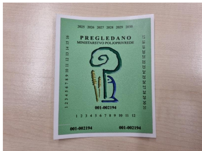
Slika 22. Naljepnica – znak o ispravnosti uređaja

Iako autori Banaj i sur. (2015.) navode da je nakon prvog službenog testiranja strojeva za zaštitu bilja u Republici Hrvatskoj propisanog normom EN 13790 evidentirano prilično loše stanje, može se utvrditi da se stanje u 2022. godini na području Požeško-slavonske županije poboljšalo. S obzirom da je Zakon već dugi niz godina na snazi, većina strojeva, izuzev novih, je već nekoliko puta pregledavana. Također svi rukovatelji prskalice i atomizera posjeduju iskaznicu za pesticide što znači da su prošli izobrazbu o sigurnom rukovanju pesticidima i pravilnoj primjeni pesticida. Isto tako, djelatnici ispitne stanice, na terenu daju praktične i korisne savjete u vezi mlaznica, održavanja strojeva, nabavke zamjenskih dijelova, kupnje novih strojeva, itd.