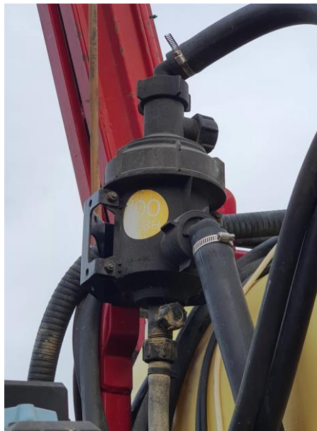
Slika 8. Pročistač

Metode ispitivanja: vizualna provjera i provjera funkcionalnosti tokom rada