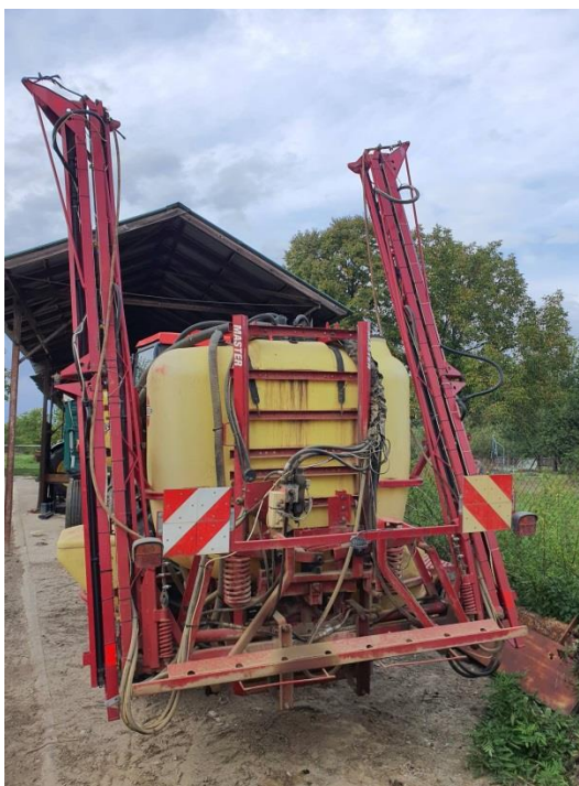
Slika 9. Grane prskalice