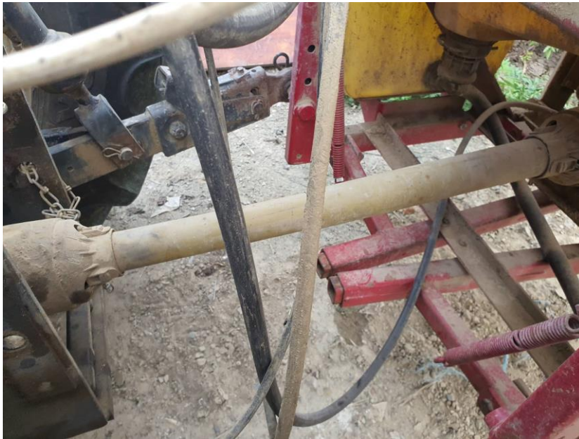
Slika 4. Priključno vratilo sa zaštitom

Metoda ispitivanja: vizualni pregled i provjera funkcionalnosti u radu