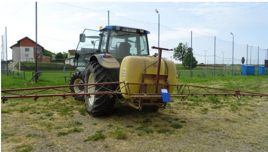
Slika 19. Prskalice Hardi 900

Slika 19. prikazuje testiranu prskalicu u vlasništvu T. S. iz Pakraca, proizvedena je 2015. godine i nošenog je tipa. Proizvođač je tvrtka Hardi International sa modelom prskalice HARDI 900. Radni zahvat iznosi 12 m te posjeduje 3 sekcije i hidraulični mješalac tekućine. Prskalice je opremljena šesteromembranskom crpkom istoimenog proizvođača sa kapacitetom protoka od 114 L. Kapacitet spremnika za tekućinu iznosi 900 L i također ima triplex nosač mlaznica, pa tako prskalice ima 24 x 3 mlaznice raspoređene na 50m. Mlaznice su tipa 110 02, 110 03 i 110 04.