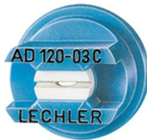
Slika 12. Anti – drift mlaznica Lechler AD 120 – 03

Za razliku od standardnih anti-drift mlaznice u sebi imaju integriranu pretkomoru prizmatskog oblika (slika 12). Opadanjem tlaka tekućine u pretkomori, prije nego što se otvori izlazni otvor, smanji se udio nepoželjnih sitnih kapljica koje se razvijaju u procesu raspršivanja. Ovim mlaznicama se postiže uža spektra kapljica u mlazu, zadovoljavajuća distribucija i manje zanošenja. Moguća je i primjena pri brzini vjetera do 4 m/s.