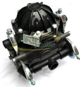
Slika 2. Crpka raspršivača Agromehanika BM65/40P