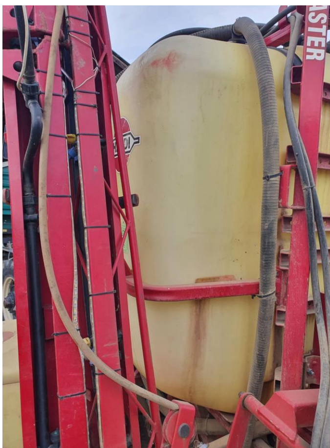
Slika 6. Spremnik za tekućinu 1000 L

Metode ispitivanja: vizualna provjera i provjera funkcionalnosti.