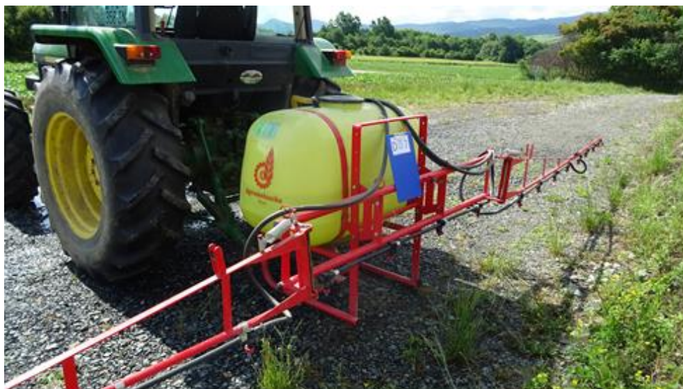
Slika 16. Prskalica AGROMEHANIKA AGS 440