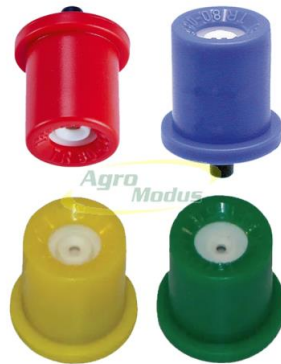
Slika 3. Mlaznice raspršivača

Mlaznice raspršivača (slika 3.) otporne na začepljenja zbog svoga okruglog dizajna otvora. Ove mlaznice su keramičke izrade te osiguravaju fine kapljice da bi se ostvarila visoka pokrivenost lisne mase, te imaju osigurač koji ih osigurava od ispadanja.