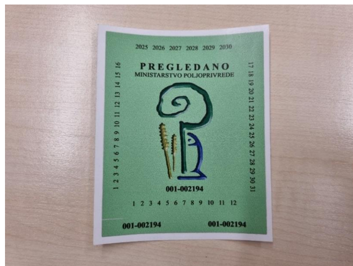
Slika 22. Naljepnica – znak o ispravnosti uređaja

Iako autori Banaj i sur. (2015.) navode da je nakon prvog službenog testiranja strojeva za zaštitu bilja u Republici Hrvatskoj propisanog normom EN 13790 evidentirano prilično loše stanje, može se utvrditi da se stanje u 2022. godini na području Požeško-slavonske županije poboljšalo. S obzirom da je Zakon već dugi niz godina na snazi, većina strojeva, izuzev novih, je već nekoliko puta pregledavana. Također svi rukovatelji prskalice i atomizera posjeduju iskaznicu za pesticide što znači da su prošli izobrazbu o sigurnom rukovanju pesticidima i pravilnoj primjeni pesticida. Isto tako, djelatnici ispitne stanice, na terenu daju praktične i korisne savjete u vezi mlaznica, održavanja strojeva, nabavke zamjenskih dijelova, kupnje novih strojeva, itd.