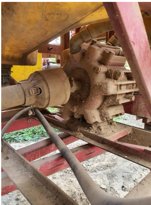
Slika 5. Klipno membranska crpka Hardi