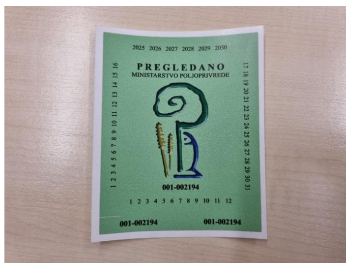
Slika 22. Naljepnica – znak o ispravnosti uređaja

Iako autori Banaj i sur. (2015.) navode da je nakon prvog službenog testiranja strojeva za zaštitu bilja u Republici Hrvatskoj propisanog normom EN 13790 evidentirano prilično loše stanje, može se utvrditi da se stanje u 2022. godini na području Požeško-slavonske županije poboljšalo. S obzirom da je Zakon već dugi niz godina na snazi, većina strojeva, izuzev novih, je već nekoliko puta pregledavana. Također svi rukovatelji prskalice i atomizera posjeduju iskaznicu za pesticide što znači da su prošli izobrazbu o sigurnom rukovanju pesticidima i pravilnoj primjeni pesticida. Isto tako, djelatnici ispitne stanice, na terenu daju praktične i korisne savjete u vezi mlaznica, održavanja strojeva, nabavke zamjenskih dijelova, kupnje novih strojeva, itd.