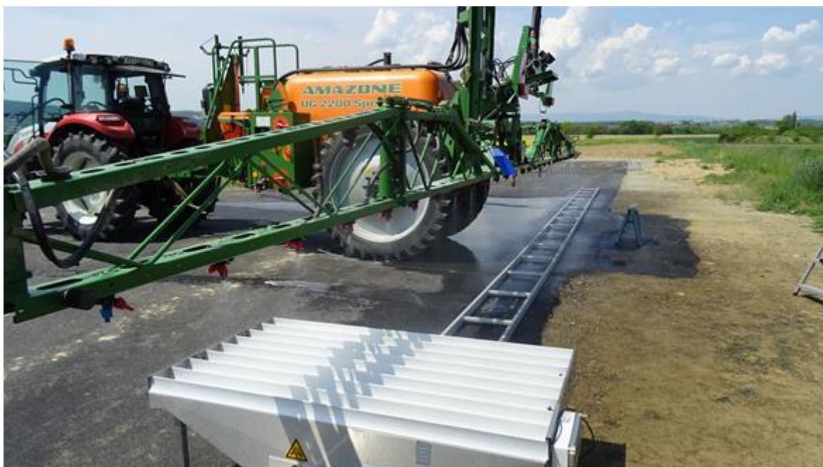
Slika 21. Prskalica AMAZONE UG 2200 SPECIAL

Prskalica u vlasništvu tvrtke Agronom iz Požega testirana je na području općine Jakšić (Slika 21.). Proizvođač prskalice je Amazone i nazivni model je UG 2200 Special. Prskalica je proizvedena 2017. godine. Radi se o tipu vučene traktorske prskalice sa 5 sekcija i radnom širinom od 15 m. Vrsta crpke je SPECIAL UG 2200 i ima protok od 250 L pri ispitivanom tlaku od 3 bara, kapacitet spremnika za sredstvo iznosi 2200 L, mješač tekućine je hidraulični, broj mlaznica je 30 x 3 jer prskalica posjeduje triplex nosač mlaznica. Mlaznice su tipa Lechler AD 120 03, AD 120 04 i ID3 04 raspoređene na 50 cm