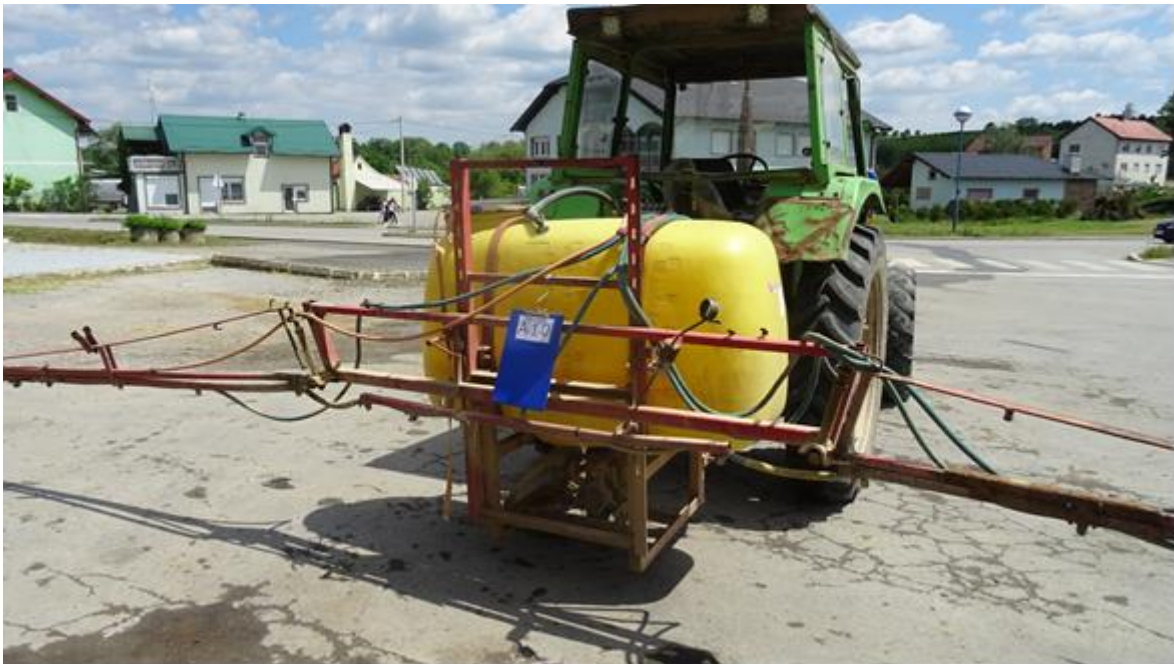
Slika 17. Prskalice MIO M – 612

Na području općine Čaglin testirana je prskalice proizvođača MIO M – 612 u vlasništvu M. B. iz Darkovca. Proizvedena je 2003. godine i nošene je izvedbe. Prskalice je opremljena crpkom tipa Zetta 100 1 C koja ima protok od 92 L pri tlaku od 3 bara. Volumen spremnika za sredstvo iznosi 660 L, mješalica hidraulične izvedbe, broj sekcija je 5, radna širina 12m sa 24 mlaznice raspoređenih na 50cm i tip mlaznice je 110 03. Navedena prskalice prikazana je na slici 17.