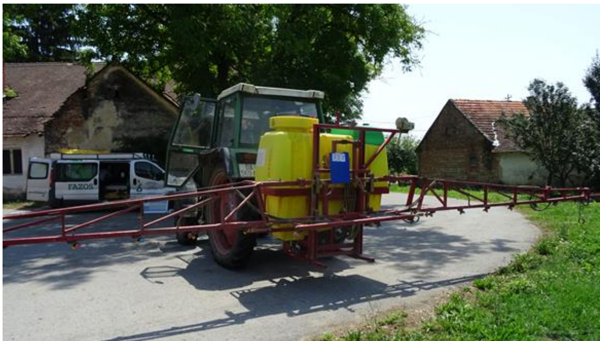
Slika 18. Prskalica LEŠKO TP 600 3R

mlaznica je 24 x 3 jer prskalica posjeduje triplex nosač mlaznica. Mlaznice su tipa Lechler IDK 120 04, 80 03 i Geoline 110 04, raspoređene na 50 cm.