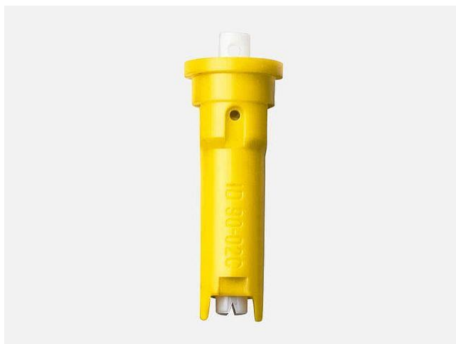
Slika 13. Injektorska mlaznica Lechler ID 90 – 02

Do raspršivanja dolazi izlaskom tekućine kroz otvor mlaznice. Glavni cilj razvoja ovog tipa mlaznice je sprječavanje zanošenja, uz zadržavanje dobrih svojstava koje imaju mlaznice sa lepezastim mlazom.