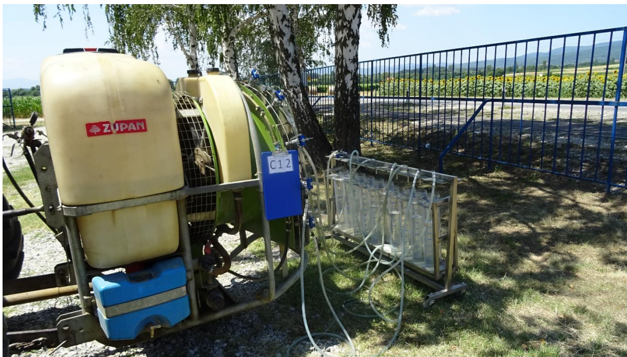
Slika 15. Raspršivač ZUPAN ZM400 S EN

Prvi testirani radni (slika 15.) stroj je raspršivač je u vlasništvu M. P. iz Kutjeva. Raspršivač je ZUPAN ZM 400 koji je proizveden 2005. godine (slika 15.). Izvedba je nošena i ima kapacitet spremnika za škropivo 450 L. Crpka je tipa KM 65/30 i volumena 61 L.