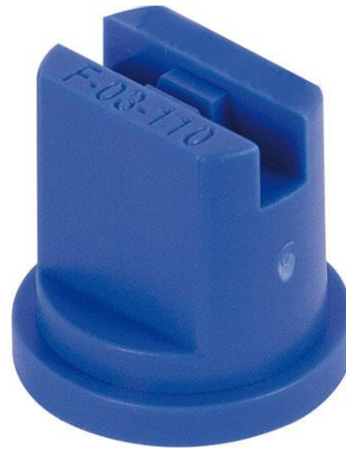
Slika 11. Standardna mlaznica 110 – 03