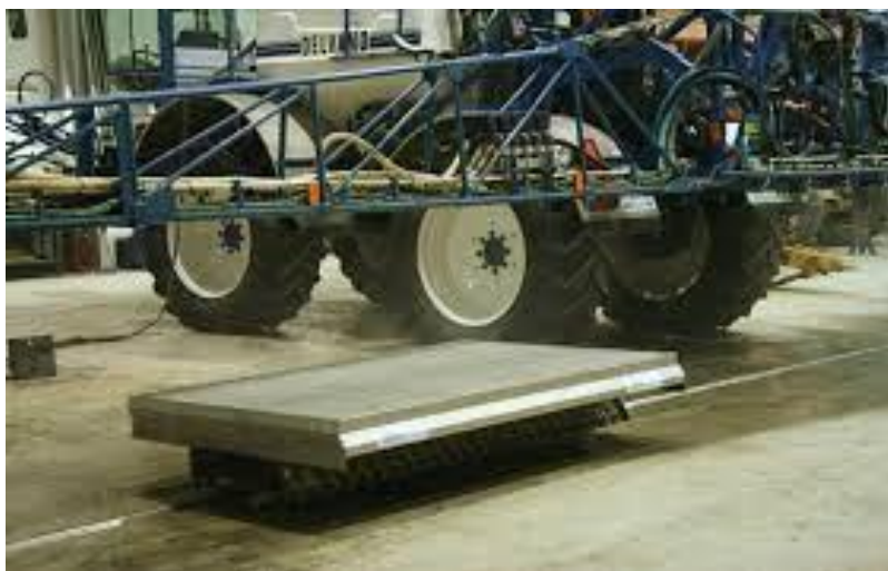
Slika 14. Spray scanner AAMS – Salvarani

Norma EN 13790 nalaže da se kod testiranja prskalice provjeri horizontalna raspodjela tekućine te odredi koeficijent varijacije. Testiranje horizontalne raspodjele tekućine obavlja se uređajem spray scanner (slika 14.). Uređaj se sastoji od aluminijskih nosača i pokretnog uređaja za mjerenje sa sabirnim žljebovima. Kontrolira se pomoću računalnog programa i stalno je u komunikaciji s računalom, pri radu se zaustavlja na razmaku od 1000 mm za mjerenje protoka. Izmjerene vrijednosti se prenesu na računalo i odmah se iscrtavaju na zaslону računala. Iz dobivenih podataka se zatim izračunava prosječni protok i pokazuje tolerancijsko polje pojedinih segmenata prskalice.