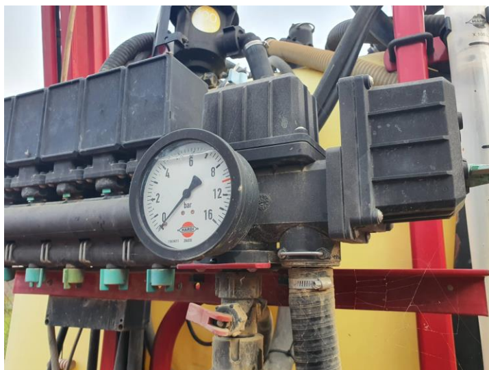
Slika 7. Regulator tlaka