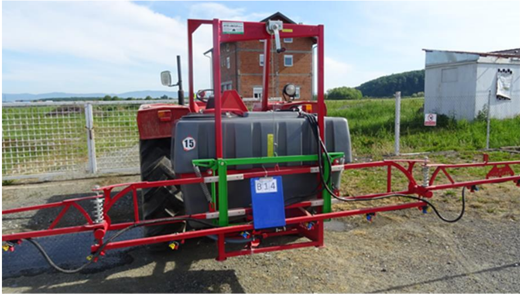
Slika 20. Prskalica DEMAROL P.P.U.H. – Zielonki P147/3