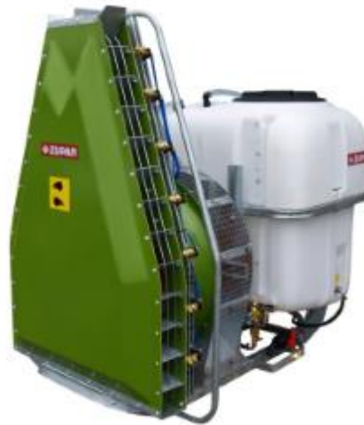
Slika 1. Raspršivač - ZUPAN VCRA

imaju izbačeni mlaz. Strujanje vjetra se ostvaruje ventilatorima koji mogu biti: radijalni, aksijalni i vertikalni.