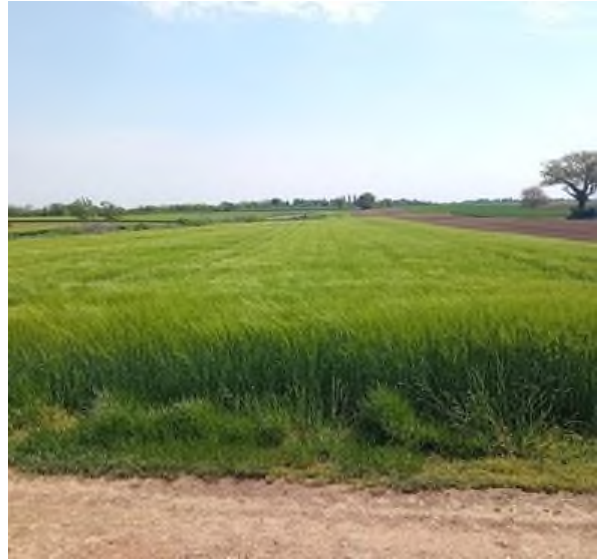
Slika 12. Polje ječma na OPG-u Štricki

Ječam je zasijan na oko pet hektara. Njime hranimo junad u obliku suhog dijela obroka do 5% udjela u koncentratu. Bogatiji je energijom u odnosu na kukuruz te je poželjan zbog plodoređa te manjih ulaganja u odnosu na kukuruz i naposljetku zbog slame.