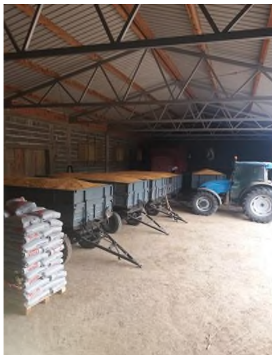
Slika 9. Unutrašnjost objekta za skladištenje mehanizacije na OPG-u Štricki