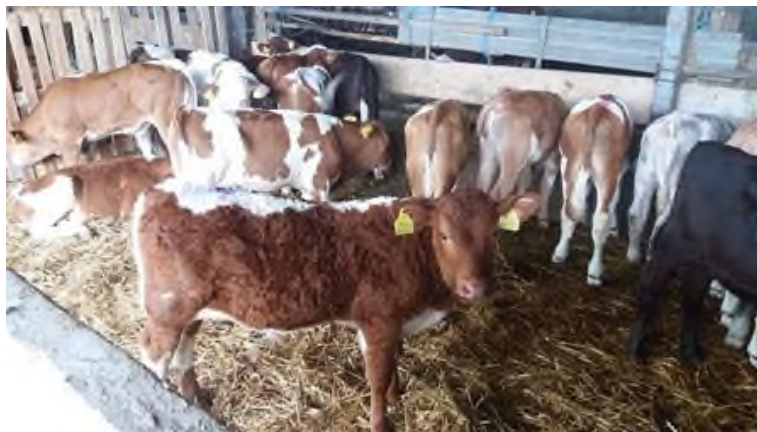
Slika 1. Tovna junad u boksu – OPG Štricki

U Hrvatskoj dominiraju tehnologije proizvodnje junećeg mesa, posebice mlade junetine. Ranijih desetljeća tehnologija proizvodnje mlade junetine prvenstveno se temeljila na simentalском genotipu, dočim se u aktualnom vremenu također uz simentalску koriste i druge mesne pasmine kao i njihovi križanci. Tehnologija proizvodnje mlade junetine uglavnom se temelji na hranidbi obrokom visoke razine energije i proteina te nešto nižim završnim (klaoničkim) masama životinja. (Ivanković i Mijić, 2020.).