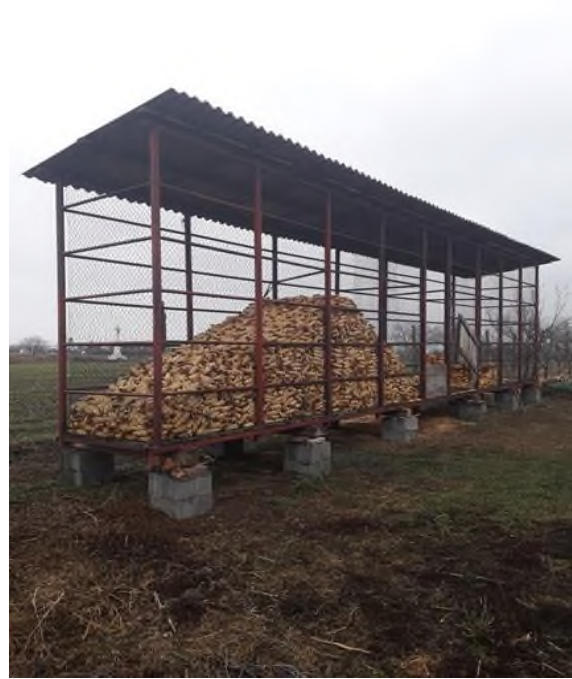
Slika 7. Skladište kukuruza na OPG-u Štricki

Pored staje nalazi se skladište za kukuruz u klipovima. Metalne je konstrukcije i kapaciteta 20 tona. U planu je izgradnja silosa za kukuruz u zrnu kapaciteta 150 tona kako bi omogućili povećanje broja grla te smanjili opseg posla koji se obavlja prilikom skladištenja kukuruza u klipovima. Na iznajmljenom zemljištu pored farme se nalazi skladište za slamu manjeg kapaciteta koji služi privremeno kao zamjena za sjenik koji nije obnovljen nakon požara. Drvene je konstrukcije i kapaciteta oko 100 rolo bala.