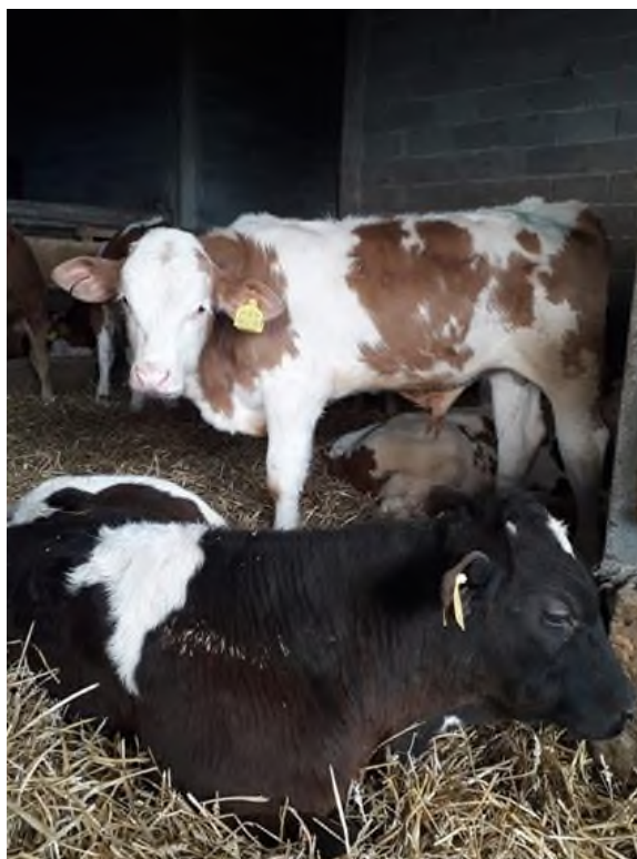
Slika 10. Telad u tovu na OPG-u Štricki