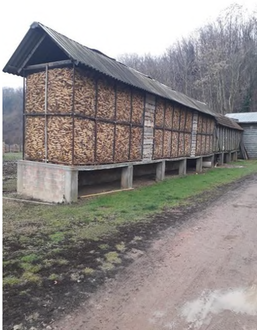
Slika 8. Skladište kukuruza u klipovima na OPG-u Štricki