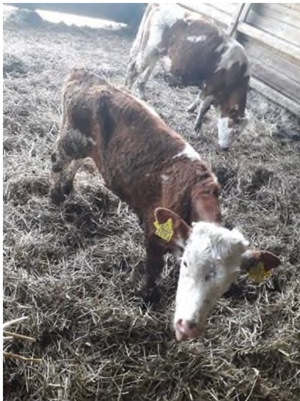
Slika 17. Tele s upalom pluća

Osim navedenih bolesti dolazi i do raznih ozljeda. Najčešće su to uganuća zglobova nastala prilikom kretanja na dubokoj stelji te ogrebotine nastale češanjem ili prilikom borbe od strane druge jedinke. U slučaju značajnijih ozljeda, životinju izdvajamo iz boksa u odvojen prostor. Ondje životinje borave individualno te se ne vraćaju natrag u stado. Ukoliko liječenje od strane veterinara ne utječe pozitivno na ozljede ili bolest, životinja se šalje na prisilno klanje u obližnju klaonicu.