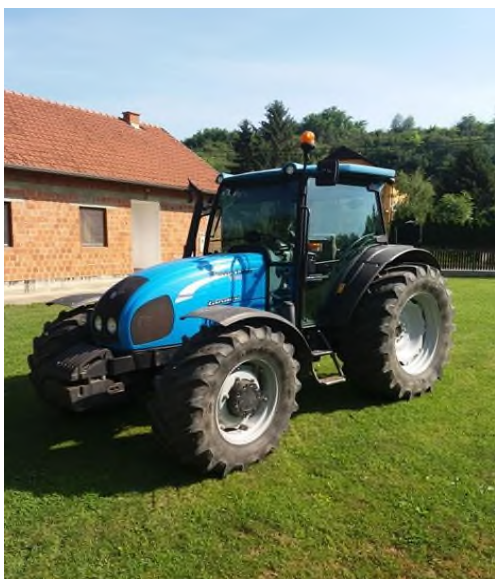
Slika 15. Traktor Landini na OPG-u Štricki

OPG Štricki raspolaže sa svom potrebnom mehanizacijom za proizvodnju ratarskih kultura kao što su kukuruz, suncokret, pšenica, ječam. Sama mehanizacija je starijeg tipa te je prilagođena količini zemlje koju gospodarstvo obrađuje. Od osnovnih strojeva za obavljanje ratarskih poslova OPG Štricki posjeduje 6 traktora u rasponu snage od 29 kW do 78kW te žitni kombajn pomoću kojeg žanjemo sve ratarske usjeve u vrijeme njihove zriobe.