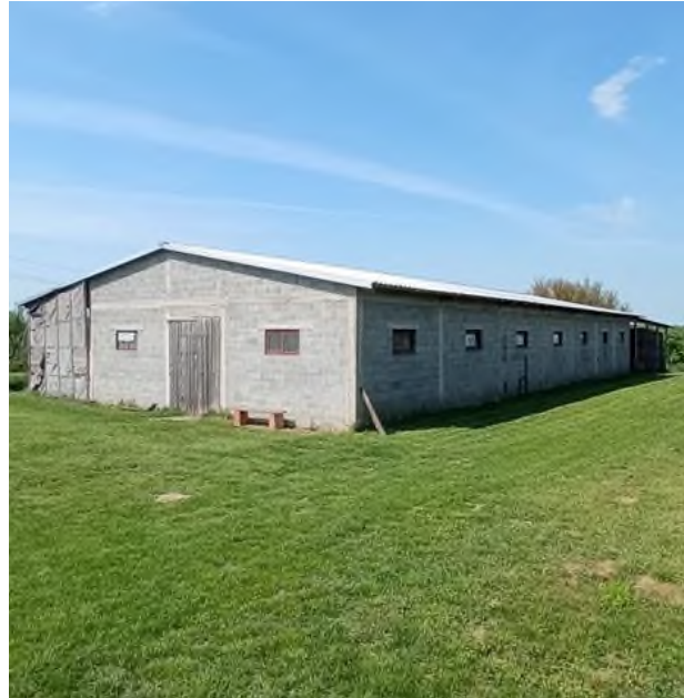
Slika 5. Tovni objekt na OPG-u Štricki - pogled izvana