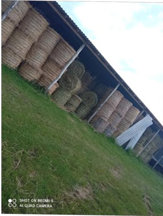
Slika 6. Objekt za skladištenje sijena na OPG-u Štricki