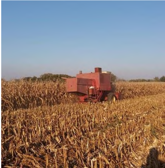
Slika 11. Žetva kukuruza na OPG-u Štricki