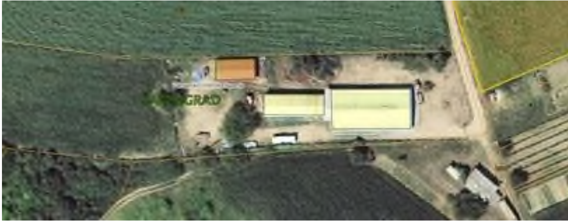
Slika 3. Satelitski prikaz OPG-a – Štricki, Šarengrad