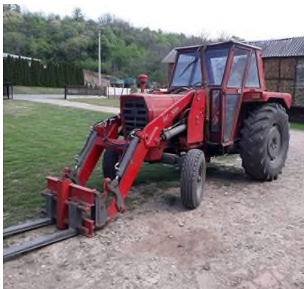
Slika 16. Traktor IMT 560 sa utovarivačem na OPG-u Štricki

Također za obradu usjeva gospodarstvo posjeduje brojne priključne strojeve za obradu tla, transport i preradu žitarica. Uz proizvodnju krmiva, gospodarstvo uzgaja pivarski ječam, te uljni suncokret.