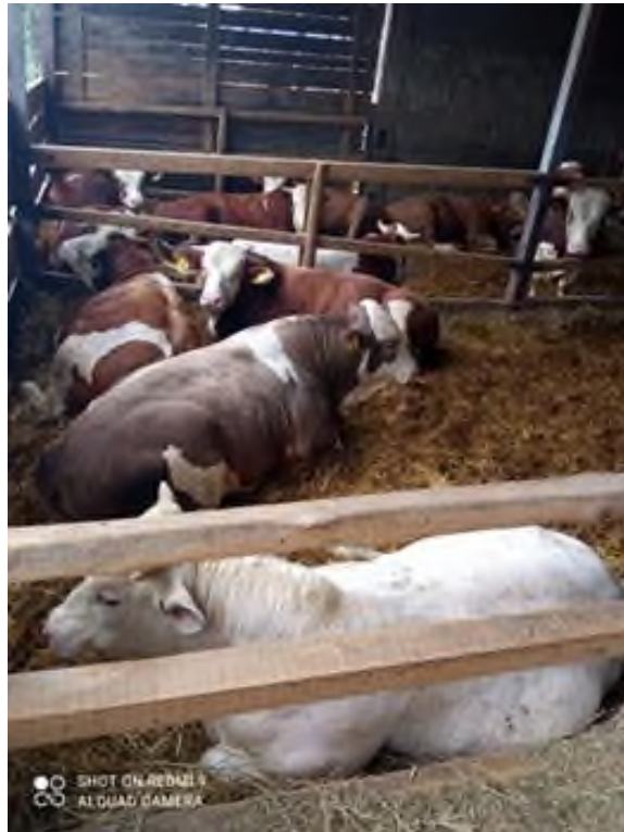
Slika 2. Goveda u boksu na OPG-u Štricki

postaje sve traženija na tržištu, te manji broj grla Limousin i Charolais pasmine. Pored čistokrvnog uzgoja, na farmi se mogu vidjeti i poneki križanac mesnih pasmina te križanci mliječne pasmine Holsteina s mesnom Belgijsko-plavim govedom. Farma svoj tovni materijal najvećim dijelom uvozi iz Rumunjske.