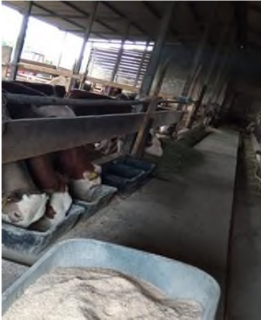
Slika 4. Tovni objekt na OPG-u Štricki - pogled iznutra

U sklopu glavnog objekta su dvije prostorije duljine i širine četiri metra koje su prvotno namijenjene za bazen s mlijekom te opremu za mužnju, a sada imaju funkciju podnog skladišta za kukuruz u zrnju te za prostor za pripremu koncentrirane hrane za junad.