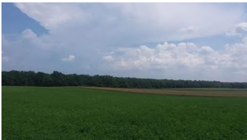
Slika 13. Polje lucerne na OPG-u Štricki

Lucerna ( Medicago sativa ) zauzima 5 ha zemljišta. U našim krajevima daje izvrsne prinose te 3-4 otkosa godišnje. Vijek iskorištenja je najčešće 4-5 godina te je vrlo zahvalna kultura i ne iziskuje velika ulaganja i otporna je na sušu. Lucernu koristimo isključivo u obliku sijena koje skladištimo u obliku rolo bala na suhim i prozračnim mjestima.