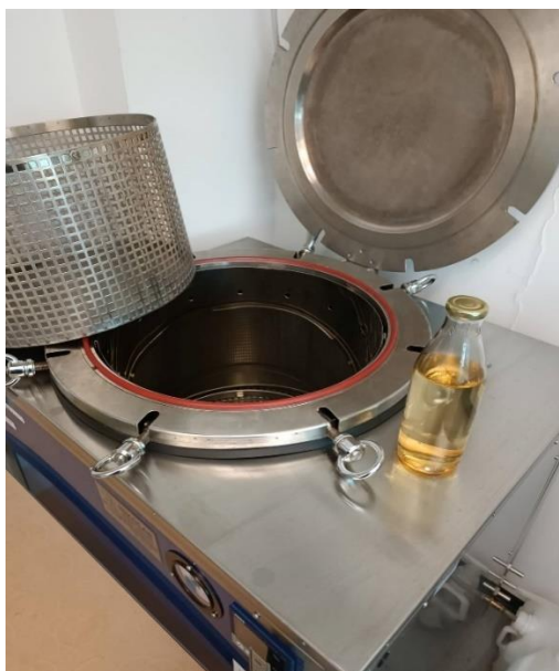
Slika 3. Autoklav korišten za sterilizaciju boca u kojima se pripremaju hranjive podloge

Napravljene podloge su se zatim morale ohladiti prije nego li se sadržaj mogao koristiti, tj. prelići u praznu Petrijevu zdjelicu. Nakon što se boca ohladila, sadržaj se prelio u praznu Petrijevu zdjelicu, zatim se uzela Petrijeva zdjelica s kolonijama korisnih mikroorganizama (Slika 4.), te su se sa sterilnom ezom mikroorganizmi prenosili u Petrijeve zdjelice s hranjivim podlogama i tako se stvarale nove kolonije za upotrebu. Kasnije su se uzeli prethodno uzgojeni mikroorganizmi te su se sa sterilnom ezom pažljivo prenijeli u bocu s hranjivom podlogom (Slika 5.). Gotove boce s korisnim mikroorganizmima pažljivo spremile na policu dok nisu bile spremne za upotrebu (Slika 6.).