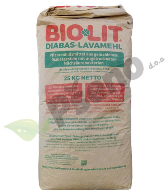
Slika 1. Biolit kameno brašno, supstrat za biopreparat

Proizvodnja biopreparata počela je s odabirom pravilnog supstrata za uzgoj adekvatnih mikroorganizama. Bio-lit (Slika 1.) je poboljšivač tla koji služi kao dobar supstrat za korisne mikroorganizme u sklopu ovog istraživanja. 1,5 kg Bio-lita se dodalo u vrećicu te je to predstavljalo prvi korak u proizvodnji biopreparata za ovo istraživanje.