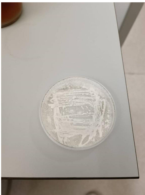
Slika 4. Kolonije korisnih mikroorganizama za potrebe proizvodnje biopreparata