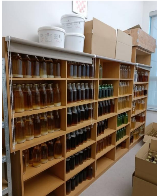
Slika 6. Boce s korisnim mikroorganizmima

U prethodno pripremljene vrećice s 1.5 kg Bio-lita pažljivo su se ulili mikroorganizmi Azotobacter chroococcum i Azospirillum brasilense , zatim su se dobro umiješali s supstratom, hermetički zatvorili s varilicom (Slika 7.) te je takva vrećica (Slika 8.) spremna za tretiranje sjemena. Na isti način se pripremio i biopreparat za zaštitu od bolesti koji je sadržavao benefitnu gljivu Trichoderma harzianum i bakteriju Bacillus subtilis (Slika 9.).