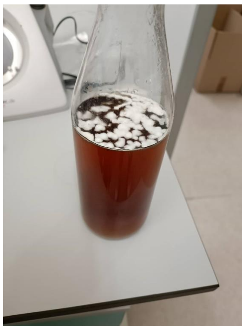
Slika 5. Mikroorganizmi u boci s hranjivom podlogom