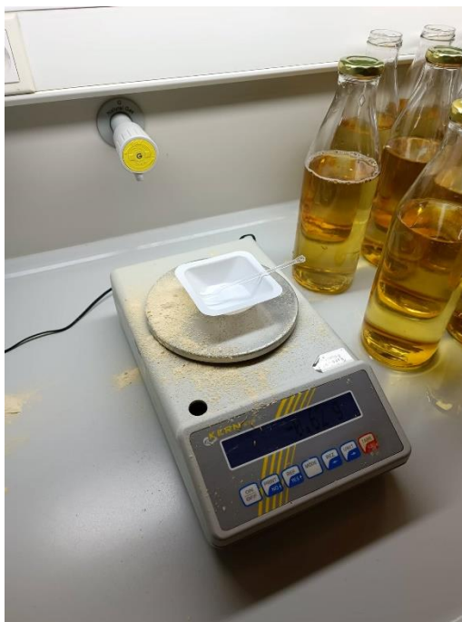
Slika 2. Vaga KERN 572 korištena za pripremu hranjivih podloga

pojedine sastojke ovisno kakva se podloga radila, da li je ona čvrsta ili tekuća. Za svaku podlogu bila je potrebna određena gramaža različitih sastojaka. Od hranjivih podloga se pripremao: Potato Dextrose Broth, Potato Dextrose Agar, Mycorrhiza medium (tekuća i čvrsta), Nutrient Broth i Azospirillum medium (tekući i čvrsti). Nakon što bi se za određenu kulturu od navedenih pripremio sadržaj, taj se sadržaj usipao u čistu bocu te se zatim taj sadržaj prelije destiliranom vodom i čvrsto zatvori čepom. Nakon rada s vagom (Slika 2.), ista se morala očistiti i isključiti.