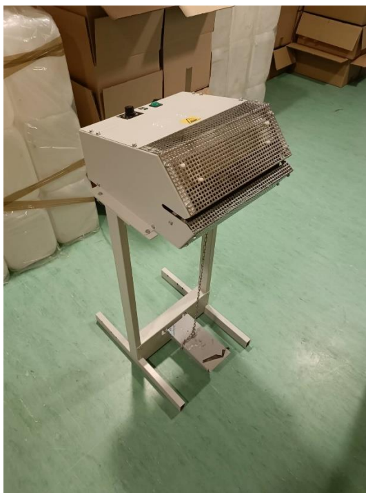
Slika 7. Varilica za varenje vrećica