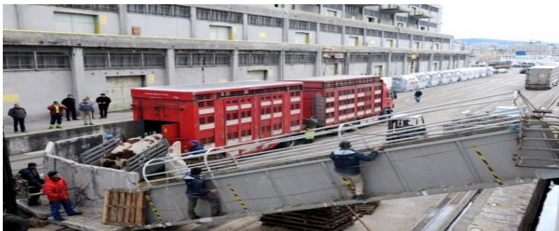
Slika 13. Kamion za transport stoke