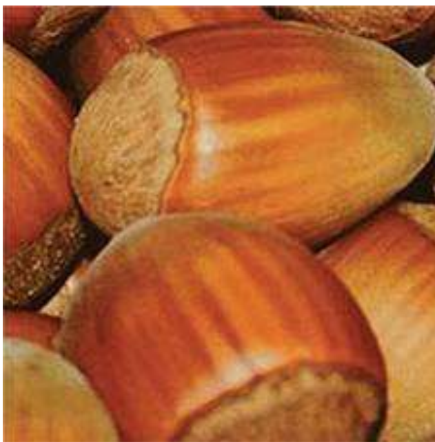
Slika 2. Istarski duguljasti

Postoji velik broj različitih sorti lješnjaka, koje svoje porijeklo vuku iz različitih krajeva svijeta. Više je od 20 različitih osnovnih sorti lješnjaka koje posjeduju i svoje podvrste (www.agroklub.com, 2022.). U Hrvatskoj najzastupljenije sorte lješnjaka su Istarski duguljasti (Slika 2) i Rimski (Slika 3) i to su sorte koje zajedno zauzimaju oko 80 % ukupnog broja stabala. Ostale sorte su Haleški div, Istarski okrugli, Negret, Tonda di Giffoni, Tonda Gentile Romana (Jakobović i sur., 2020.).