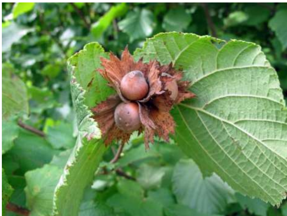
Slika 1. List i plod obične lijeske ( Corylus avellana )

oko 30 cm. Reše su muški cvjetovi, a ženski su jedva vidljivi i imaju izrazito crvene tučke. Plod lijeske, lješnjak, nalazi se u zelenom omotaču. Životni vijek lijeske je od 70 do 100 godina, a plod donosi od 50 do 70 godina. Urod lijeske počinje u trećoj ili četvrtoj godini, a u puni urod dolazi sa sedam ili osam godina. U punom urodu jedno stablo daje od 8 do 12 kg, a od ploda oko 50 % otpada na ljusku (www.agroklub.com, 2022.). Postoje različite sorte lijeske, odnosno lješnjaka, o čemu će biti govora u sljedećem potpoglavlju.