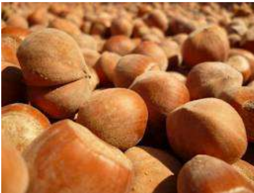
Slika 3. Rimski