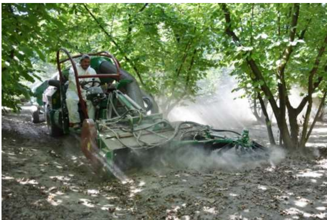
Slika 6. Strojno branje lješnjaka

Lješnjaci se, ovisno o sorti, beru od kraja srpnja pa do početka listopada. Berba može biti ručna ili strojna (Slika 6). Plodovi su zreli onda kada promjene boju i kada lako ispadaju iz omotača. Plodovi koji su sasvim zreli imaju žutosmeđu boju. Prerano obrani plodovi imaju manju kvalitetu, a jezgre su smežurane i žilave. Kod nekih sorti berba je otežana jer ne dozrijevaju svi u isto vrijeme, dok se kod nekih sorti plodovi teško oslobađaju iz omotača. Nakon berbe provodi se komušanje (čišćenje ploda lješnjaka od ovojnice), sušenje (prirodnim putem ili u sušari), kalibriranje (sortiranje ploda po veličini – klasiranje), krckanje (drobljenje ljuske) te na kraju i čišćenje jezgre od ljuske (Jakobović i sur., 2020.).