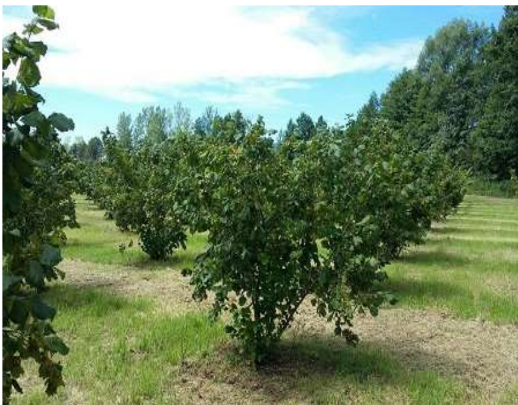
Slika 4. Uzgojni oblik grmolita vaza

dvogodišnjih sadnica. Nasadi u manjoj mjeri posađeni su cijepljenjem na podlogu Corylus colurna . Uzgojni oblik koji najzastupljeniji je modificirana grmolika vaza (Slika 4), no u novijim nasadima počeo se saditi uzgojni oblik stablo te gušći sklopovi sadnje kako bi se olakšala strojna berba. Kod ekološke proizvodnje što se tiče održavanja nasada postoji tendencija uklanjanja korijenovih izdanaka. U intenzivnim nasadima važno je da su svojstva grmova lijeske u cijeloj plantaži ujednačena i da među njima nema značajnijih razlika (Vujević i sur., 2017.).