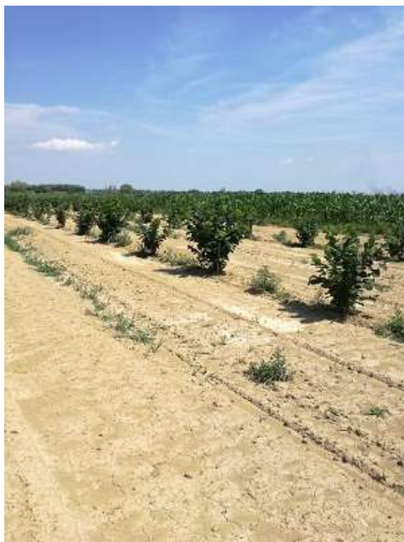
Slika 5. Razmak između redova